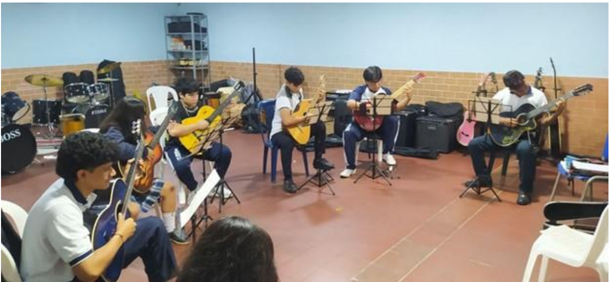
Figura 5 Registro fotográfico sesiones de formación.