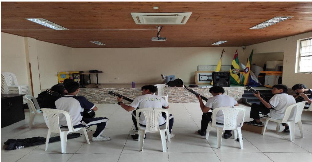
Figura 1 Registro fotográfico sesiones de formación.

Tanto la Institución Educativa Jorge Ardila Duarte como la institución educativa Campo Hermoso suministraron para cada sesión de formación espacios de trabajo, conforme la disponibilidad de estos en cada una de ellas, de acuerdo con las fechas estipuladas en los cronogramas de trabajo programados, los espacios proporcionados pasaron desde salones, de diversas dimensiones, hasta auditorios y salas de reunión.