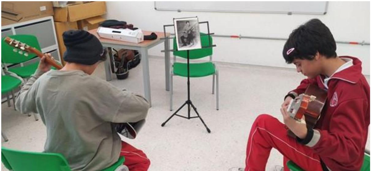
Figura 3 Registro fotográfico sesiones de formación.