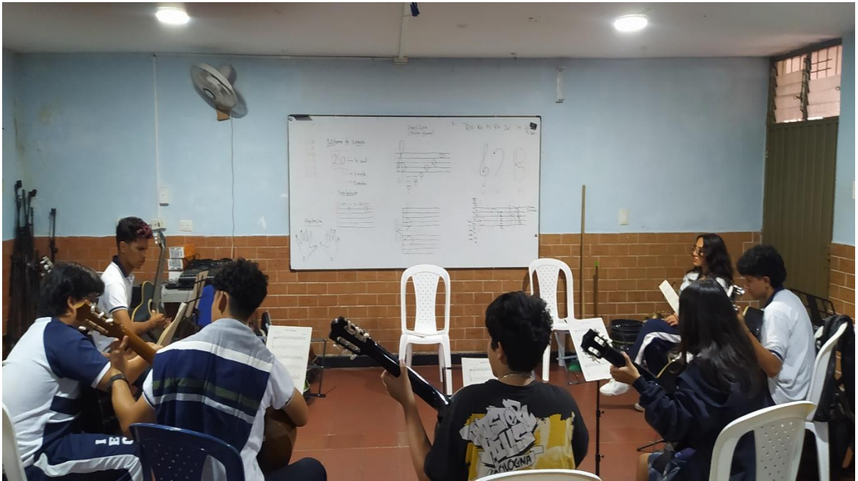
Figura 4 Registro fotográfico sesiones de formación