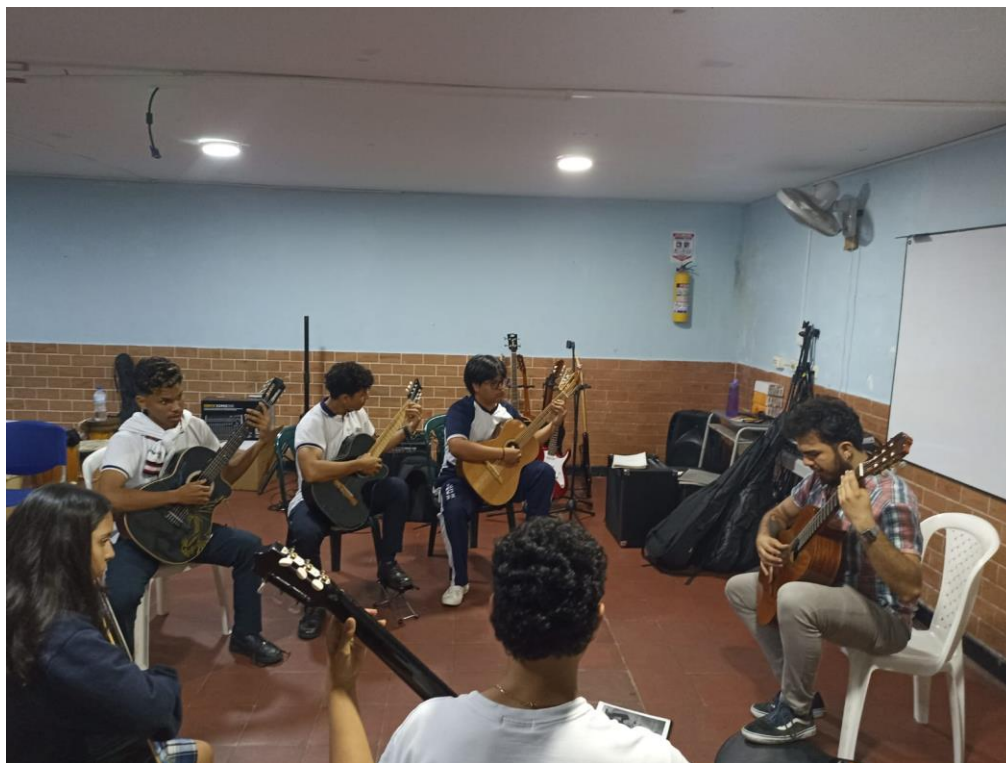
Figura 2: Registro fotográfico sesiones de formación.

espacios no contaban con equipos audiovisuales idóneos para su uso, no obstante lo anterior no impidió el correcto desarrollo de las sesiones de formación.