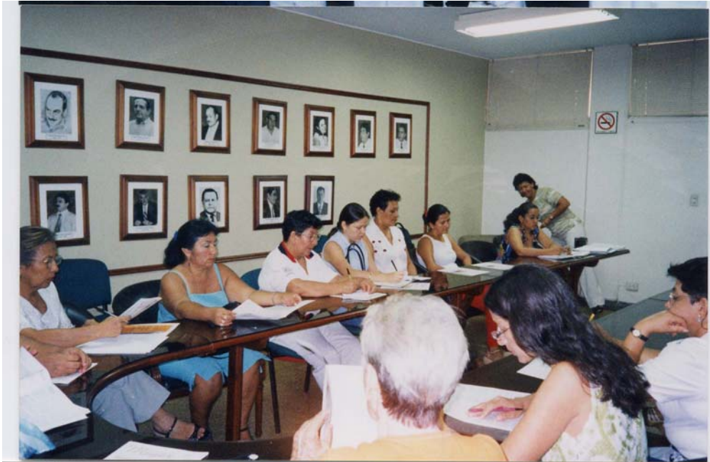
Foto 5. Noviembre del 2003 - Participación encuentro departamental de iniciativa de mujeres por la paz