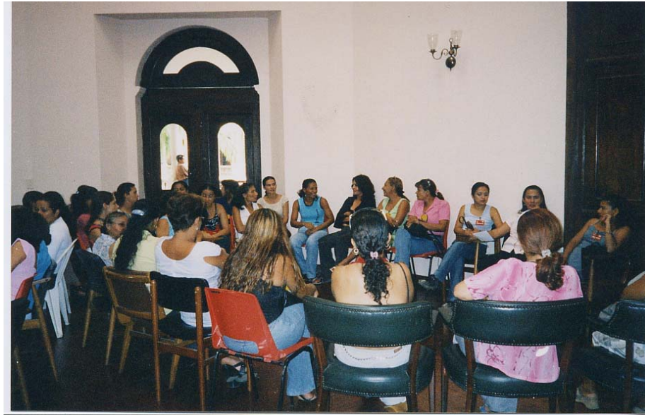
Foto 1. Población de Cúcuta y Villa del Rosario – Taller: “Género en el desarrollo”