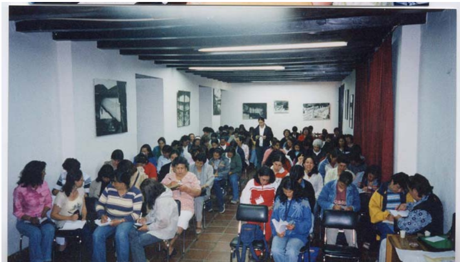
Foto 2. Población Pamplona – Taller: “Planeación de vida y trabajo y género en el desarrollo”