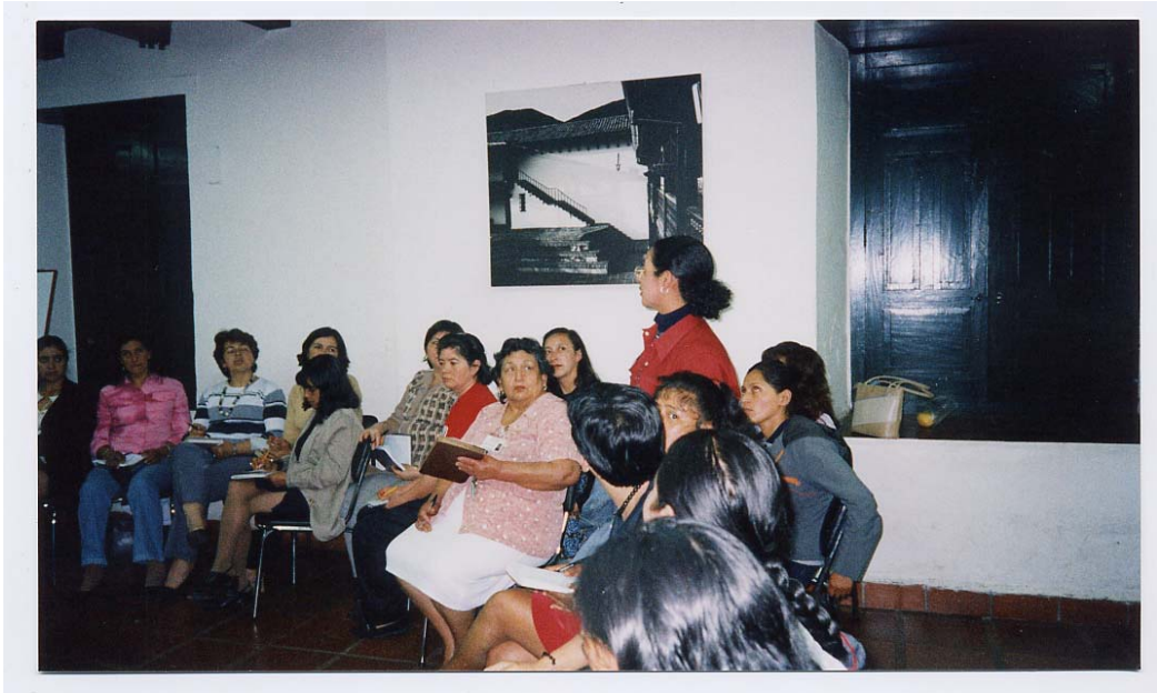
Foto 3. Población Cúcuta - Segundo encuentro sobre rol, política y derechos de la mujer (1)