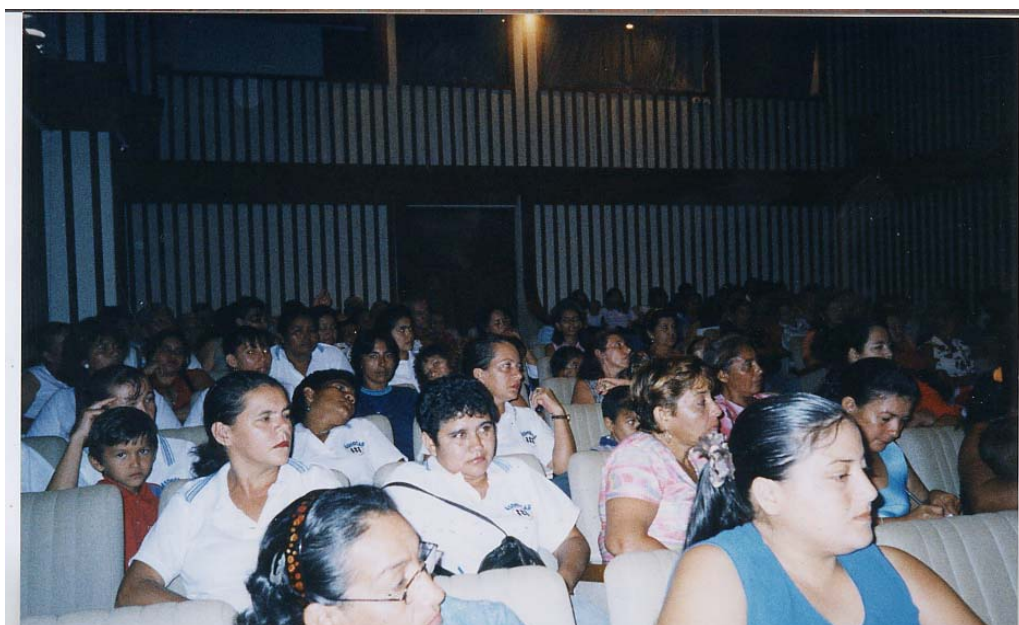
Foto 7. Semana 8 de marzo del 2004 – Taller: “Alcoholismo, drogadicción y salud sexual y reproductiva”