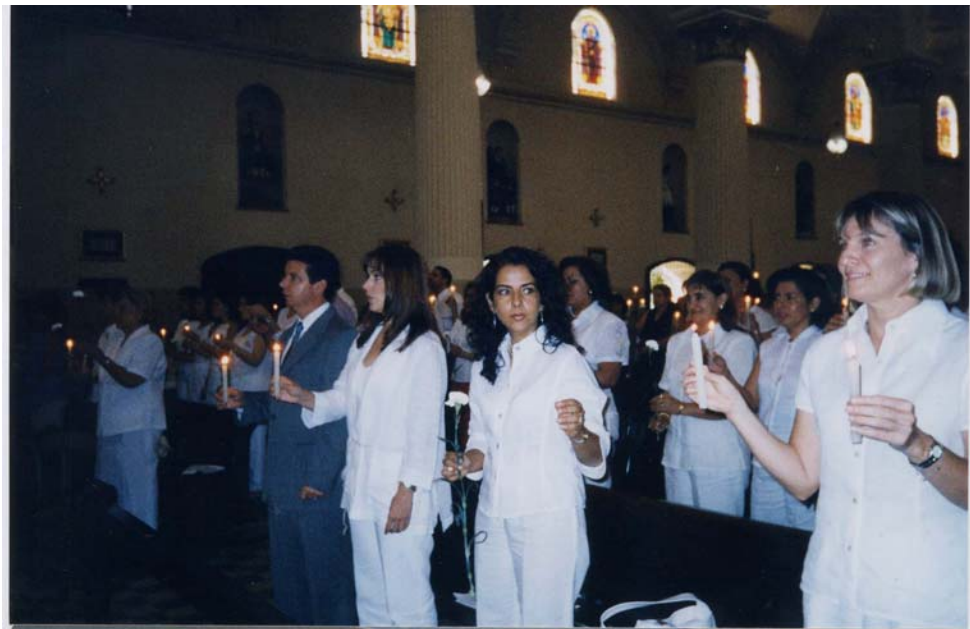
Foto 6. Población Cúcuta - Celebración día internacional de la mujer (8 de marzo del 2004) TEDEUM