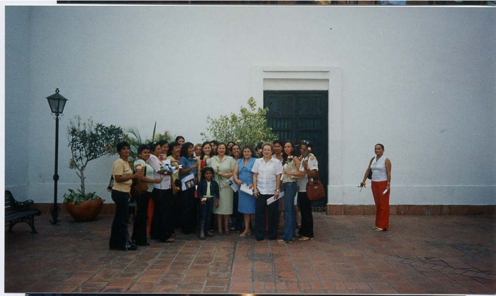
Foto 4. Población Cúcuta - Segundo encuentro sobre rol, política y derechos de la mujer (2)