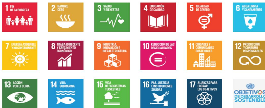
Figura 1. Objetivos de Desarrollo Sostenible 2015-2030.

Entre los 17 Objetivos de Desarrollo Sostenible planteados a partir de los desafíos sociales, ambientales, políticos y económicos enfrentados a nivel internacional, se encuentra el objetivo 16 denominado PAZ, JUSTICIA E INSTITUCIONES SÓLIDAS. El objetivo 16 de los Objetivos de Desarrollo Sostenible propuestos, tiene como eje central la promoción de sociedades pacíficas e inclusivas para el desarrollo sostenible, la provisión de acceso a la justicia para todos y la construcción de instituciones responsables y eficaces a todos los niveles.