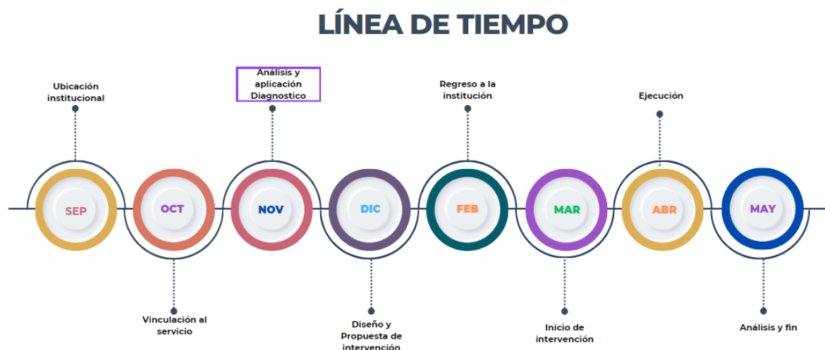
Figura 2 Línea de tiempo

En la línea de tiempo se detallan los momentos clave del proceso de diagnóstico, destacando cómo se llevó a cabo la identificación de fortalezas, debilidades, oportunidades y amenazas. Estos aspectos se presentan organizados en distintos apartados para una mejor comprensión se desarrolló la siguiente línea de tiempo.