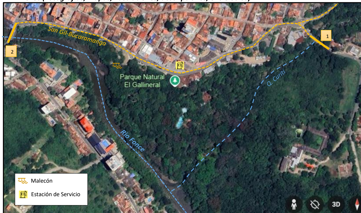
Imagen satelital de la ubicación geográfica de SG 14 Parque Gallineral, denotando la cercanía del Lugar de Interés Geológico (LIG) al desarrollo urbano, visualizando su extensión de área que abarca desde el (1) Puente Ragonessi hasta el Malecón del Río Fonce finalizando en el (2) Puente Rojas Pinilla, esta delimitada y en relación directa con los cauces del Río Fonce y la Quebrada Curití. La entrada principal al reciento se encuentra al interior de una plazoleta frente a la estación de gas (EDS Primax) al margen derecho por la Vía San Gil-Bucaramanga.