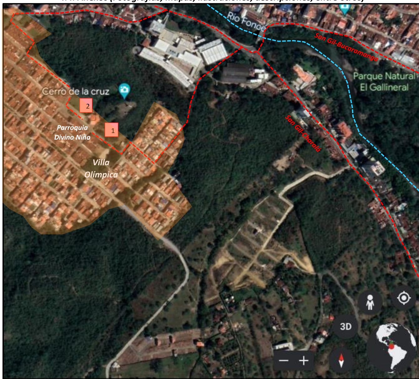
Imagen satelital ubicación y diferentes rutas de acceso al SG 06 Cerro de la Cruz (1) pasando el Puente Rojas Pinilla desde la intersección de la vía San Gil-Bucaramanga y la vía San Gil Charalá en lo denominado Monumento la Hoja de Tabaco se asciende hasta llegar a la Parroquia Divino Niño; (2) Vía de ingreso al sector Villa Olímpica donde se encuentra el recinto religioso (Tomado y modificado: Google Earth).