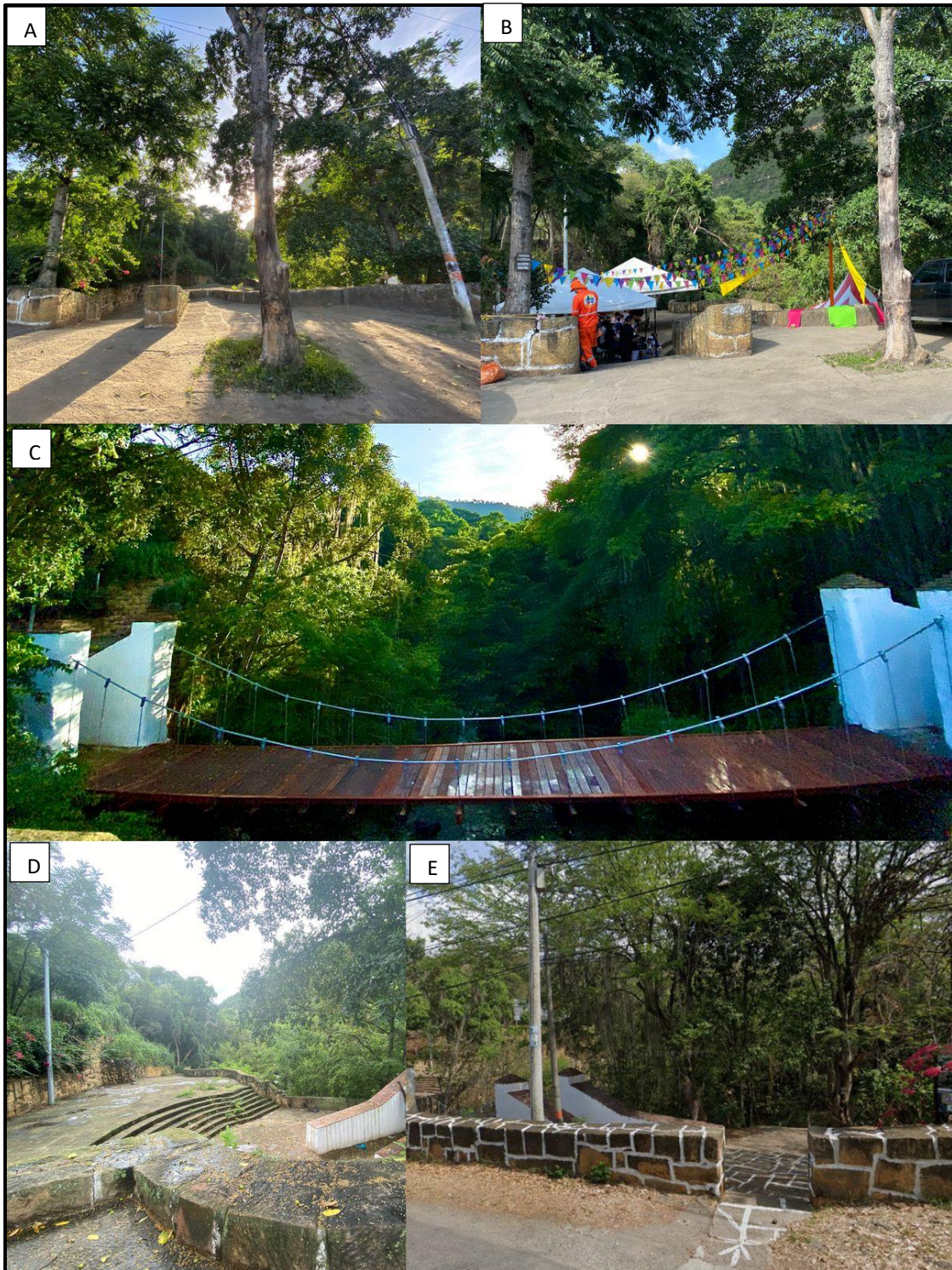
A)Entrada principal al SG 15 Parque Ragonessi 15 m antes de cruzar el Puente; B)Evento cultural en la plazoleta del Parque con énfasis medioambiental organizado por la Administración Municipal; C)Puente colgante en madera también denominado Ragonessi, conectando el Parque de un costado al otro sobre la Q. Curití, rodeado de abundante naturaleza; D) Plazoleta y graderías que conforman el Parque utilizadas para la presentación de espectáculos y realización de eventos culturales; E)Plaza que se encuentra al cruzar la Quebrada por el puente peatonal, al margen derecho de esta y acceso a la ruta paralela al cauce.