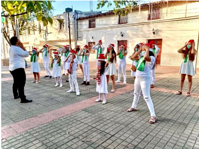
Figura 11 Muestra semestral