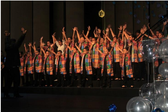
Figura 12 Participación en festivales