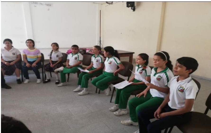
Figura 2 Evidencia de convocatoria