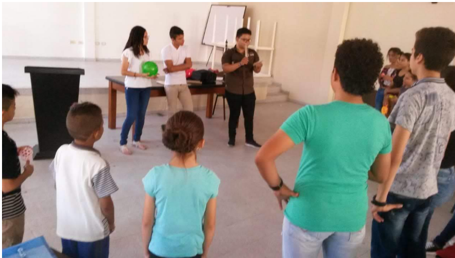
Figura 5 Enseñanza desde cero

estas estrategias, los participantes exploraron su potencial vocal y se expresaron artísticamente, creando un entorno de aprendizaje motivador y enriquecedor.