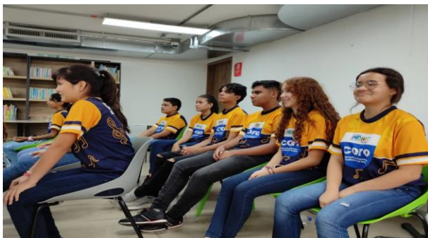
Figura 9 Evidencia de actividades ejecutadas

Esto se presenció en distintos festivales corales que tienen el enfoque pedagógico, como el Festival de coros “La Cuerda” realizado en Bucaramanga Santander.