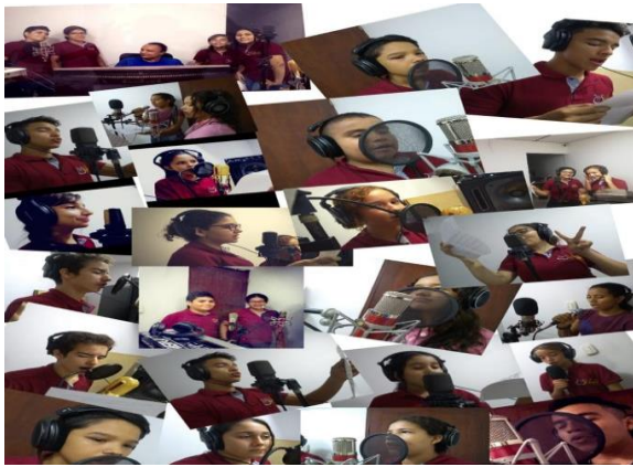
Figura 10 Evidencias del home studio

creando un sentido de pertenencia y comunidad. Esto se realizó mediante un video musical, en el cual se grabaron voces en un “home studio” luego, se hizo el video y se montó en la plataforma YouTube. Con ello se encontró la manera de darle proyección al proceso y seguir motivación a los niños y jóvenes a abrirse caminos a través de la música.