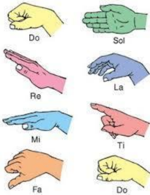
Figura 7 Signos Curwen, del método Kodály