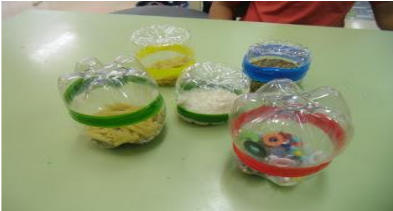
Figura 3 Objetófonos