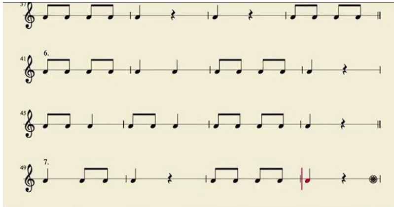
Figura 4 Patrones rítmicos iniciales para practicar con los objetófonos