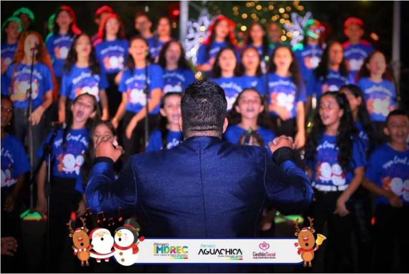
Figura 13 Evidencia del Ensamble