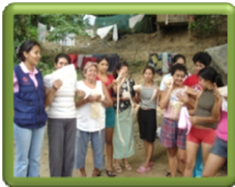
Capacitación en macramé/manicure pedicura

Cabe resaltar que en Chimita se han desarrollado capacitaciones, por parte de las diversas instituciones que hacen presencia en el albergue en cursos de macramé, pedicura/manicura, bisutería, primeros auxilios, entre otras. Estas capacitaciones han sido de gran ayuda para las personas que se vincularon a ellas, puesto que representan una base para conseguir algún tipo de empleo.