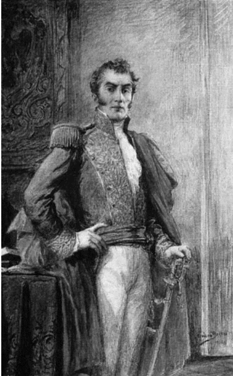
Imagen 1. “Nariño con su traje acostumbrado: uniforme de general, y sobre él un saco o sobretodo de color leonado, sombrero al tres, calzón blanco, bota alta de campaña, banda carmesí, pistolas y espada.