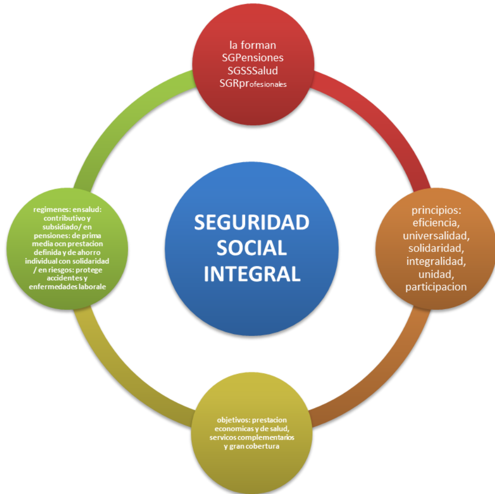
Figura 2. Seguridad social integral

Para el desarrollo de la práctica jurídica empresarial en OTACC S.A. se hace indispensable el conocimiento de la normatividad vigente, para ajustar todas las relaciones laborales a derecho, cumpliendo así con el objetivo de la misma y propender por el beneficio de los dos extremos laborales. En ese sentido se requiere el conocimiento y actualización de las normas de allí que sea fundamental el decreto 1072 de 2015, Código Sustantivo del Trabajo, Ley 100 de 1993 la cual estipula lo concerniente al Sistema General de Seguridad Social en