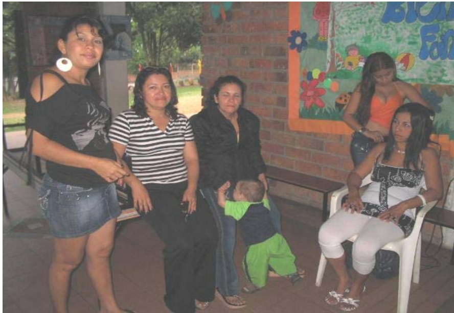
Foto actividad de belleza. Programa mujeres con valor.2008