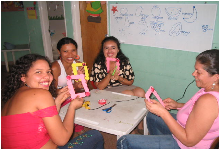
Foto actividad Mujeres con Valor.2008