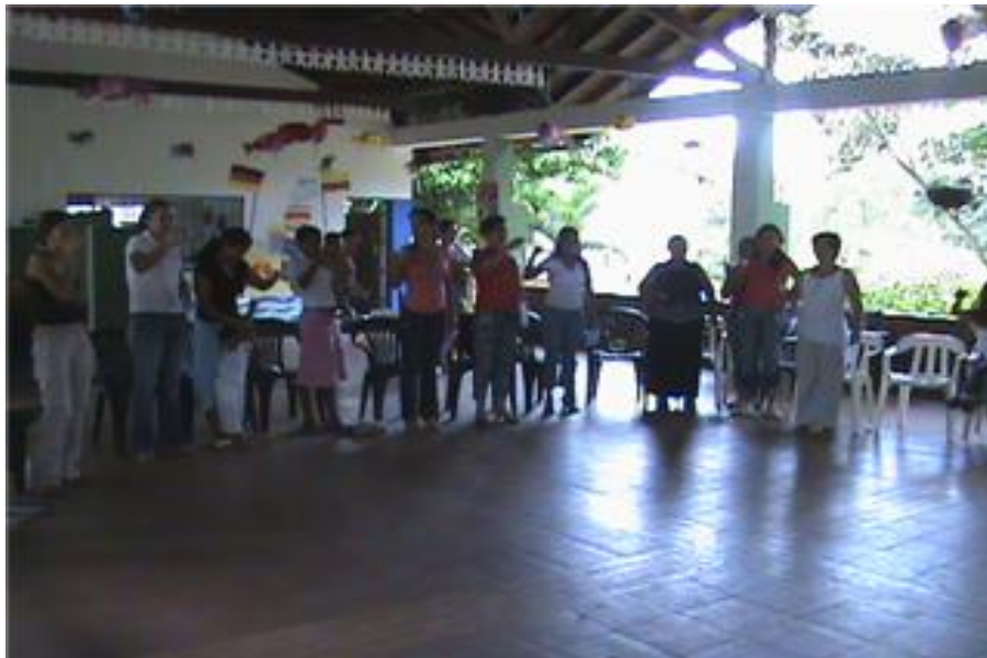
Foto Actividad recreativa. Grupo mujeres con Valor. Fundación Romelio.