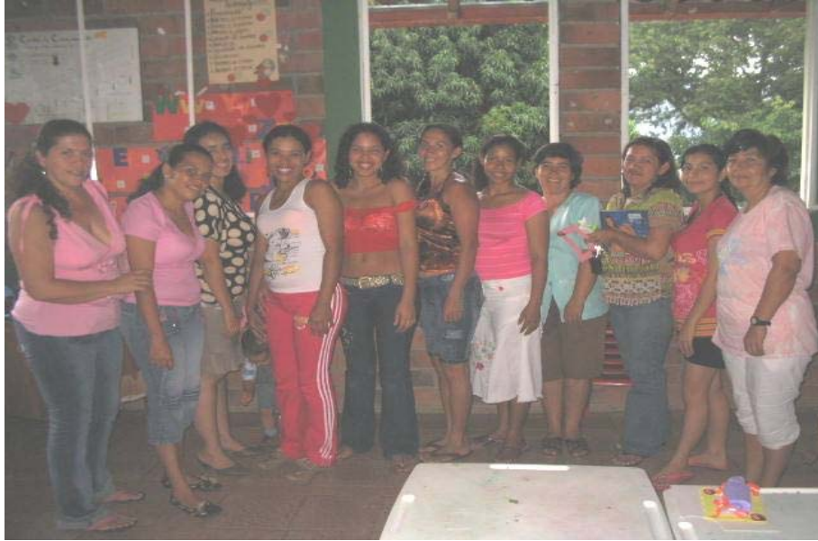
Foto grupo mujeres con valor 2008