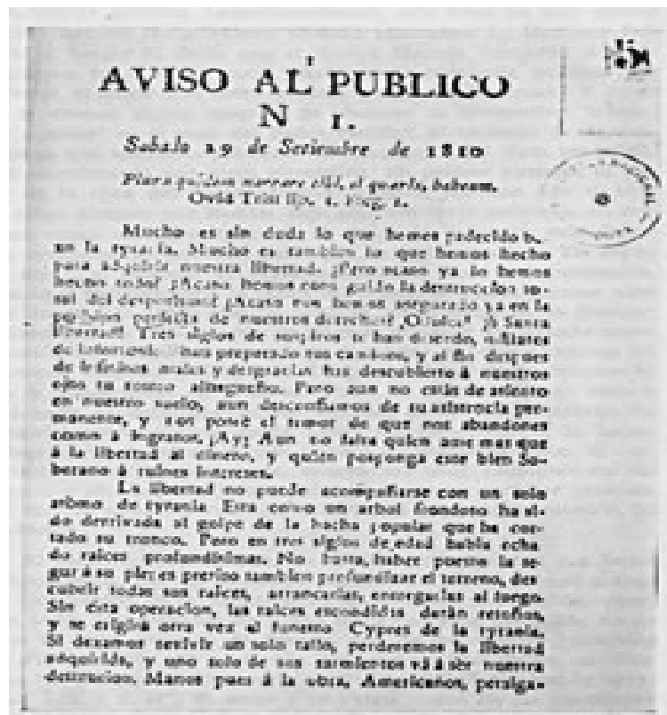
Figura 2. Recorte Aviso Público