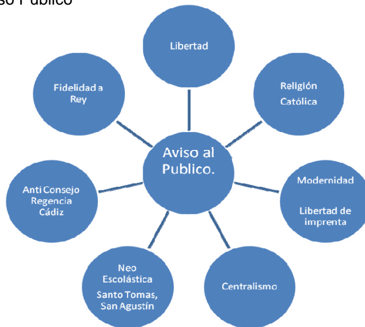
Figura 1. Aviso Público

A partir de lo anterior los temas del Aviso al Público se dividen y subdividen de la siguiente manera: