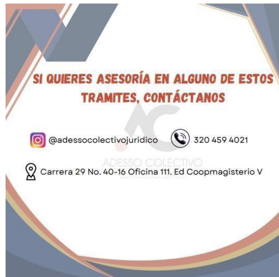
Ficha informativa: Registro de marca y registro mercantil. Oñate, F.M (2023)