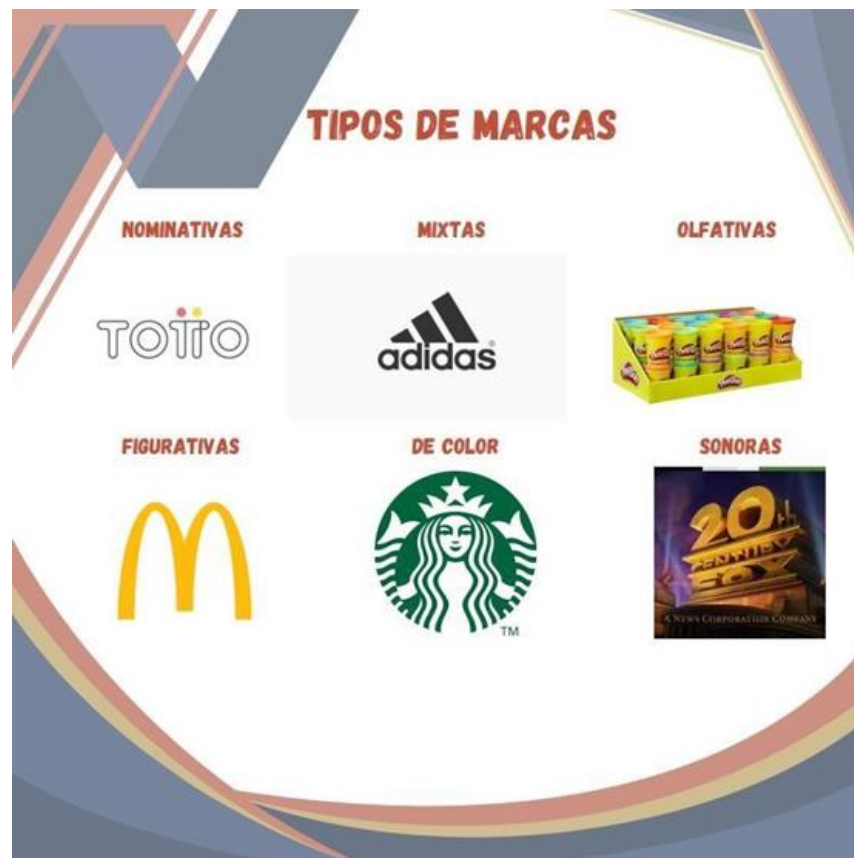
Ficha informativa: Tipos de marcas. Oñate, F.M (2023)