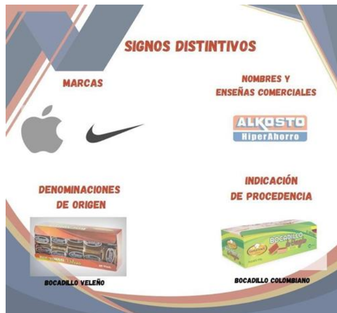
Ficha informativa: Signos distintivos. Oñate, F.M (2023)