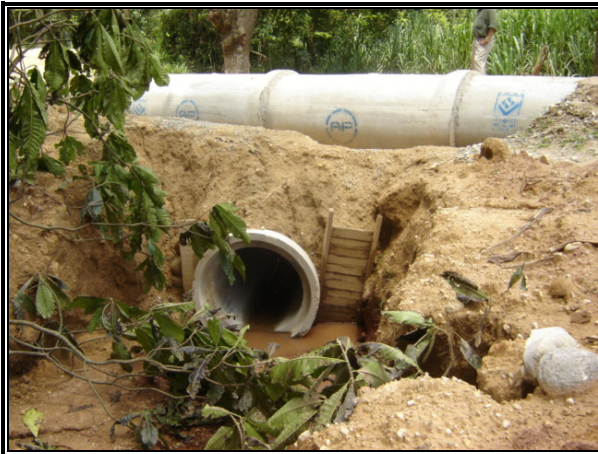
Figura No 9. Tubería instalada para el colector de Barro Blanco