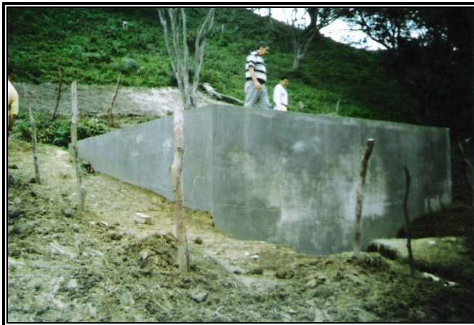
Figura No 3 de la inspección realizada al tanque de almacenamiento en la Vereda Quebrada Seca de Charalá

Se realizó una visita para verificar el estado de las obras..