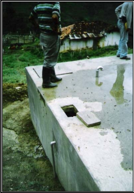
Figura No 5. Control de presión de agua en el punto de entrega al usuario