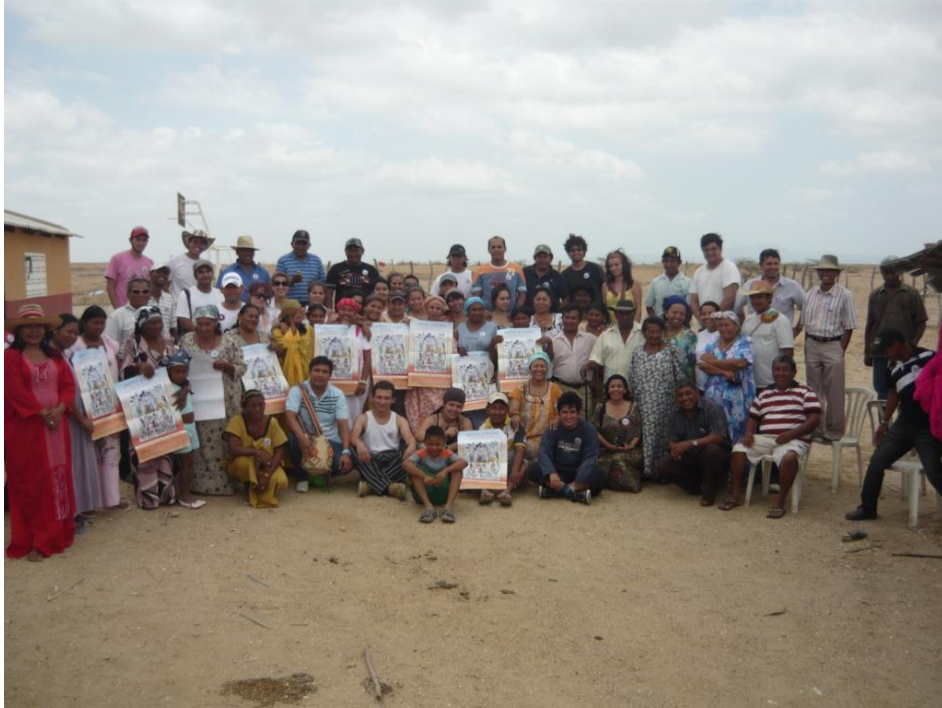
Fotografía 7. Acompañamientos a la comunidad de Bahía Portete.