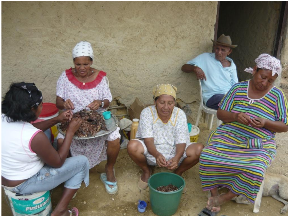
Fotografía 3. Mujeres y autoridades Wayuu de Portete.