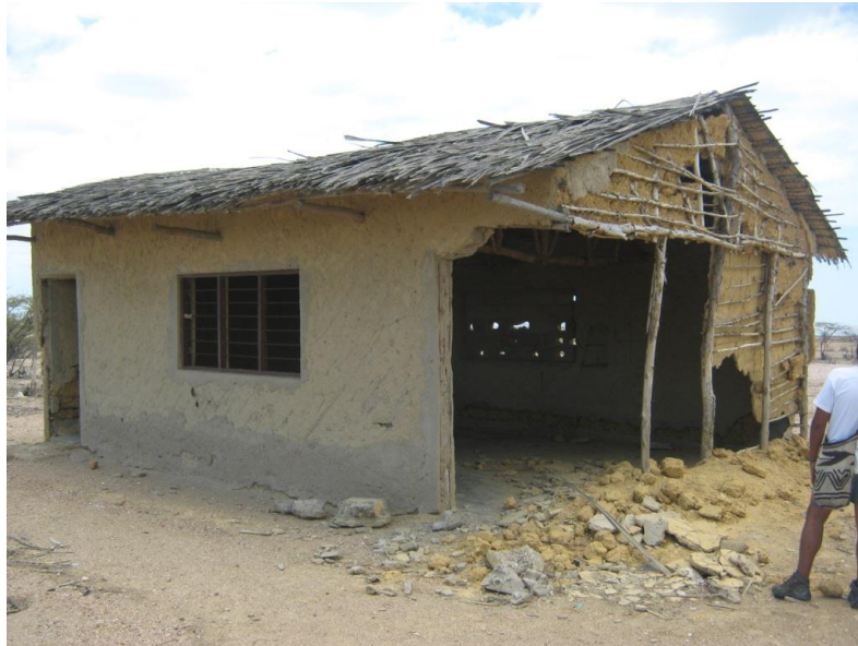
Fotografía 4. Restos de la escuela en Bahía Portete.