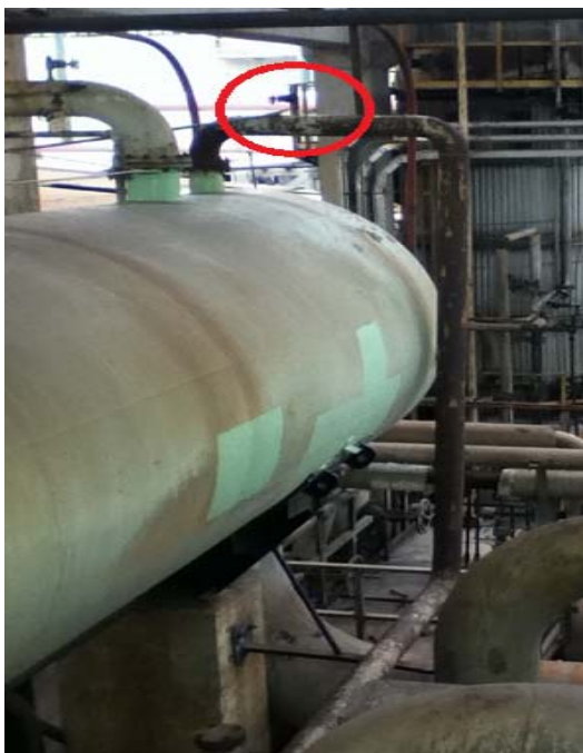
Figura 1. Facilidad en la parte superior del tambor D-503

Por tal motivo se decidió construir una línea nueva que llegue a una facilidad que se encuentra libre en la parte superior izquierda del D-503, en donde solo se transporte las aguas agrias Figura 1 .