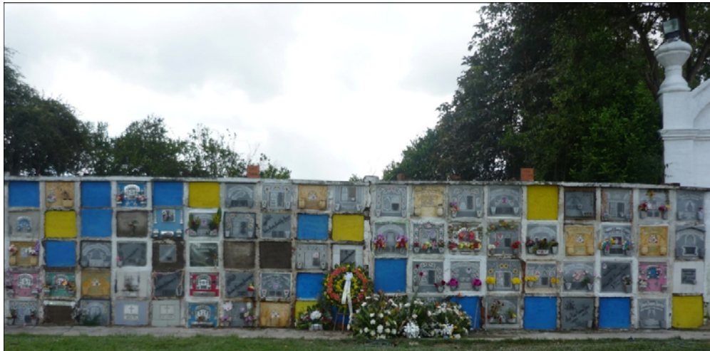
Figura 9. Cementerio de Lebrija, 2011