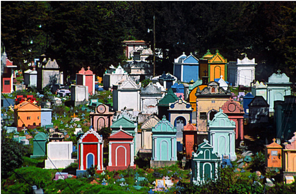
Figura7. Cementerio de Chichicastenango, 2009