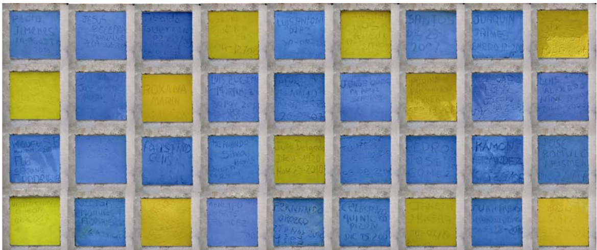
Figura16. Puesta de escena, 2011

El registro se tomó la decisión para ponerlo en escena de montarlo representando un pabellón a escala natural y el cual tumba a tumba se ve el proceso del trabajo en general (Ver figura16).