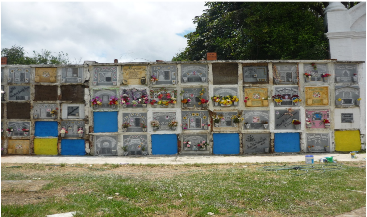
Figura 14. Proceso intervencion 20011