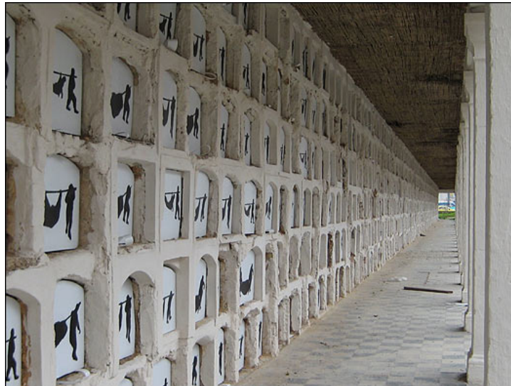
Figura 3. Auras Anónimas, Beatriz González

(figura3). Este trabajo es el resultado del sentimiento que le ha despertado Beatriz González la acción de cargar a los muertos para conducirlos a sus tumbas y con él pretende mostrar que tiene varios significados, recordar a todas las personas que están recorriendo el país desde hace varios años buscando a sus desaparecidos. En los columbarios estaban los más pobres, los abandonados y los N.N. Esta obra es un claro ejemplo de las múltiples posibilidades de cómo se puede hacer intervención de un cementerio.