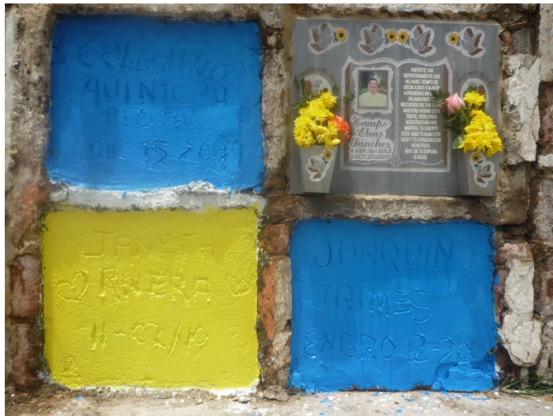
Pintura 11. Pintura amarilla, 2011