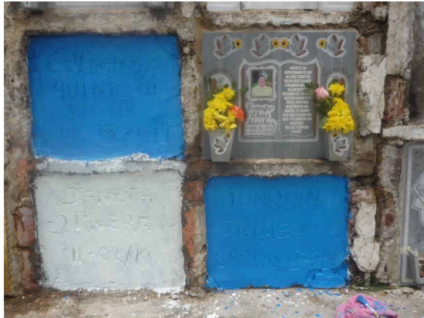
Figura10. Pintura azul, 2011