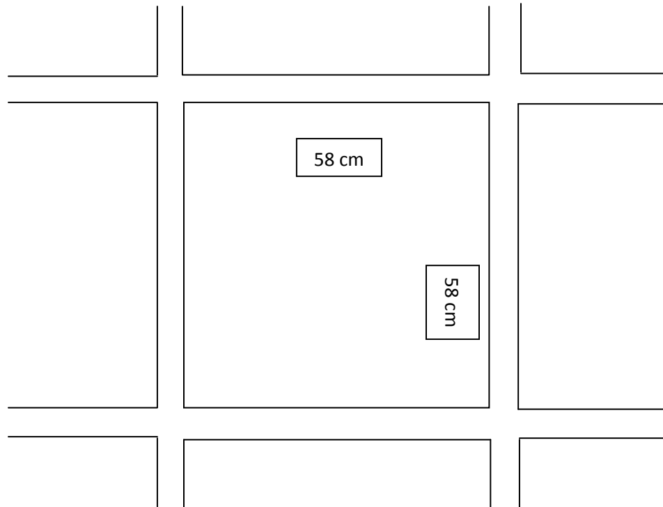
Diagrama. Mediadas aproximadas de una tumba