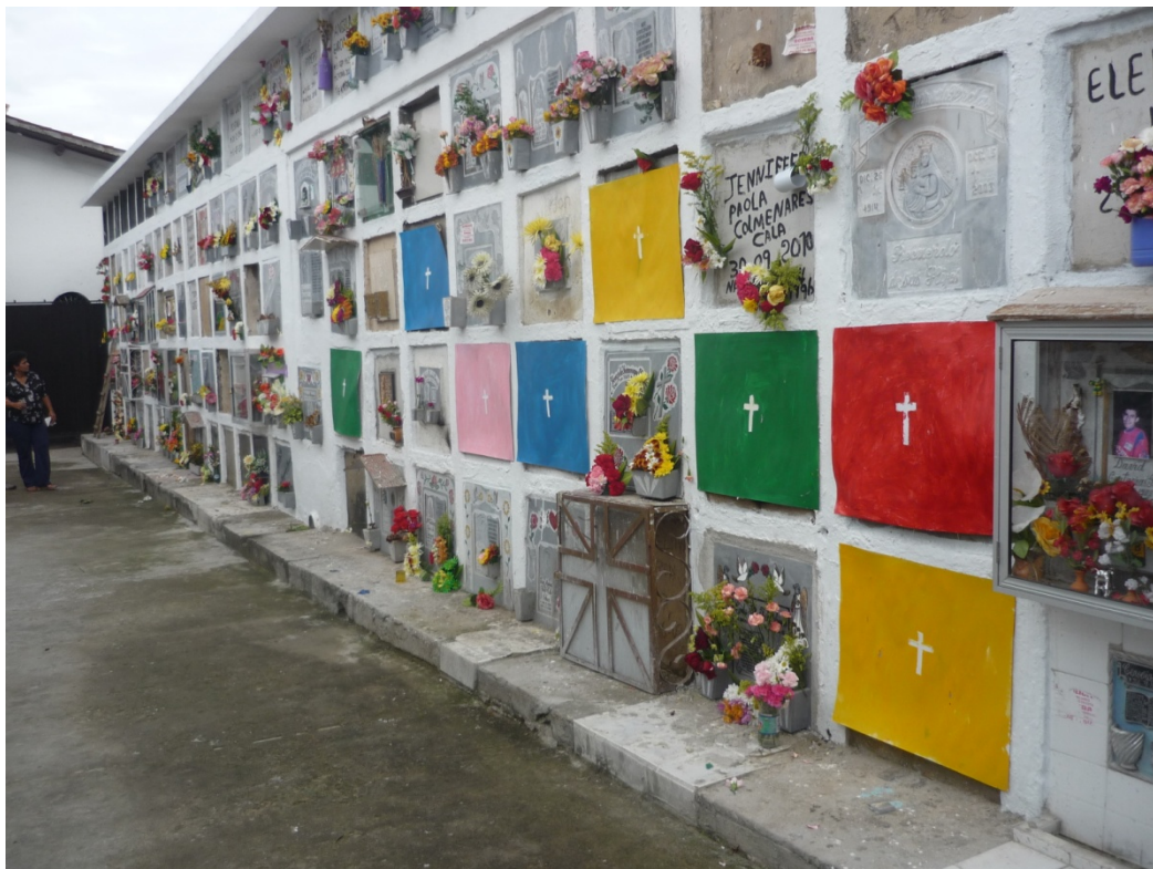
Figura 8. Ensayos cementerio Girón, 2010

única pretensión de tener idea sobre la relación entre doliente tumba y sus posibles colores, este ejercicio condujo a tomar la decisión de usar dos colores con los cuales se buscaba representar a la mujer y hombre ; esta gestión se realizó en el cementerio de Girón que fue el primero donde se hicieron los acercamientos iniciales, inclusive donde se realizaron los primeros experimentos de la posible intervención que se llevaron a cabo (ver figura 8),trabajo que fue presentado como anteproyecto.