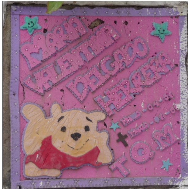
Figura 1. Lápida del cementerio de Girón, 2010

CEMENTERIO COLOR es un trabajo que surge de proponer en un lugar donde predomina el gris, y que por su sobriedad caracteriza el cementerio. Se empezó por el cementerio Monguí de Girón donde se observó formas de tapar el gris del cemento en la lápida, no únicamente con flores llamativas y coloridas, también que los familiares empieza a usar materiales como el foami (ver figuras 1 y 2), figuras con colores, o colores en fondo como el fucsia, verde, amarillo, azul, como una expresión cultural.