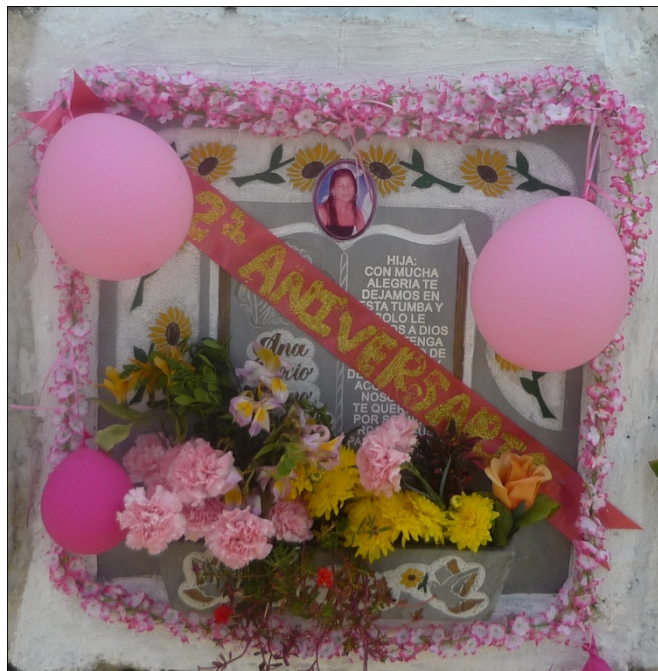
Figura 2. Lápida con flores, cementerio de Girón, 2010

Romper con el gris del cemento forma una percepción diferente y cambia de atmosfera. Como lo señala Kandinsky: “El color es un medio para desarrollar una influencia directa sobre el alma, y la armonía de los colores debe basarse únicamente en el principio del contacto adecuado con el alma humana” 1 . Razón que fortalece la decisión de buscar aplicar color sobre las tumbas.