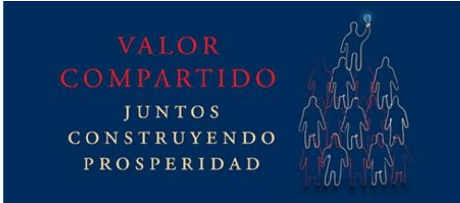
Figura 2. Concepto de Valor Compartido en Pacific Rubiales