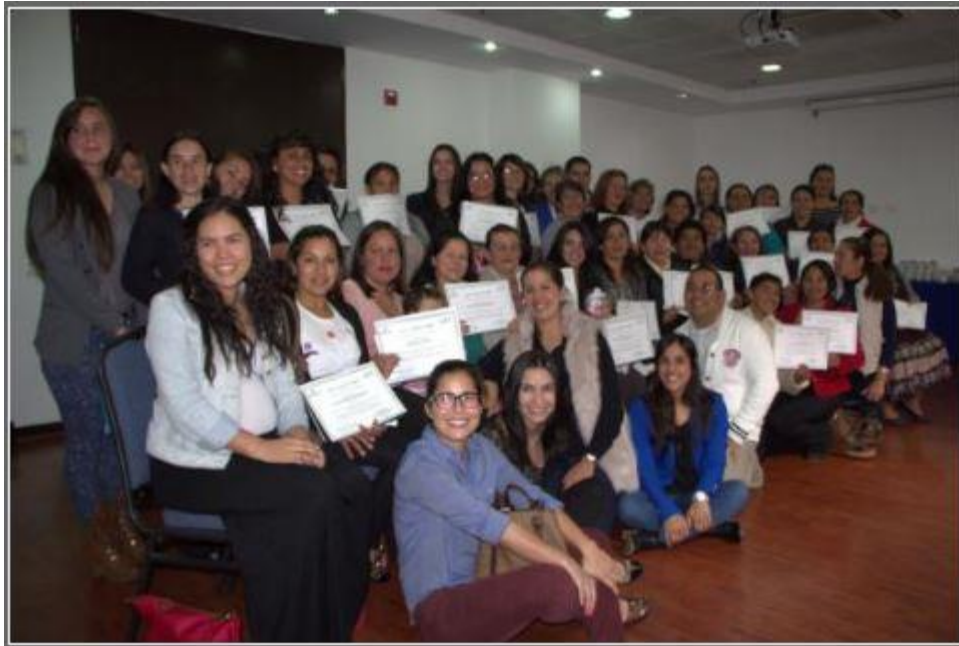
Figura 9. Voluntarios y Madres beneficiadas