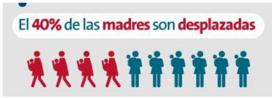
Figura 5. Perfil de las madres, víctimas del conflicto armado