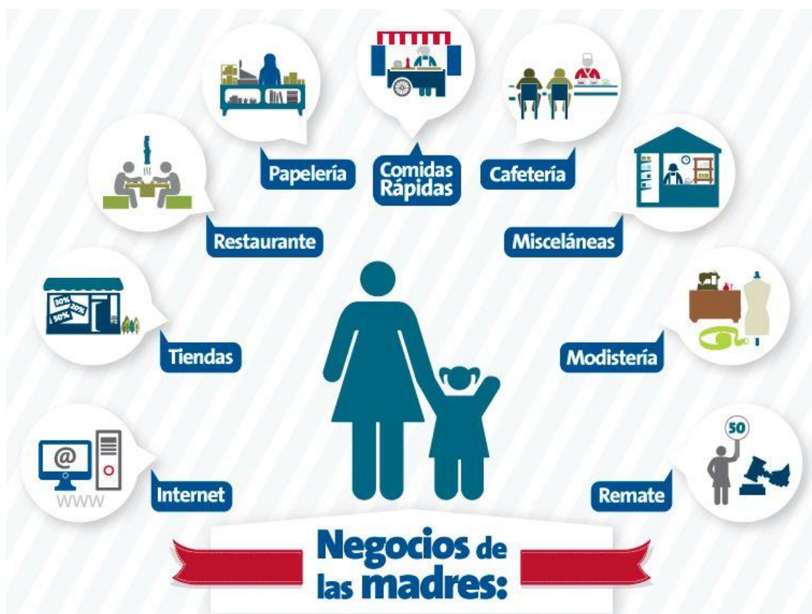
Figura 4. Descripción demográfica