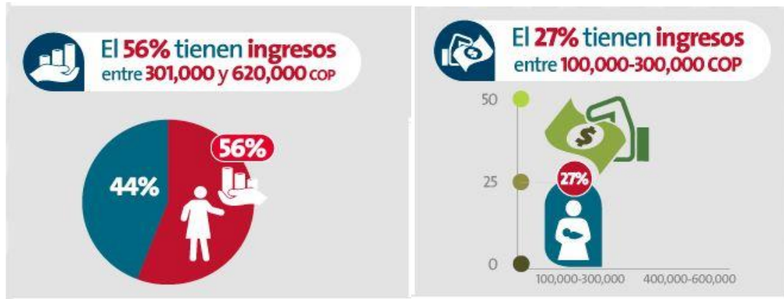
Figura 6. Perfil de las madres, información económica