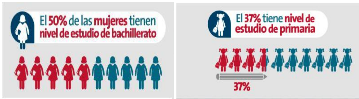
Figura 7. Perfil de las madres, nivel educativo