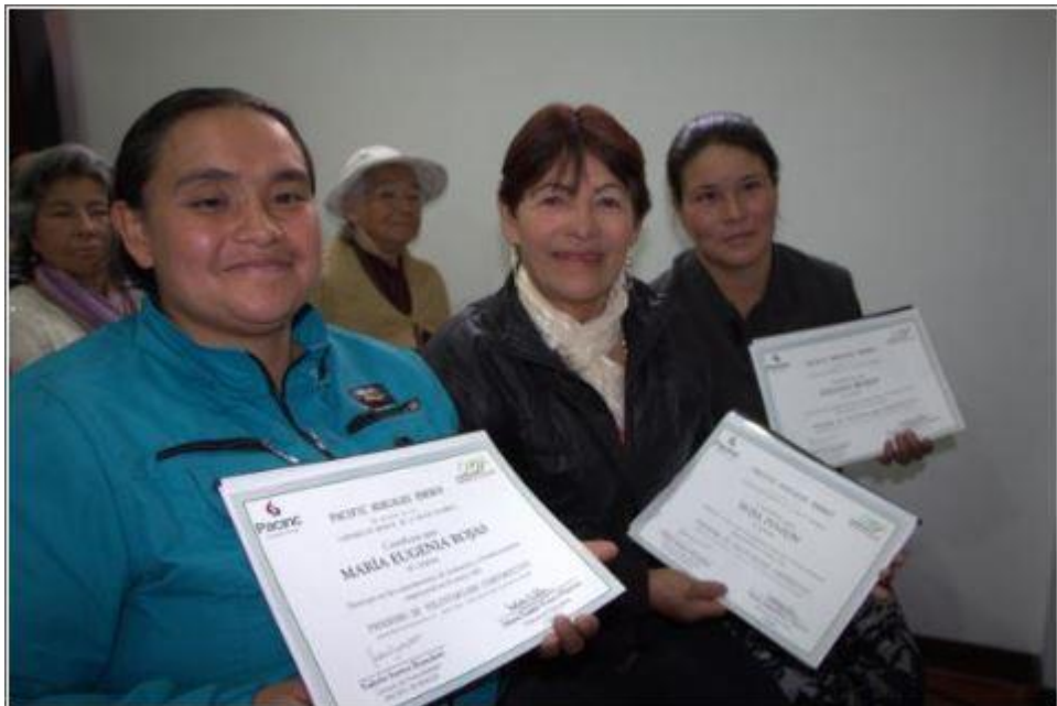
Figura 10. Beneficiarias del Proyecto