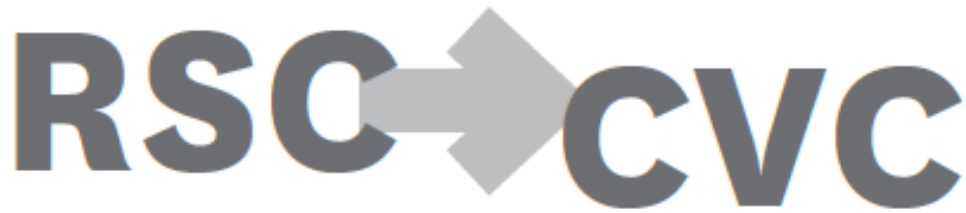
Figura 1. Comparación Responsabilidad Social Corporativa vs Creación de valor compartido