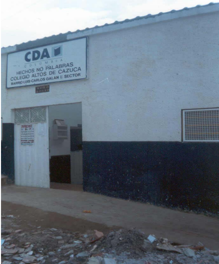
Foto4. Colegio CDA Altos de Cazuca