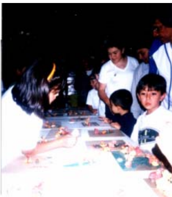
Foto N° 6. Actividad manual, Día Feliz N° 2 Exposición de trabajos.