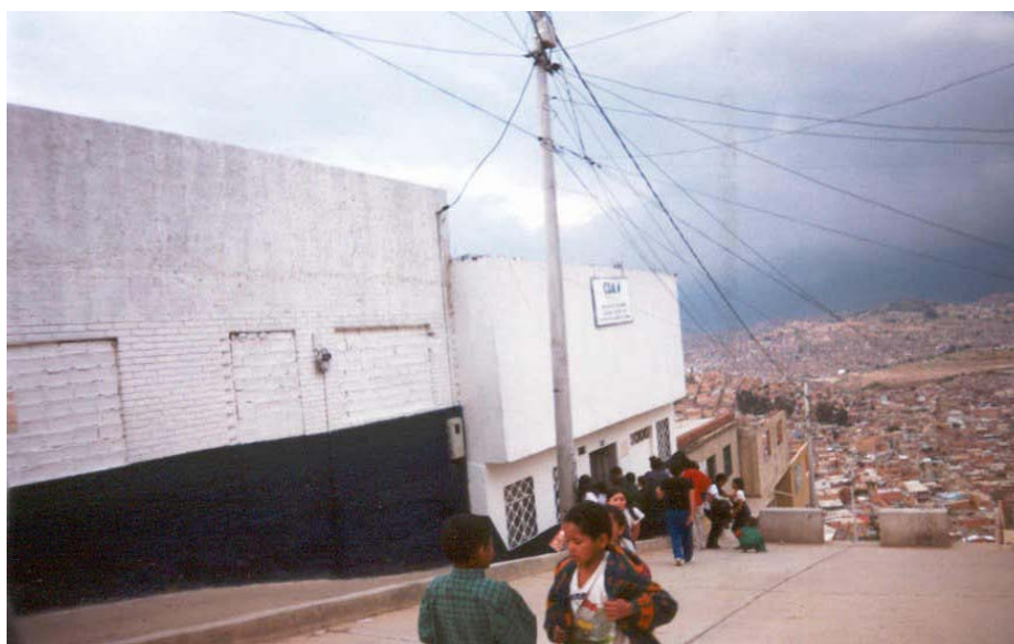
Foto 2. Colegio CDA Lucero Alto