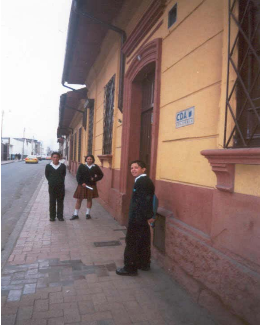
Foto3. Colegio CDA Santa Fe, Sede Guardería Santa Fe y PTI.