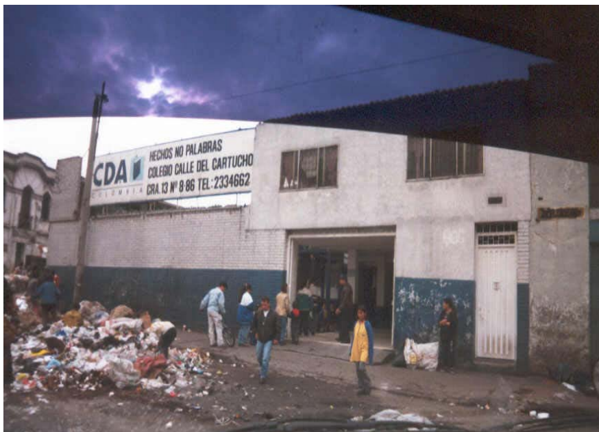
Foto 1. Colegio CDA Calle del Cartucho