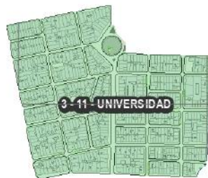
Figura 13. Barrio Universidad Comuna 3.