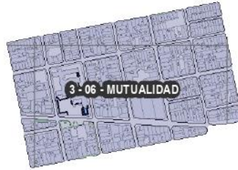
Figura 8. Barrio Mutualidad Comuna 3.