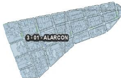
Figura 3. Barrio Alarcón Comuna 3.