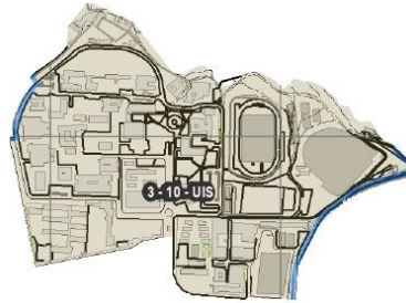
Figura 12. Universidad Industrial de Santander Comuna 3.