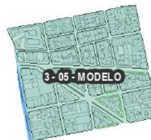
Figura 7. Barrio Modelo Comuna 3.