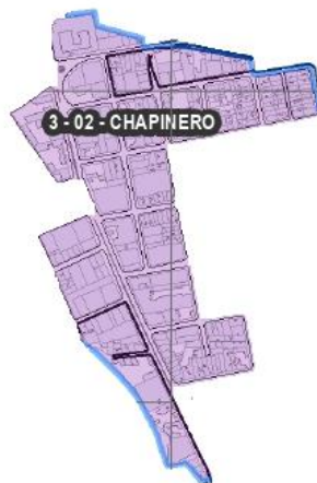
Figura 4. Barrio Chapinero Comuna 3.