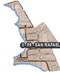
Figura 11. Barrio San Rafael Comuna 3.