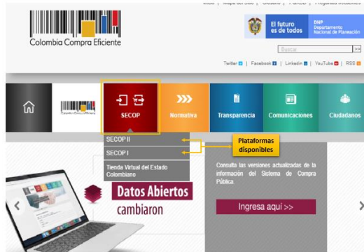
Figura 15. SECOP I Y SECOP II.