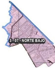
Figura 9. Barrio Norte Bajo Comuna 3.