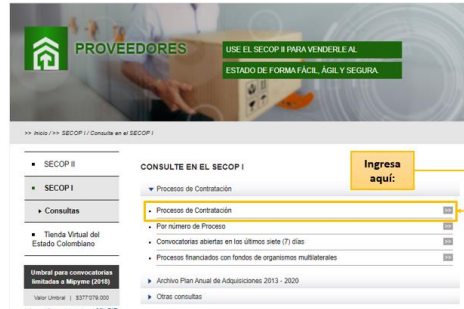
Figura 17. Proceso de contratación Secop I.