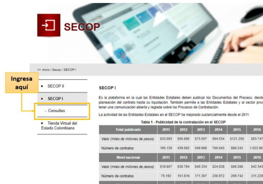
Figura 16. Portal de consulta del SECOP I.