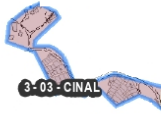
Figura 5. Barrio Cinal Comuna 3.