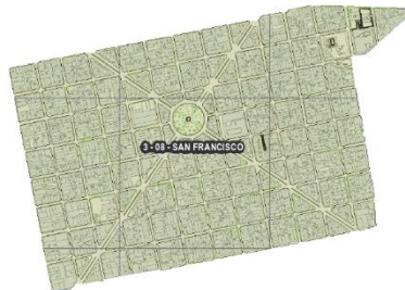
Figura 10. Barrio San Francisco Comuna 3.