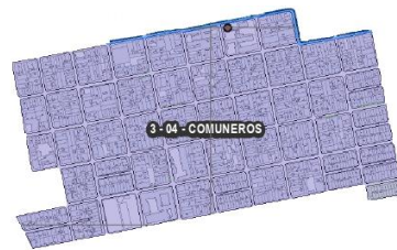
Figura 6. Barrio Comuneros Comuna 3.