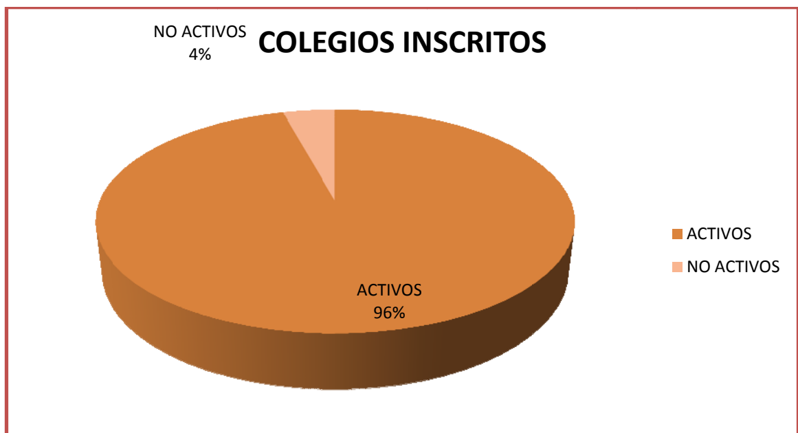
FIGURA 1. Colegio inscritos

Primero que todo, debimos establecer el número de colegios que se encontraban inscritos en la ciudad, para tal objetivo presentamos petición formal ante la secretaria de educación municipal de Bucaramanga, donde se nos remitió a la página web del ministerio de educación nacional, donde encontramos 282 instituciones educativas legalmente constituidas en el municipio, de las cuales 270 se encuentran activas.