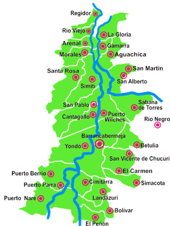
Mapa 1. Región del Magdalena Medio

Este estudio devela dos grandes dicotomías que llamaron la atención de los investigadores; una de ellas es la “pobreza vs. riqueza”, en la cual se podía apreciar, altos índices de pobreza en una región con grandes reservas naturales que deberían permitir un alto grado de “desarrollo”, teniendo en cuenta las explotaciones petrolíferas y mineras, que dejaban como resultado altas regalías para los empresarios y actores armados, dejando a la población como espectadores de una economía naciente basada en la ilegalidad, el latifundio y el conflicto, convirtiéndose en una de las tantas regiones del país, donde la presencia del Estado era nula, y el manejo político estaba a cargo de los actores armados, momento en el cual los y las habitantes quedaban en el medio, es decir, en medio del conflicto, de la riqueza, de las muertes y que a cada uno de ellos eran ajenos, pero que a su vez, terminaban implicados, por ser parte de la región.