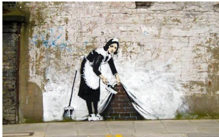
Sweep It Under The Carpet

Nota. Banksy. (2006). Sweep It Under The Carpet . Banksy Explained. Recuperado de: https://banksyexplained.com/sweep-it-under-the-carpet-2006/