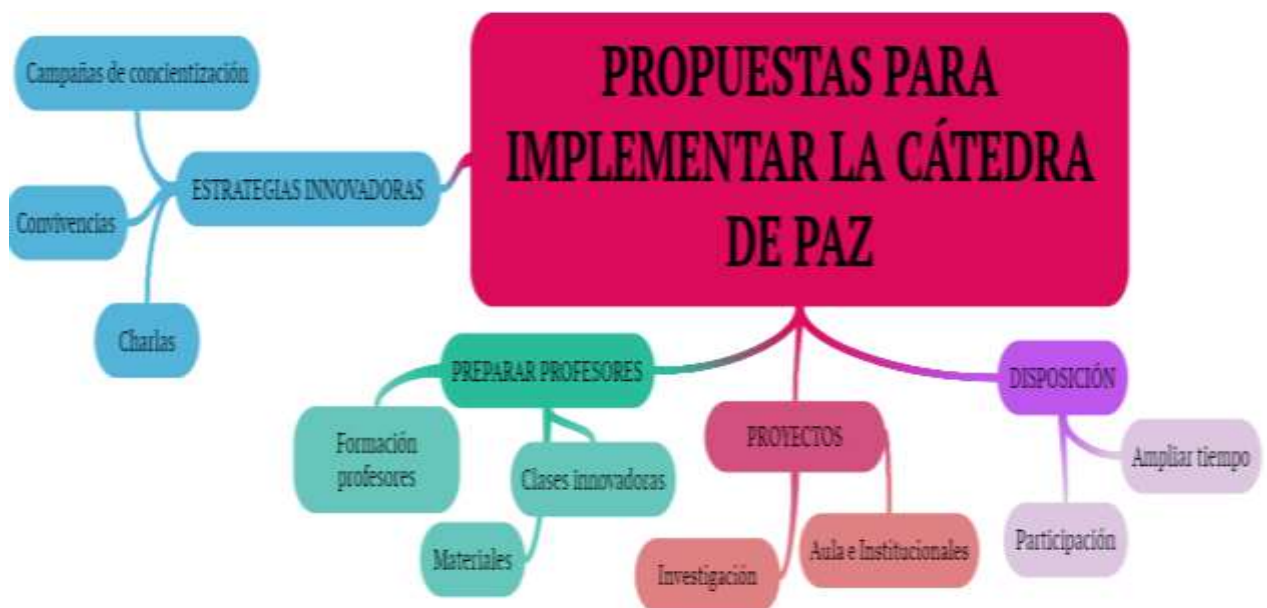
FIGURA 5. Propuestas que sugieren los maestros y estudiantes para desarrollar adecuadamente la Cátedra de Paz.