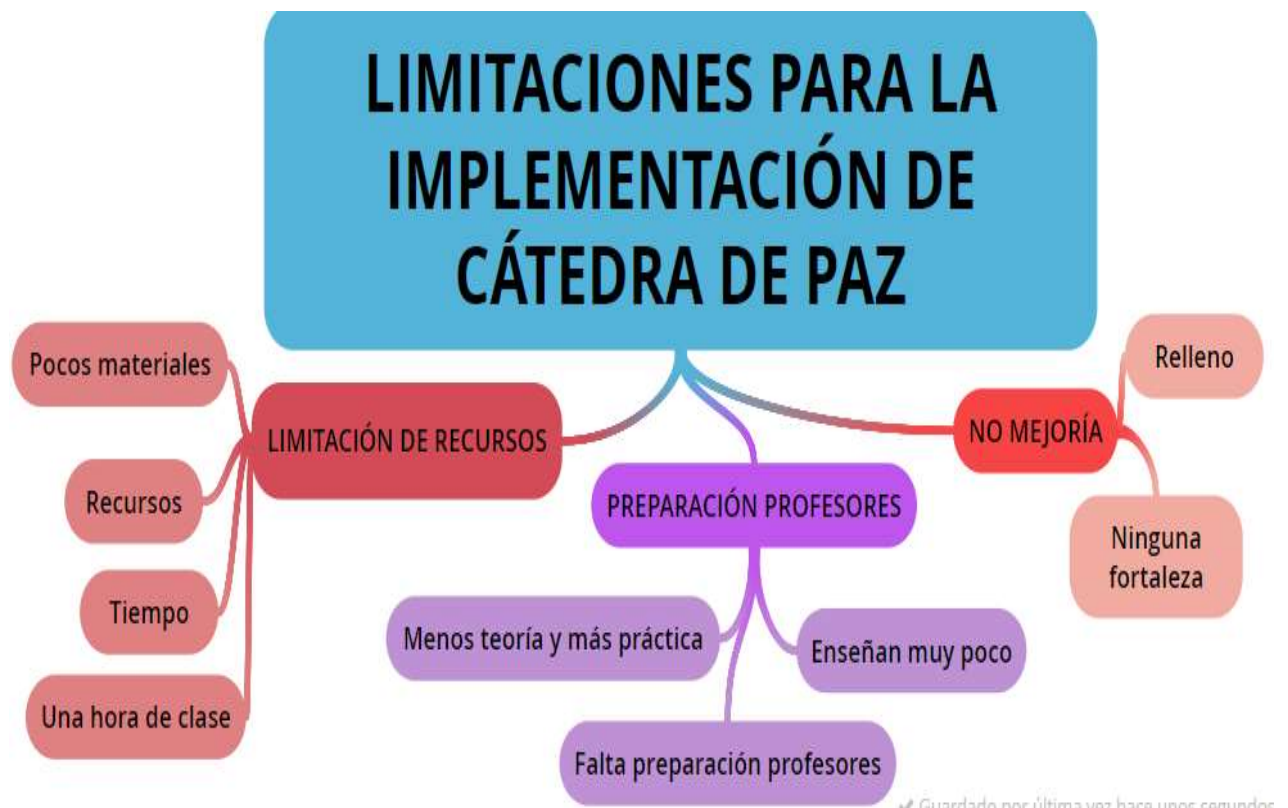
FIGURA 4. Limitaciones que encuentran los maestros y estudiantes para la implementación de la Cátedra de Paz.