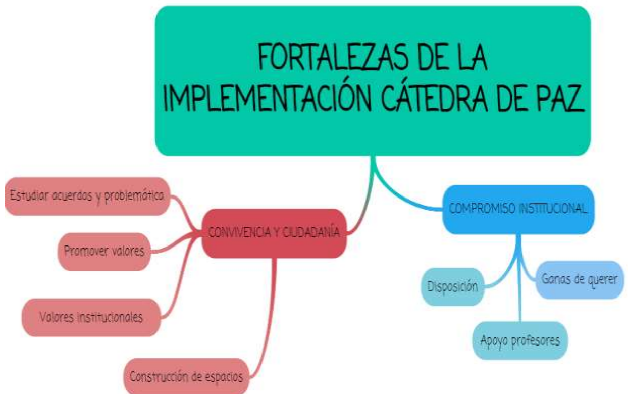
FIGURA 3. Fortalezas que encuentran los maestros y estudiantes para la implementación de la Cátedra de Paz.