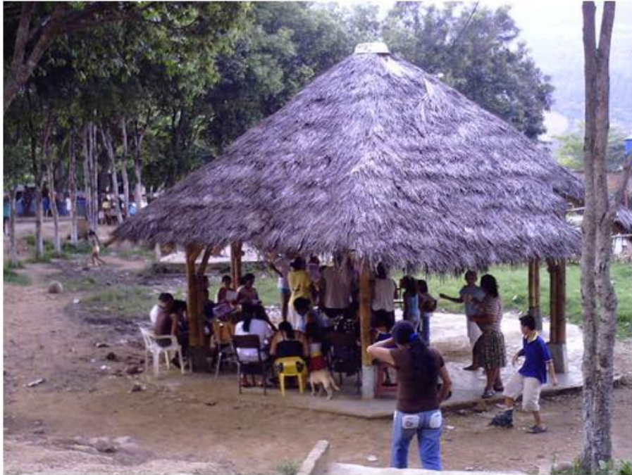
Figura A 1 Dinámicas de Grupo