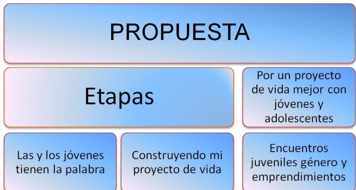
Figura 2 Propuesta: “Construyendo un Proyecto de Vida Mejor”