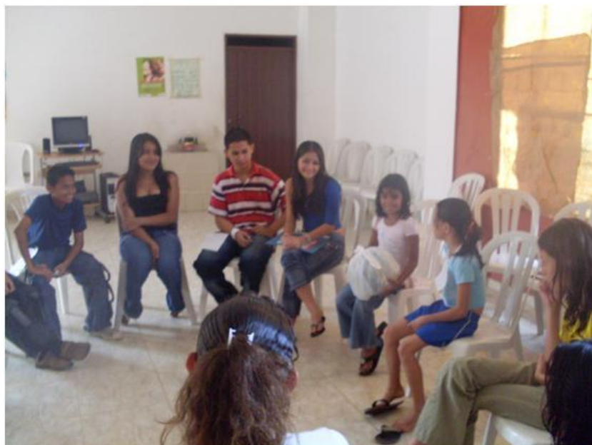
Figura A 2 Sesión educativa con las y los jóvenes participantes