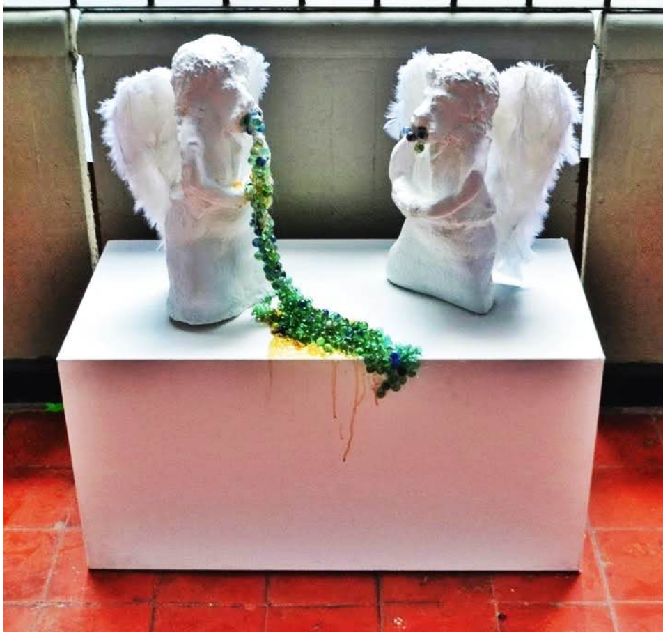
Figura 7. Mayerly Andrea Suárez Reyes, Engendros trasbocando. 2013.

En la aproximación más reciente y de la cual parte éste proyecto “ Cabeza sobre bandeja ” (Figura 8 y 9) se utilizan principalmente piezas de maniqués intervenidas con porcelana fría, plumas, materiales sintéticos, alfileres, canicas y silicona. Aquí el uso del color y las texturas creadas tienen un papel importante. Las piezas evidencian rasgos humanoides con hibridaciones fantásticas grotescas. Los ojos, los dientes, las uñas, el pelo y los fluidos hacen referencia a lo que se considera desagradable visualmente, sin embargo contrastan con la selección de colores y las texturas que componen las piezas, creando así un equilibrio.