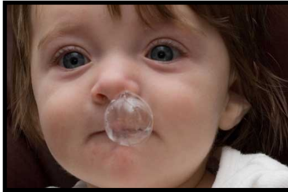
Figura 1. Cinco curiosidades sobre los mocos.