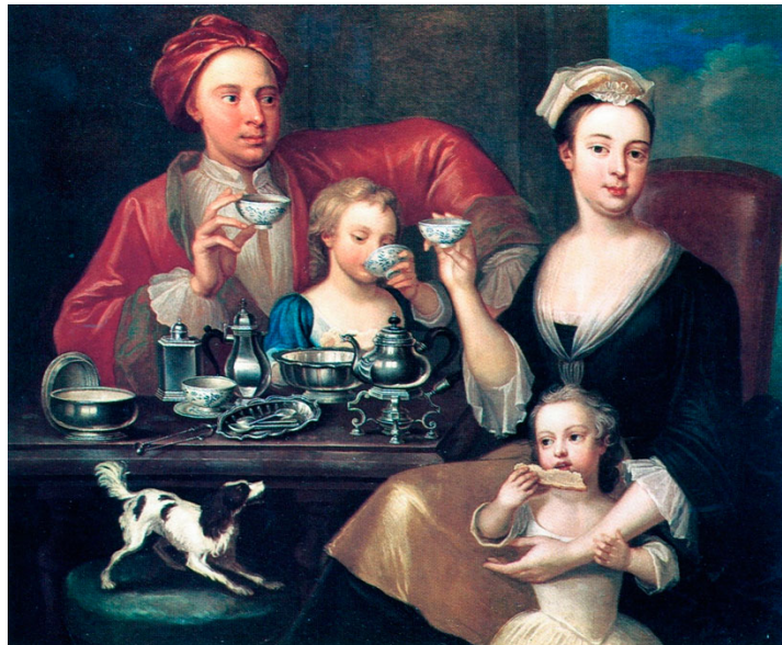
Figura 11. Jozef Van Aken, An English Tea Party. 1730.