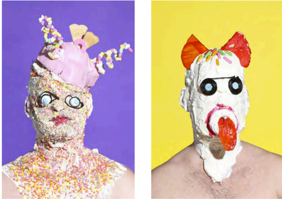
Figura 2. JAMES OSTER, serie fotográfica “Wotsit all about” 2014.