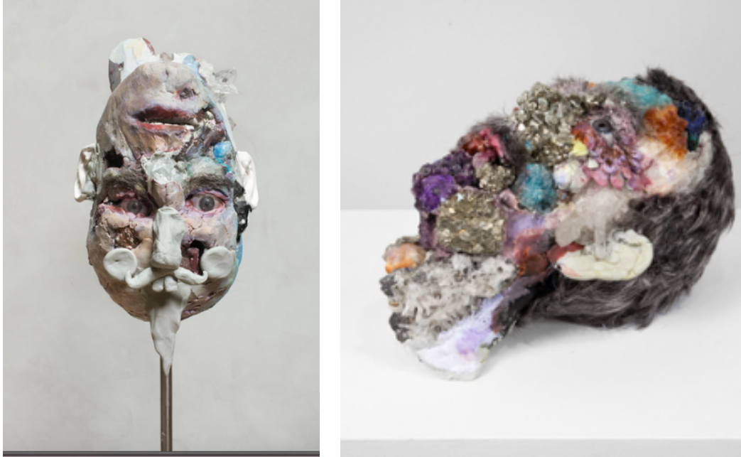
Figura 3. DAVID ALTMEJD. Sin título, 2011 (izquierda), Sin título, 2010 (derecha)