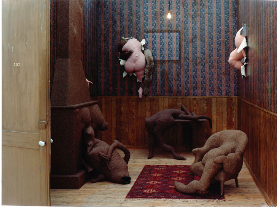
Figura 4. DOROTHEA TANNING, Hotel de Pavot. Instalación 1973.