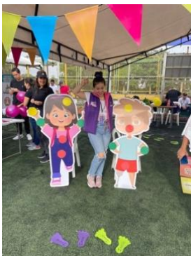
Figura 15: Nota: Día de la niñez.

“(…) Debido a la gestión que había realizado en los días anteriores, la secretaria de la mujer me comentó que liderara el espacio que teníamos en el día de la niñez por parte