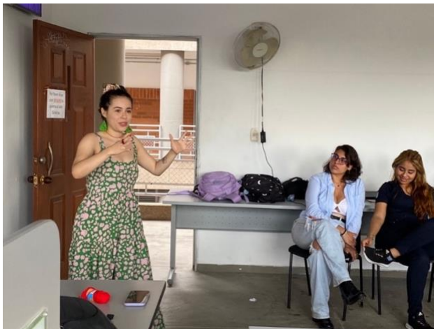
Figura 21: Nota: Capacitación con estudiantes de Trabajo Social.

“(…) Debido a las actividades que realicé dentro de la Secretaría. Mis profesoras me quisieron invitar a sus clases para hablar de violencia de género y el rol del Trabajo Social dentro de este campo. Fue un espacio muy gratificante porque hablar específicamente de este tema no es común dentro de la escuela y no existe una formación como tal para el quehacer de la profesión. Entonces en esta capacitación que dicté hablé sobre los conceptos básicos de los temas de género, la historia de la desigualdad de género y propuse herramientas que podemos realizar desde la profesión para prevenir la violencia de género” (T1P_Exp_Junio23_28).