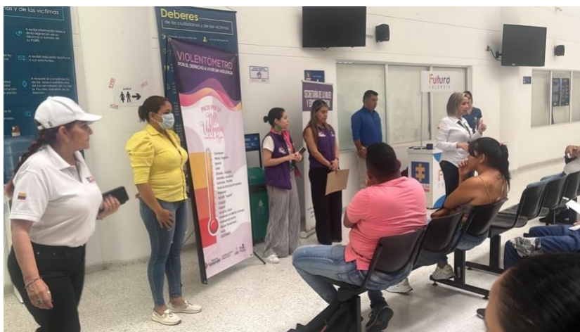
Figura 11: Nota: Prevención de Violencia de Género en la Fiscalía.

Con el paso del tiempo, comencé a involucrarme en las actividades relacionadas con la Universidad Industrial de Santander y el Observatorio de Mujeres y Equidad de Género, debido a mi formación académica y a la proximidad que mantenía con la universidad. Sin embargo, las personas de la Secretaría empezaron a rechazarme por mi asociación con la única colega que tenía en la institución y por conocer mis posturas políticas, las cuales rechazaban al gobierno de turno de la Gobernación.