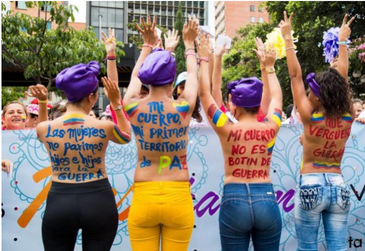
Figura 2:

La política pública de Mujer y Equidad de Género de Santander (PPMYEGS) surgió con la Ordenanza 028 de 2010 como respuesta a las movilizaciones sociales de la época. Durante el período 2007-2014, se enfrentaron diversos retos en su implementación, según un estudio detallado sobre su construcción y ejecución.