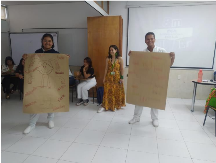
Figura 12: Nota: Taller de prevención de violencias en la Congregación Mariana.

Sin embargo, debido a este incidente, la relación entre la directora de la Mujer y yo se deterioró y quedó distanciada. Por lo tanto, opté por acercarme a la Casa de Mujeres Empoderadas y realizar actividades con mi colega.