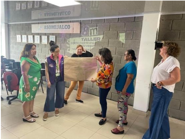
Figura 13: Nota: Taller con edilesas sobre mujeres en política.

Al observar que la Secretaría carecía de programas de capacitación en colegios y universidades, comenzamos a recibir múltiples solicitudes para realizar visitas a diversas instituciones educativas con el fin de ofrecer sesiones de prevención de violencia. En colaboración con mi compañera, nos comprometimos a abordar esta necesidad, llevando a cabo talleres, charlas y actividades diseñadas para concienciar sobre este importante tema y promover un entorno seguro y respetuoso para todxs lxs estudiantes.