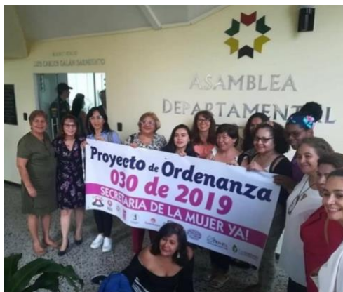
Figura 4: Nota: archivo movimiento social de Mujeres de Santander.

En 2019, se intensificaron los esfuerzos con la creación de una agenda por los derechos de las mujeres, la actualización de las brechas de género en Santander y la creación de la Secretaría de la Mujer y Equidad de Género con el proyecto de Ordenanza 030 del año 2019. El año siguiente, en 2020, se estableció una línea de atención para mujeres víctimas de violencia, especialmente relevante en el contexto de la pandemia por COVID-19.