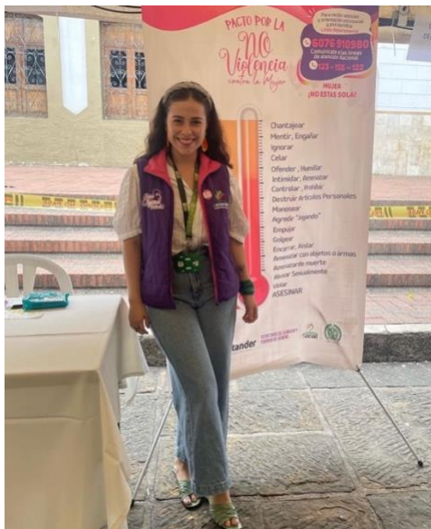
Figura 20: Nota: Prevención de Violencia de Género en Floridablanca.

“(…) Realicé prevención de violencias de género, socialización de la ruta de atención y socialización del violentometro para medir violencias en el parque principal de Floridablanca. Para mí fue muy significativo realizar esta jornada de sensibilización porque soy de Floridablanca, mi nona, mi mamá y mi tía fueron criadas también en este municipio. Las cosas que me mueven y por lo cual lucho, son para disminuir los índices de violencia de género, pues mi legado femenino sufrió múltiples violencias” (T1P_Exp_Junio23_26).