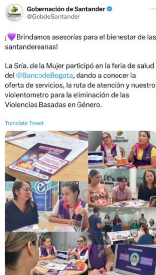
Figura 18: Nota: X Gobernación de Santander.

Durante mi tiempo en las oficinas de la Secretaría en mayo, noté que tanto lxs contratistas como lxs funcionarixs seguían sin implementar enfoques diferenciales en la atención a las mujeres, sin considerar las necesidades particulares de aquellas víctimas del conflicto armado que buscaban ayuda. Además, dentro de la oficina, experimenté incomodidad con la directora