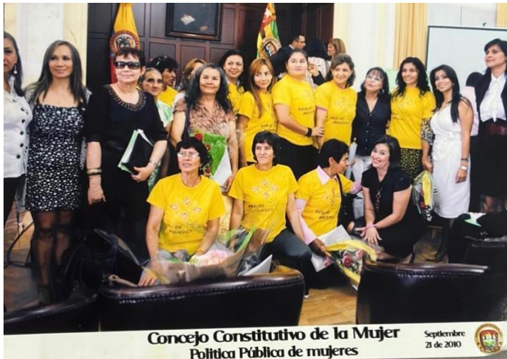
Figura 3

En 2019, se intensificaron los esfuerzos con la creación de una agenda por los derechos de las mujeres, la actualización de las brechas de género en Santander y la creación de la Secretaría de la Mujer y Equidad de Género con el proyecto de Ordenanza 030 del año 2019. El año siguiente, en 2020, se estableció una línea de atención para mujeres víctimas de violencia, especialmente relevante en el contexto de la pandemia por COVID-19.