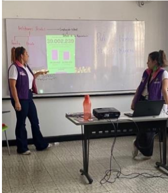
Figura 14: Nota: Prevención de Violencia de Género en la Universidad Uniminuto.

En el mes de abril, tuve la oportunidad de participar en la transversalidad con otras secretarías dentro de la Gobernación, siendo seleccionada para liderar el día de la niñez en el stand de la Secretaría de la Mujer. En consecuencia, inicié la preparación de herramientas pedagógicas centradas en la prevención de la violencia sexual y en el conocimiento de los derechos de las niñas, niños y adolescentes.