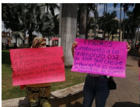
Figura 6:

En este contexto, reconstruyo 9 mi proceso de práctica social en la Secretaría de la Mujer y Equidad de género de Santander. A partir del programa Estado Joven del Ministerio de Trabajo,