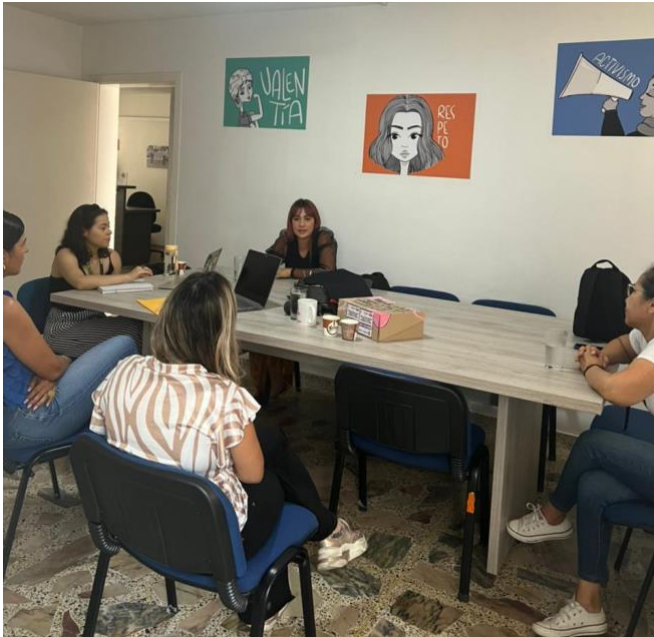
Figura 8: Nota: Primera reunión en Casa de Mujeres Empoderadas.

Al ingresar a la Secretaría, encontré un panorama en el que el rol del Trabajo Social no estaba claramente definido, lo que generó confusión entre lxs funcionarixs. A pesar de ello, yo tenía una visión clara de mis responsabilidades y los objetivos que debía alcanzar como trabajadora social en formación del programa Estado Joven. Durante los primeros días, dediqué tiempo a observar la dinámica de la oficina para comprender mejor el entorno en el que me desenvolvería.