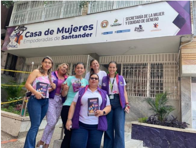
Figura 7: Nota: Casa de Mujeres Empoderadas.

“(…) La primera vez que fui a la casa de mujeres empoderadas quedé sorprendida del espacio que tienen las mujeres en Santander. Espacio para hablar de derechos sexuales y reproductivos, ejercer campañas de sensibilización y acción para proteger la vida de las mujeres. Este día me dispuse a dar todas mis ideas sobre prevención de violencias y las acciones que podría ejercer desde mi rol como trabajadora social. Me di cuenta que las personas que estaban en la reunión no sabían muy bien sobre el tema y qué el rol de la profesión no estaba visible” (T1P_Exp_Febrero23_07).