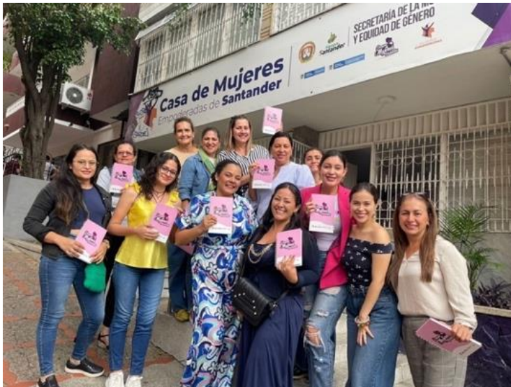
Figura 9: Nota: Taller de emprendimiento.

Al darme cuenta que mi rol no estaba estipulado, me sentía desconectada de mi propósito profesional y decidí tomar acción al respecto. Al buscar involucrarme más en las actividades, participé en un taller de emprendimiento dirigido a mujeres en el Día Internacional de la Mujer. Sin embargo, me sentí incómoda al notar que el discurso del coaching culpaba a las mujeres por las violencias que enfrentan en lugar de abordar la búsqueda de trabajo digno para ellas. Es por esta razón que destaco la importancia de cuestionar y confrontar discursos o prácticas que perpetúan desigualdades o victimizan a las personas en lugar de darle herramientas útiles y que comprendan la estructura de sus problemas.