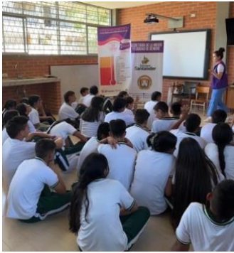
Figura 17: Nota: Prevención de Violencia de Género en colegios.

“(…) Cuándo ingresé en este colegio lo primero que me di cuenta es que estaban conmemorando el feminicidio de una de las estudiantes del colegio. Ya han pasado los meses y la cogida que he tenido en la Secretaría ha sido muy grande, me asignan eventos y puedo realizar las actividades como yo quiera. En este caso realicé prevención de violencias de género y lasmarcadas diferencias culturales sobre el ser mujer y el ser hombre. Me doy cuenta que es fundamental la necesidad mayor conciencia sobre la importancia de abordar la violencia de género en todos los niveles de la sociedad” (T1P_Exp_Mayo23_03).