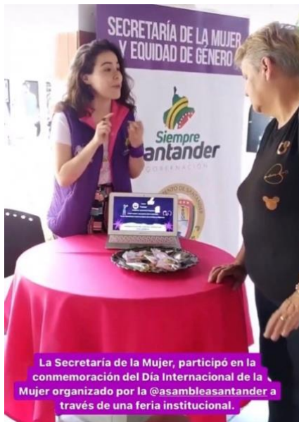
Figura 10: Nota: Instagram Gobernación de Santander.

En momentos en los que no había actividades programadas para llevar a cabo con lxs compañerxs de la Casa de Mujeres Empoderadas, me encontraba en la oficina de la Secretaría en la Gobernación. Allí, podía observar cómo se revictimizaba a las mujeres o personas que acudían en busca de ayuda a la Secretaría.