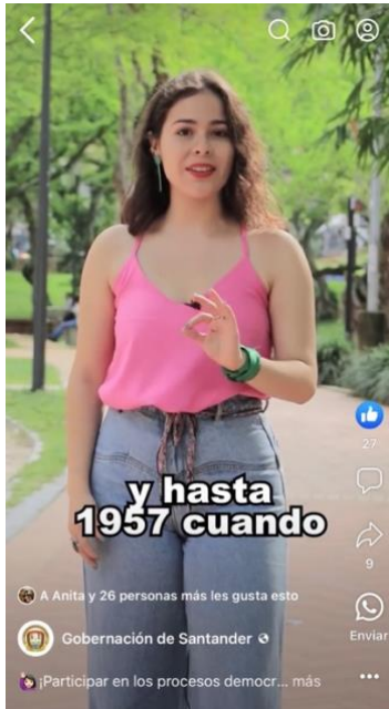
Figura 16:

“(...) Me sentí muy nerviosa porque el video fue publicado por las redes sociales oficiales de la gobernación, debido a los problemas que había tenido con la directora de la Mujer y mis posturas políticas. Sin embargo, fue oportunidad para hablar de la importancia que la participación política de las mujeres. Este video tuvo gran alcance y era algo que nunca se había hecho desde la Gobernación” (T1P_Exp_Abril23_21).