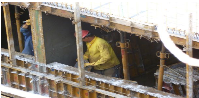
Figura 12. Desencofrado de formaleta.

6.1.11 Limpieza de formaleta. Antes de la fundida se aplica desmoldante a la formaleta tanto por dentro como por fuera de esta para evitar la adherencia del concreto. Posteriormente a la fundida se realiza una limpieza a la formaleta la cual