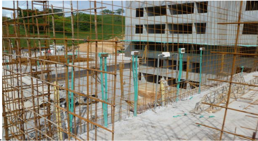
Figura 4. Instalación de malla y redes.

6.1.4 Armado de acero de refuerzo para vigas y elementos de borde. Antes de la colocación de la formaleta se debe revisar la colocación del refuerzo para los elementos de bordes y las vigas, se debe verificar el diámetro del refuerzo, el espaciamiento de los estribos, la cantidad de refuerzo colocado, revisar el traslape del refuerzo de vigas, revisar que los estribos estén amarrados con alambre negro al igual que la colocación de estos no deben ser armados en una misma dirección, todo esto se debe revisar según los planos del proyecto.