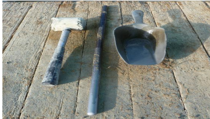
Figura 18. Cucharon, varilla y martillo de caucho.

6.2.1.3 Ensayo y muestreo de los cilindros. Según lo estipulado en el plan de calidad la toma de cilindros se debe realizar cada 40 m 3 o por jornada de fundida y se siguen los parámetros de las normas NTC 550 y el ensayo a compresión según la NTC 673. Se sacan muestras para ensayar a edad de 3, 7, 14 y 28 días y dos testigos que se dejan para ensayo de 56 días por si las muestras no cumplen la resistencia de diseño a los 28 días. Cada muestra consta de una pareja de cilindros.