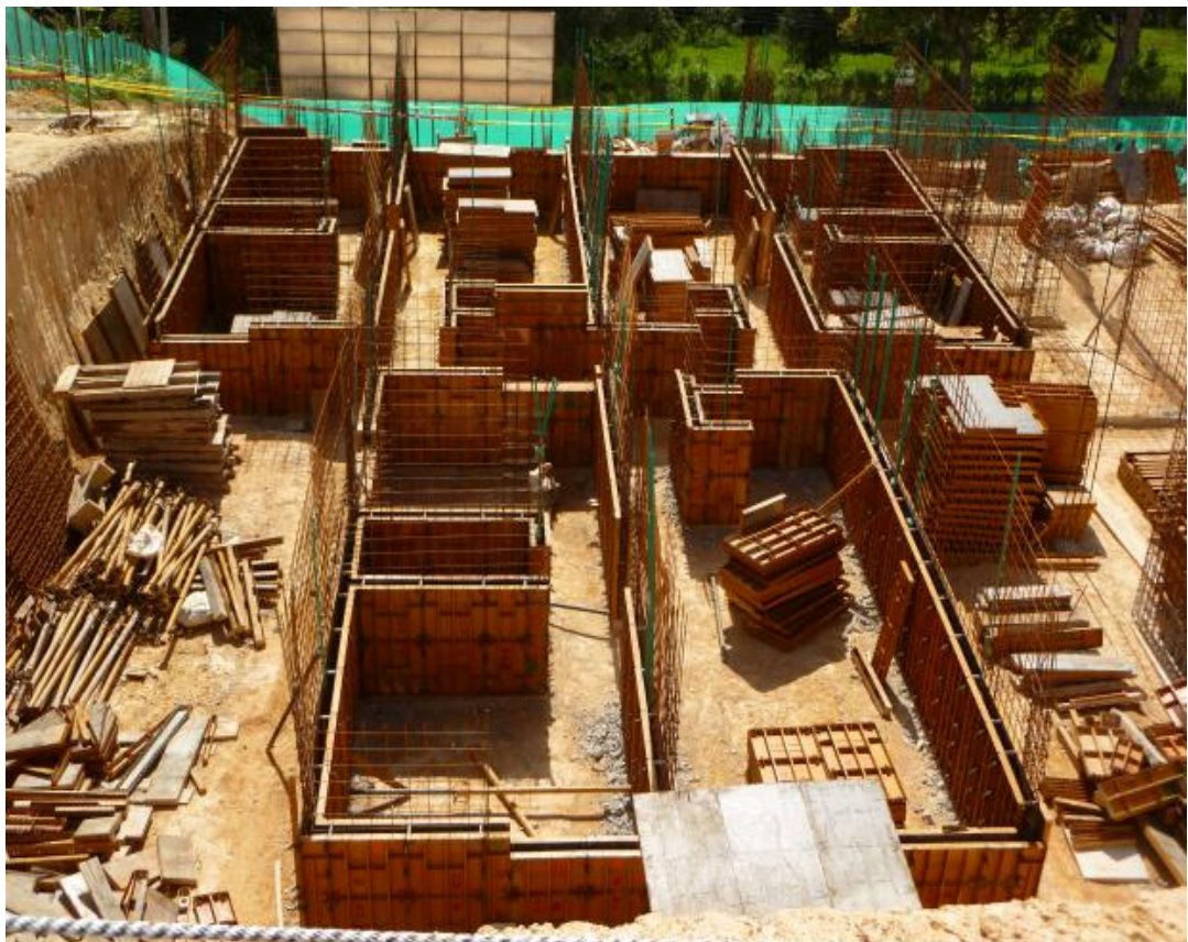
Figura 6. Armado de la formaleta.

6.1.6 Revisión de plomos y escuadras. Después de la armada de los apartamentos se procede a la revisión de plomos y escuadras en las esquinas de