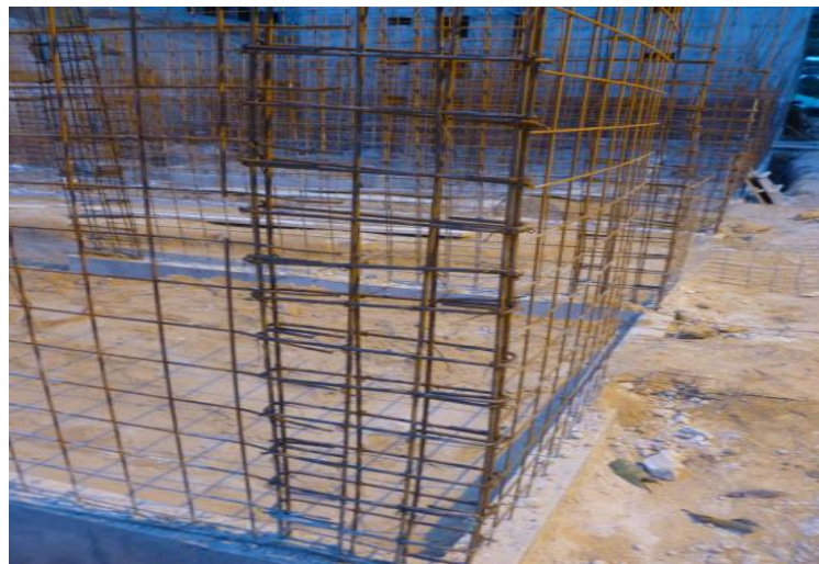
Figura 5. Elementos de borde.

6.1.4 Armado de acero de refuerzo para vigas y elementos de borde. Antes de la colocación de la formaleta se debe revisar la colocación del refuerzo para los elementos de bordes y las vigas, se debe verificar el diámetro del refuerzo, el espaciamiento de los estribos, la cantidad de refuerzo colocado, revisar el traslape del refuerzo de vigas, revisar que los estribos estén amarrados con alambre negro al igual que la colocación de estos no deben ser armados en una misma dirección, todo esto se debe revisar según los planos del proyecto.