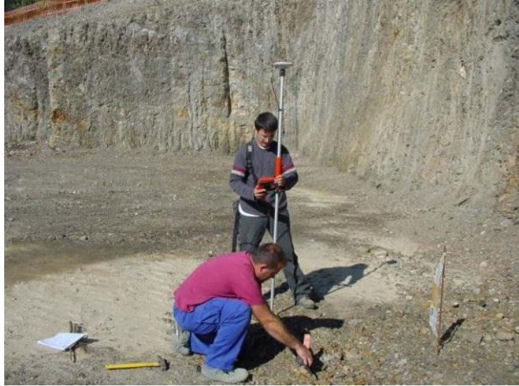
Figura 24.Cierre de poligonal.