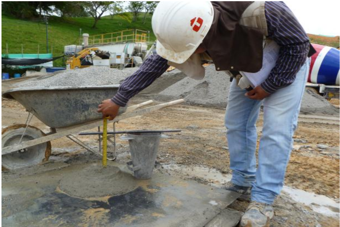
Figura 15. Medición de asentamiento para concreto outinord.

El ensayo consiste en llenar con tres capas el cono el cual debe corresponder cada capa a un tercio del volumen del cono, cada capa debe ser chuzada 25 veces esto con el fin de sacar los vacíos que puede tener el concreto, se debe evitar tocar el fondo del cono en la primera capa y la capa inferior en las siguientes, después se procede a levantar el cono la norma nos dice que este tiempo debe variar entre 3 y 7 segundos, e inmediatamente se procede a medir el asentamiento del concreto, se mide de la parte superior del concreto y la varilla que se coloca en el cono como se puede apreciar en la siguiente imagen, cabe recordar que la superficie donde se realiza la prueba debe estar debidamente nivelada ya que puede afectar considerablemente el resultado del ensayo.