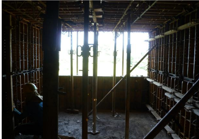
Figura 10. Revisión final de la formaleta.

6.1.9 Vaciado del concreto. Antes del vaciado del concreto la comisión de topografía debe colocar puntos de nivelación, se realiza una marca en algún refuerzo que sea visible para garantizar la nivelación de la placa después de la fundida.