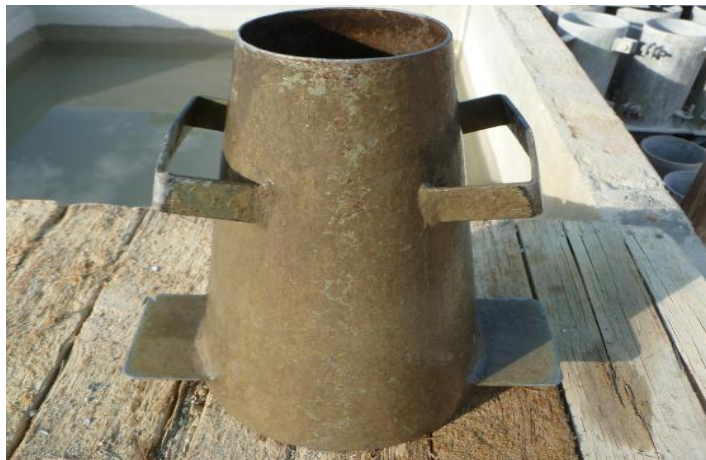
Figura 17. Cono de Abrams.

Varilla compactadora: Debe ser de acero, cilíndrica, lisa, de 16 mm de diámetro y con una longitud aproximada de 600 mm; el extremo compactador debe ser hemisférico de 16 mm de diámetro.