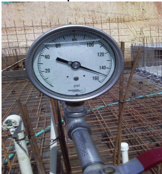
Figura 25.Prueba de presión antes de la fundida.

Antes de la fundida de los apartamentos se realiza una prueba de presión a 90 psi durante 2 horas, esto para detectar posibles fugas y no tener que hacer reparaciones después de fundida la placa, posterior a esto se realiza otra prueba a presión de 150 psi. A los aparatos utilizados (manómetros) se les realiza una verificación de su estado con un equipo patrón que maneja la empresa para conocer el porcentaje de error que pueda tener el manómetro.