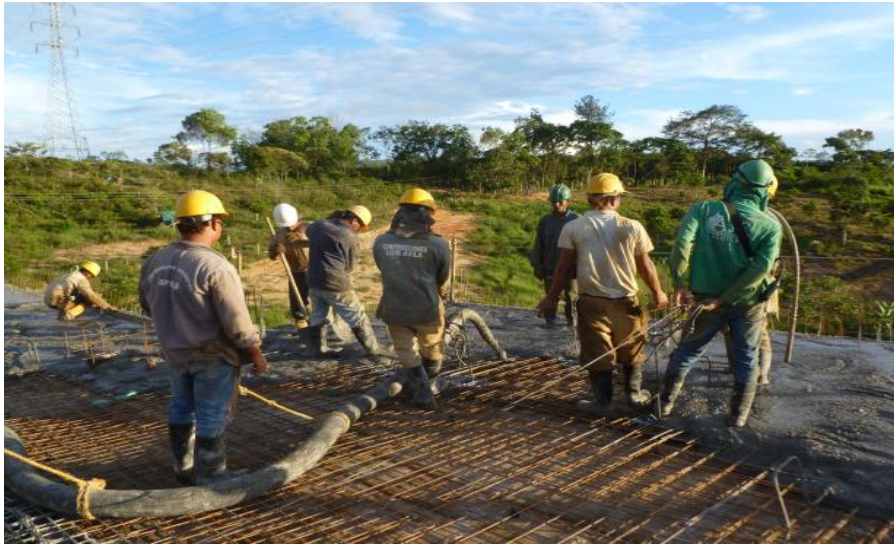
Figura 11. Vaciado del concreto.

6.1.10 Desencofrado de los apartamentos. Se debe exigir un tiempo de 12 horas aproximadamente para el retiro de la formaleta así garantizar un tiempo adecuado en el fraguado del concreto, los armadores de los apartamentos son los encargados de la desencofrada de la formaleta la cual deben realizar lo mas cuidadosamente posible para evitar abolladuras en la formaleta lo cual se puede ver reflejada en futuras fundidas.