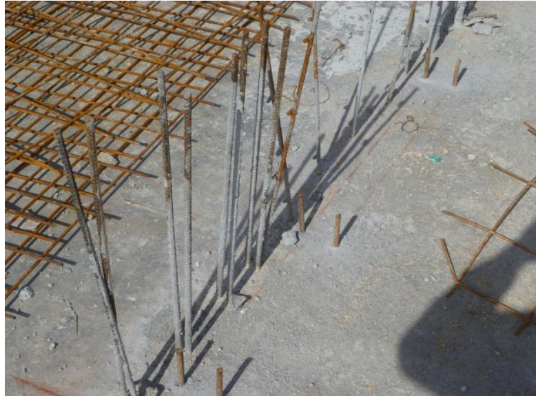
Figura 3. Cimbrado de muros y pinado de formaleta.

6.1.3 Instalación de malla y redes en los muros. Después de la verificación de ejes por parte de los ejeros se procede a la colocación de la malla de refuerzo de los muros, y seguido la instalación de las redes eléctricas y de gas. Se debe verificar que las cajas eléctricas estén colocadas de acuerdo a los planos y que se encuentren bien sujetas a la malla con alambre negro para evitar que se muevan de su lugar, al igual que deben estar completamente llenas para que en el momento del vaciado del concreto no se llenen.