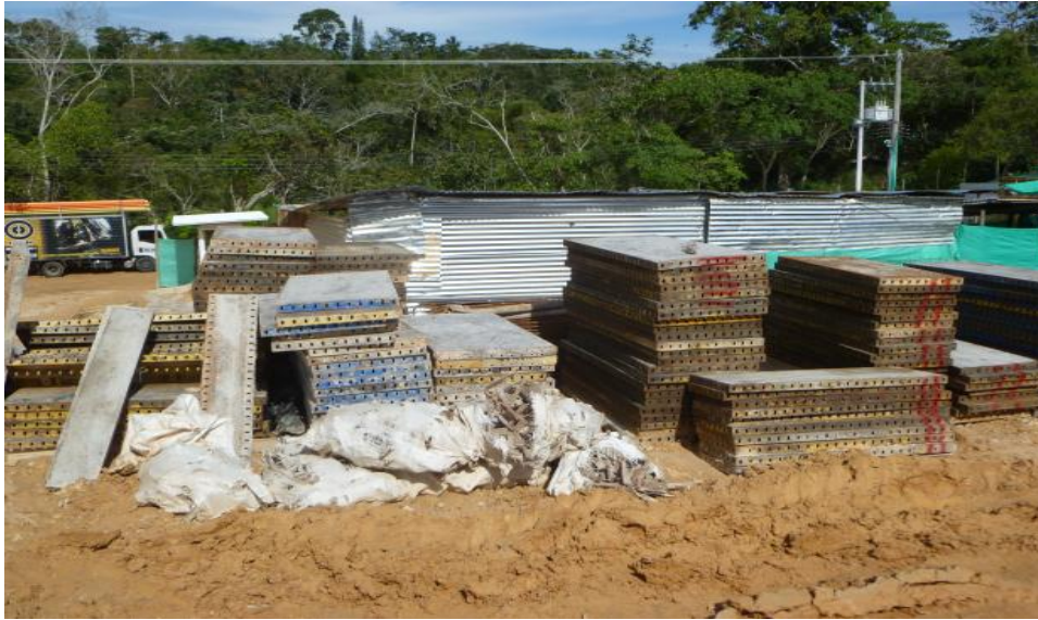
Figura 13. Formaleta limpia.

6.1.12 Curado de muros y placa. El curado de los elementos se realiza después del desencofrado de los apartamentos, en nuestro caso debido al clima cálido que se presenta en el municipio se procede a la aplicación de antisol un producto SIKA después que la placa ha alcanzado un estado en el que se encuentra todavía fresca, el cual permite la retención de agua y evita el resecamiento de la misma.