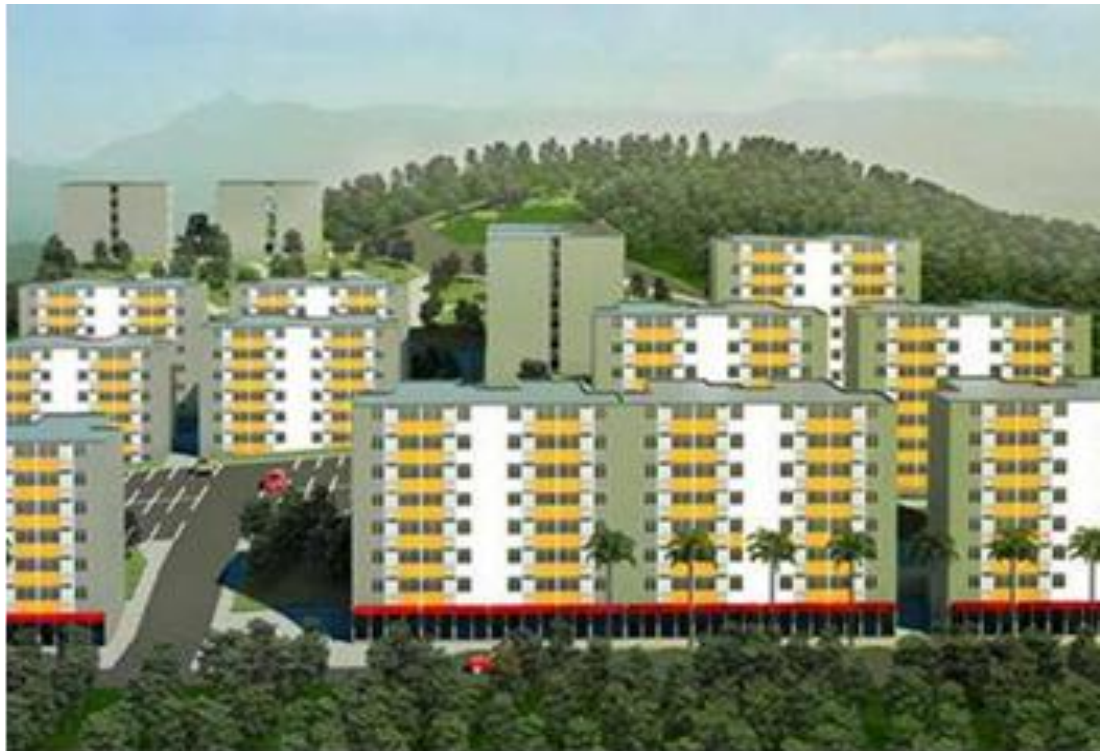
Figura 1. Vista preliminar Ciudadela

Además La ciudadela contara con las siguientes obras internas en la parte urbanística que son: puentes y rampas peatonales metálicas, andenes y senderos peatonales en concreto, parqueaderos, zonas verdes y cancha múltiple de tierra.