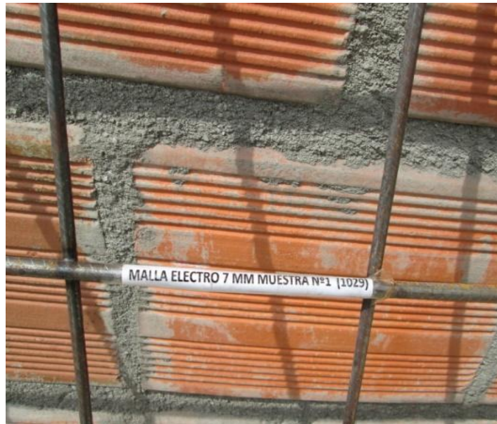
Figura 21. Muestra de malla de acero.

Todos los envíos de muestras se dejan registrados en formatos del laboratorio para la trazabilidad del acero. De igual forma tanto para las varillas como para las mallas se exige al proveedor que todo pedido que llegue a obra tiene que tener su respectivo certificado de calidad de lo contrario el material no se recibe, esta función está a cargo del almacenista y se debe controlar por parte del Auxiliar de calidad.