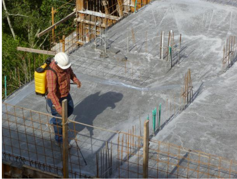
Figura 14. Aplicación de Antisol a la placa.