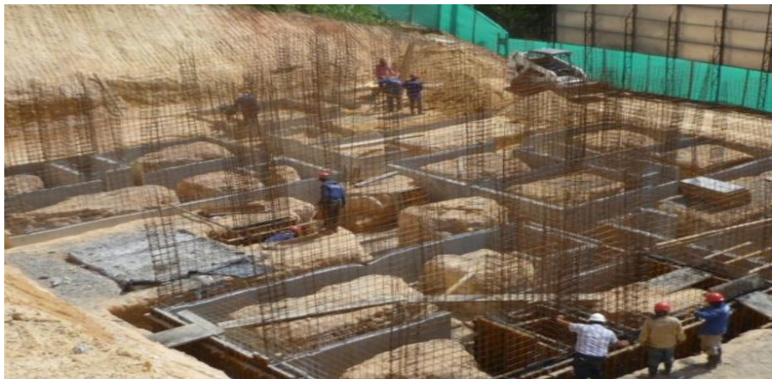
Figura 2. Cimentación Torre 1.

6.1.2 Cimbrado de los muros y colocación de pines. Después de la realización de la cimentación se procede a la armada de los primeros apartamentos, pero antes se deben cimbrar los muros, una vez la comisión topográfica ha marcado sus puntos de referencia el ejero del respectivo contratista pasa a marcar los ejes de los muros estructurales y divisorios para la posterior colocación de los pines.