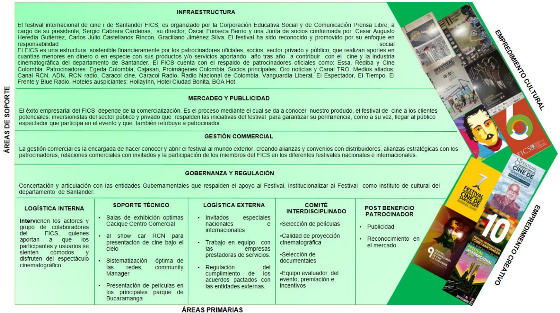
Figura 4. Cadena de valor Festival Internacional de Cine de Santander