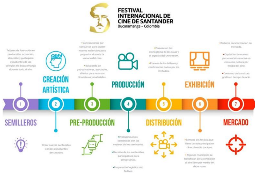
Figura 2. Cadena de Valor procesos del festival