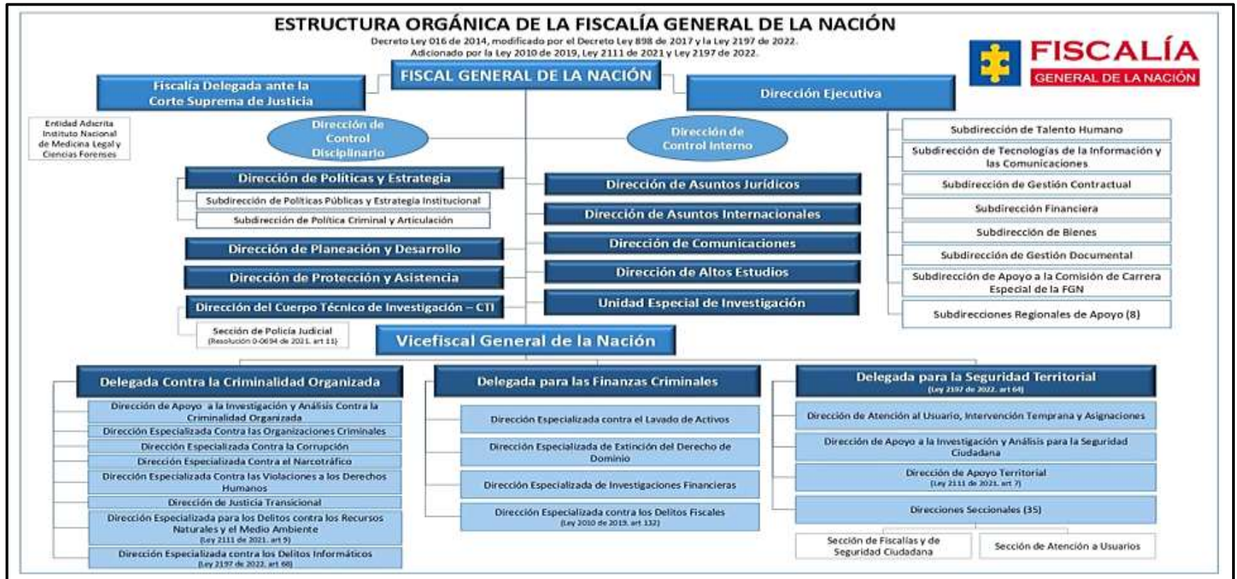
Figura 1: Organigrama