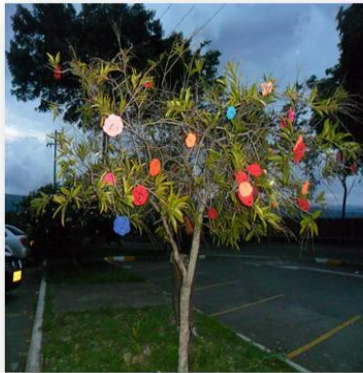
Figura 12. Intervención 2014

En esta intervención quise dejar ver la ausencia de lo natural, donde realice flores tejidas en crochet y las ubique en donde naturalmente deberían ir, pero como todo sin darme cuenta inconsciente estaba llevando mis trabajos como metáforas para lograr expresar mis sentimientos.