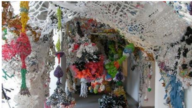
Figura 7. Laberinto del Consumo.

Fuente: http://www.revistaenie.clarin.com . Juan Manuel Echavarría