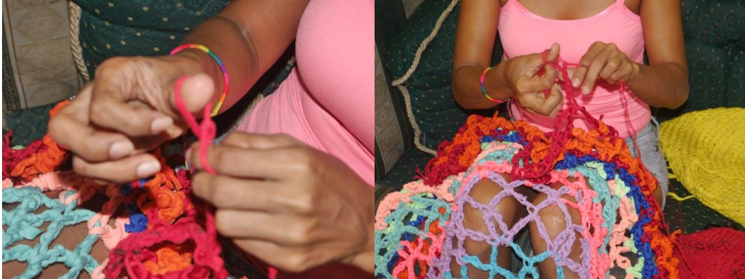
Figura 14. Proceso de tejido y construcción

Se empieza a tejer en el punto convencional de la técnica crochet, separándola al inicio con 7 puntos de distancia