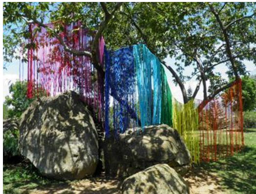
Figura 13. Instalación Land Art 2014

Con esta instalación artística para transmitir la idea de respeto y belleza para sentir de nuevo la alegría perdida, acariciar textura o derramar color en nuestra retina, pensado que cualquier lugar puede ser galería de arte y ya no es