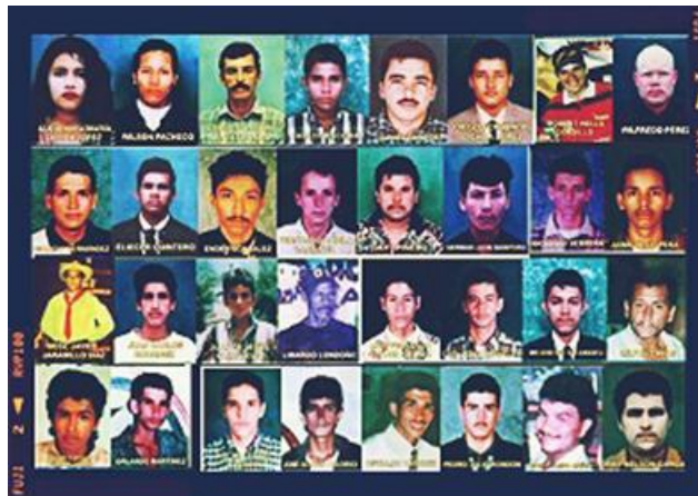
Figura 2. Desaparecidos y asesinados.