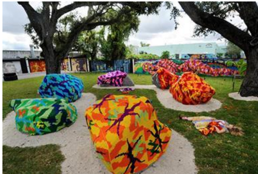
Figura 6. La vida y el arte son inseparables

Fuente: http://revistapicnic.com/olek-vida-y-arte-unidos-por-crochet/ Colectivo Artístico Femenino Suprema