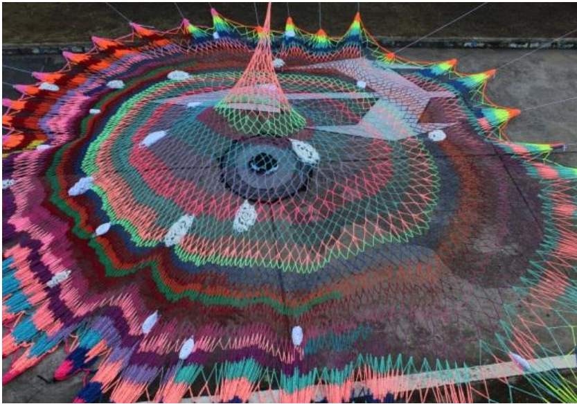
Figura 17. Exhibición de la obra en Barrancabermeja 1 de noviembre 2015.