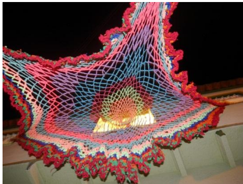
Figura 15. Simulación de extensión de la atarraya

Con esta prueba me daba cuenta de que tan grande iba quedando y que tan imponente se veía.