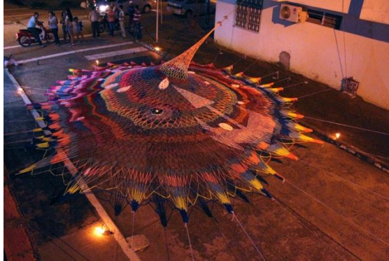
Figura 5. Exposición en la calle 44ª con carrera 54 esquina del barrio el Campin.

La obra es un paso de valentía que he tomado de allí el nombre de VALENTIA, un suspiro profundo para recoger fuerzas y recordar exactamente cada uno de los minutos, días, semanas y años en los que el tiempo y nosotros las víctimas no olvidamos tanto dolor, tejida con mis dedos como significado de que las manos construyen y no dañan.