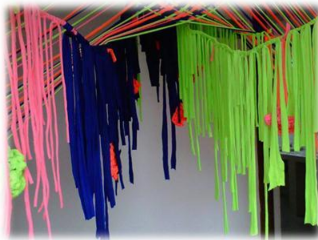
Figura 11. Entre tejido. Instalación 2013

En el primer acercamiento y exploración, era como hacer una obra donde obstaculizar la vía, como metáfora a lo que en mi vida había sucedido.