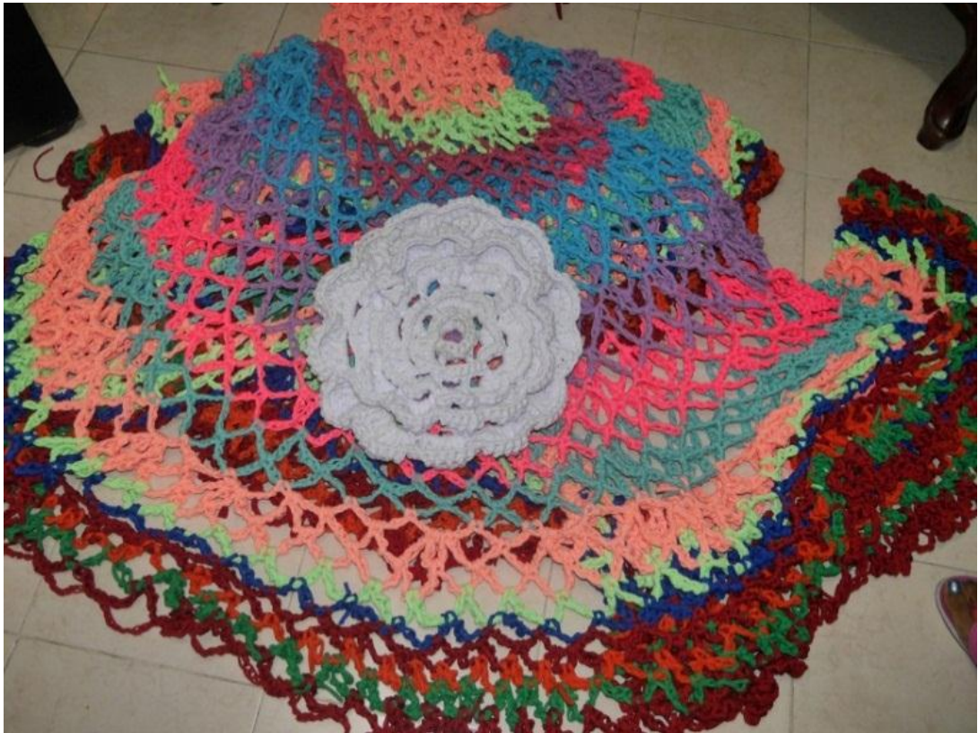
Figura 16. Flor blanca que simboliza cada una de las vidas desaparecidas, secuestradas y muertas