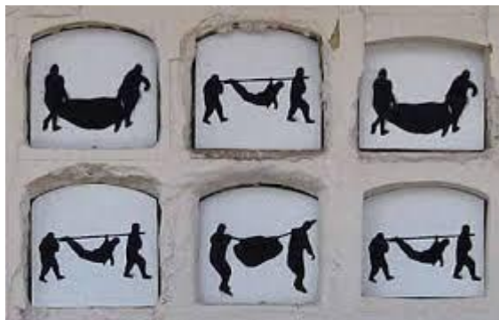
Figura 10. Auras anónimas