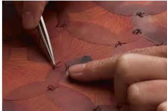
Figura 9. A flor de Piel.

Fuente: https://www.google.com.co/search?q=doris+salcedo+a+flor+de+piel&neww indo. Beatriz González