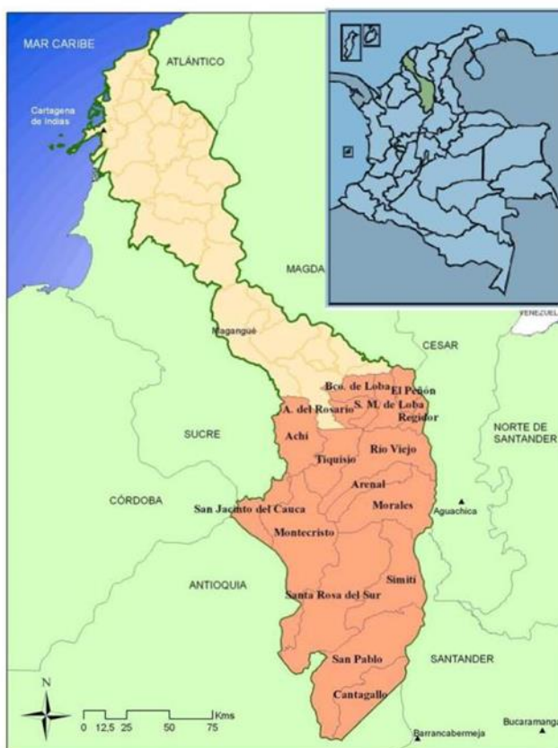
Ilustración 2 División político-administrativa del Cono Sur de Bolívar.