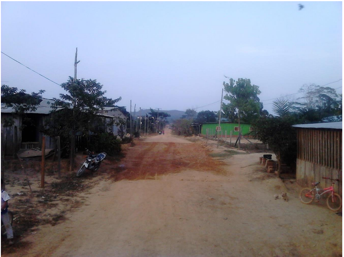
Fotografía 1 Calle principal del Corregimiento Buenavista, Sur de Bolívar

Buenavista es un corregimiento ubicado en el norte del país, a seis horas aproximadamente del municipio Santa Rosa del Sur del departamento de Bolívar. Actualmente pertenece a este municipio, sin embargo, no siempre fue así, ya que en sus