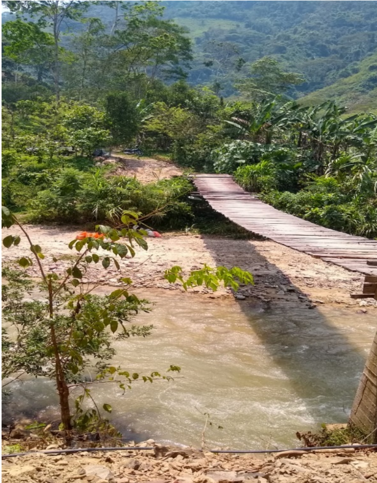
Figura 22, segundo puente colgante