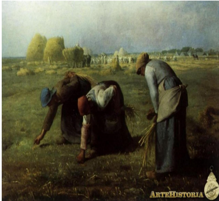
Figura 10, Las espigadoras (1857)