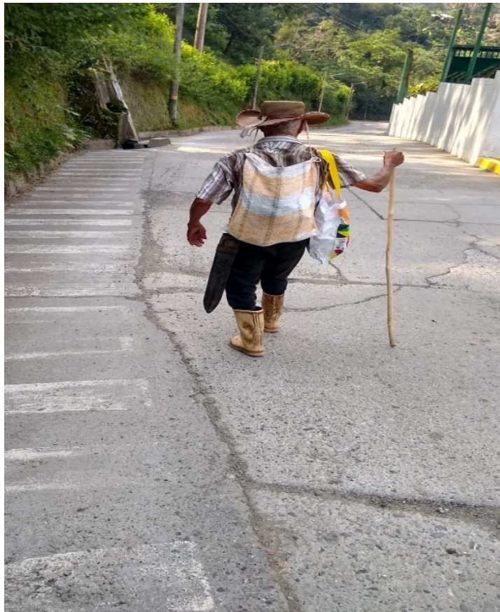
Figura 18, recorrido por carretera en cemento.