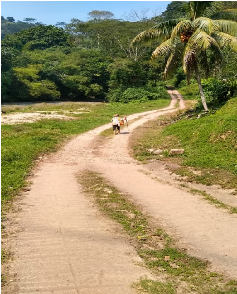
Figura 21 , una larga carretera destapada