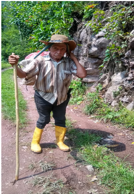
Figura 1 , un anciano campesino en la trocha.