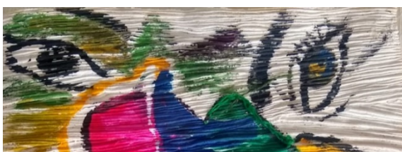
Figura15 , experimentación sobre la corteza de mazorca aplanchada

La hoja de la mazorca, mientras esta tierna es flexible y se presta al tejido, pero una vez seca se revienta con facilidad, para impregnarla era necesario que estuviera bien seca, una vez impregnada se podía aplicar el acrílico y también bordar, aunque hacerlo de esta manera ocultaba el color natural que esta poseía.