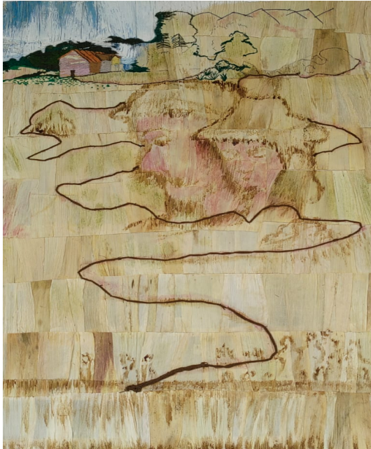
Figura 33, avance artístico La ruta