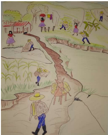
Figura 31 , las Faenas

La textura y coloración de manchas de este soporte, invita a observar detenidamente y encontrar en ella figuras de algunos animales considerados plaga para los cultivos (hormigas, grillos, roedores), además el contraste de sus colores da la ilusión de un caos climático.