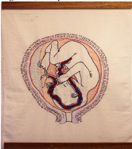
Figura 8, José por dentro.

Clara Nogueira Traza una imagen que refleja el destino de la mujer, desde el paraíso hasta nuestros días, es una reflexión y una invitación para cambiar esa postura de sometimiento. Ella emplea materiales textiles y a forma de aplicación bordada ( patchwork ) expresa su sentir feminista.