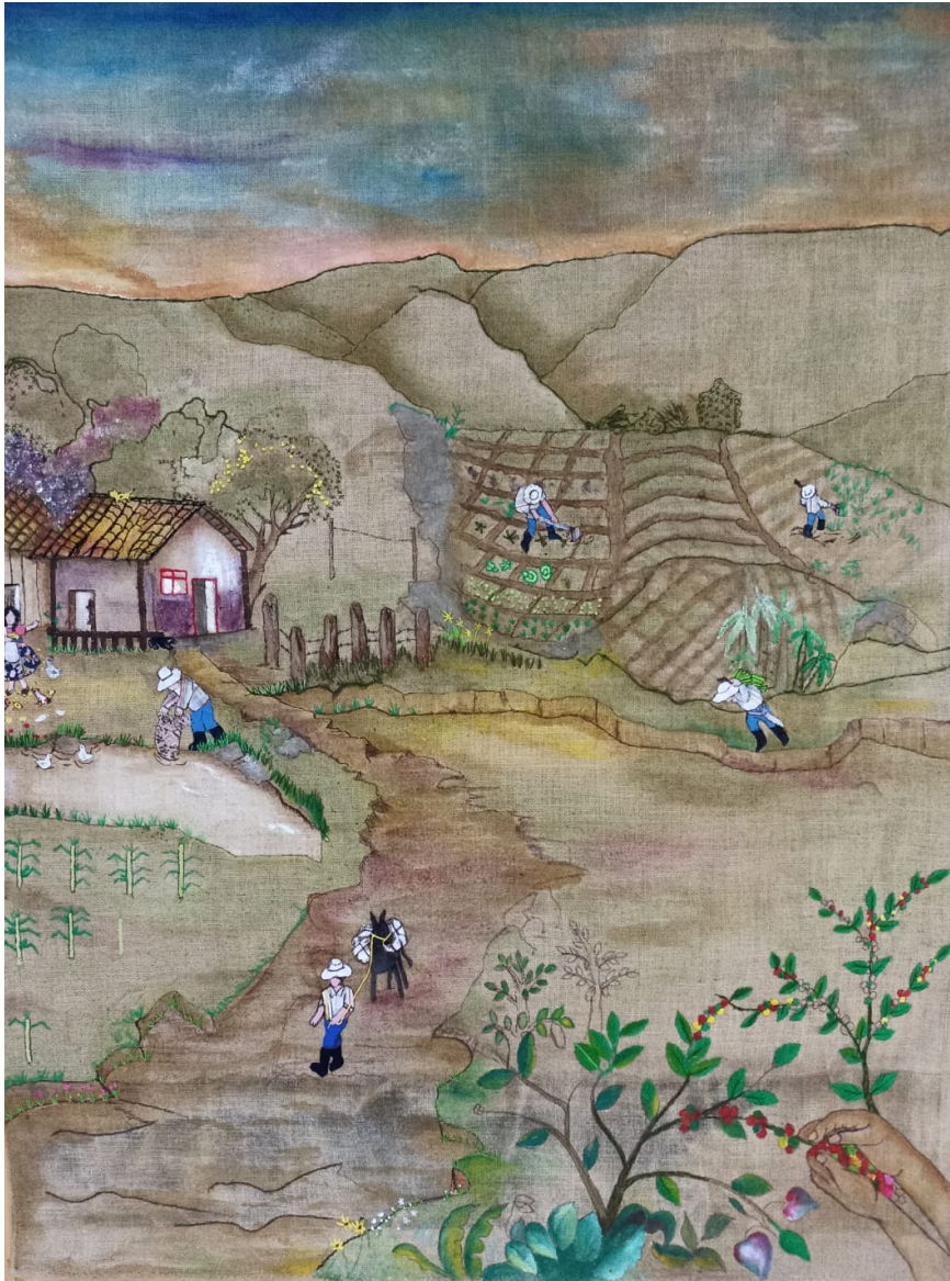
Figura 39 ,obra “Las faenas”