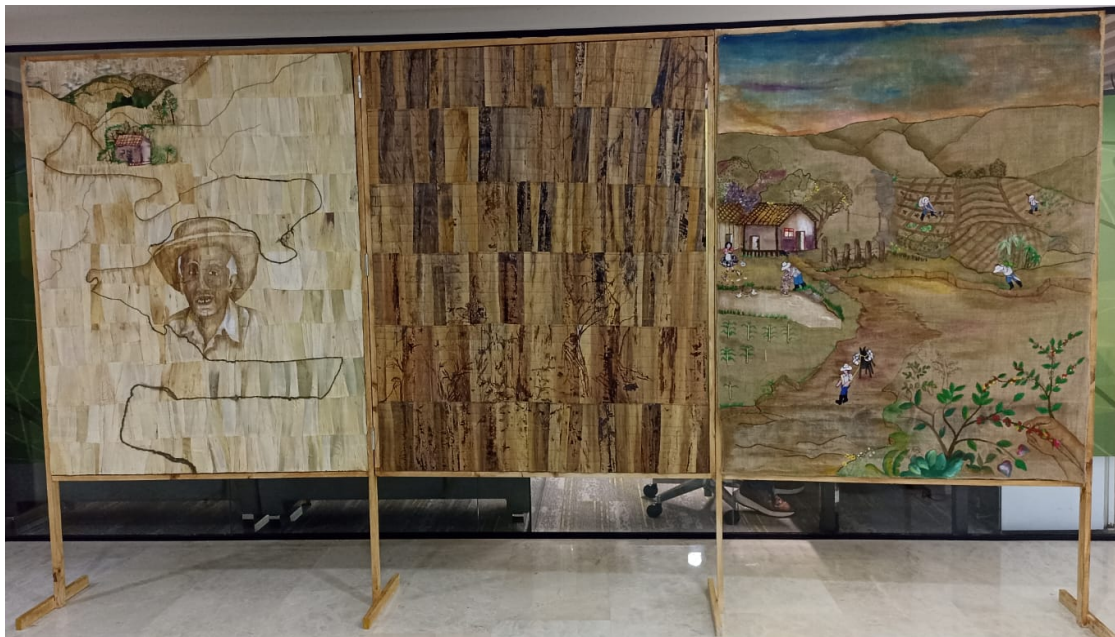
Figura 36, Sudor con tierra, la resonancia del campo