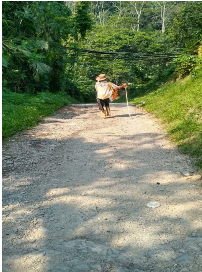
Figura19 ,comienzo carretera destapada

El comienzo de este recorrido fue a las 9:10 a.m.