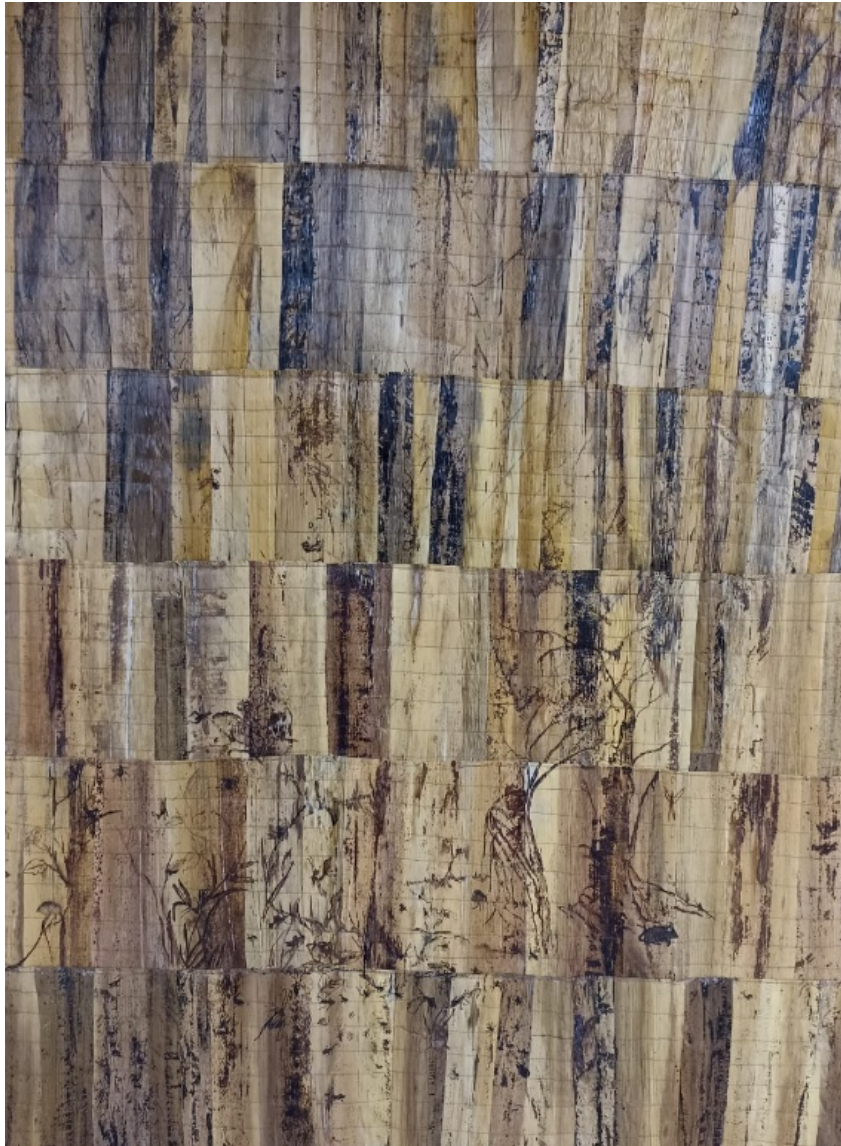
Figura 38 , obra “Caos Natural”