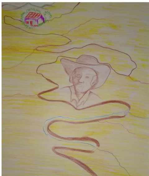
Figura 28. Ruta #1

Los bocetos que realicé son: Ruta, caos natural, faenas, montaje de la obra.