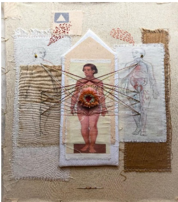
Figura 9, Los días de estar a solas

Creo que cuando se borda, siempre se requiere de un momento especial, para conectar la creatividad, con la espiritualidad y así lograr ese tiempo especial donde los hilos y la aguja comienzan a danzar sobre la figura signada, dando puntadas precisas a la imagen que pide vida y color.