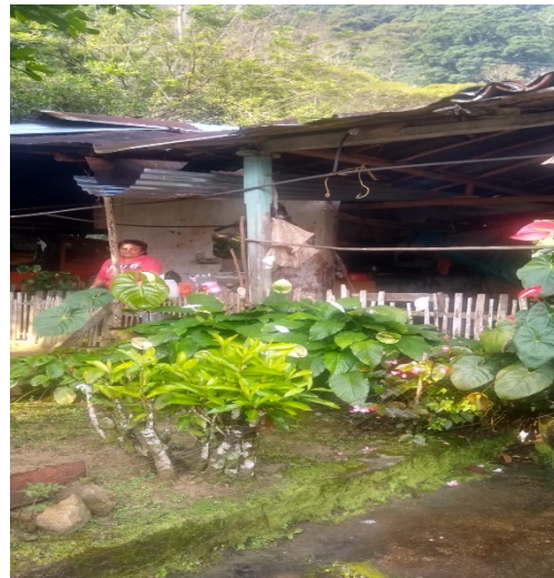
Figura 27 , finca de María