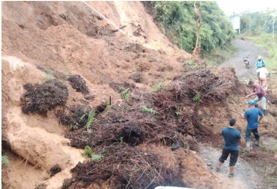
Figura 3: Derrumbes en Santa Helena del Opón, Santander, 2023