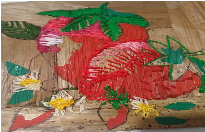
Figura 17, experimentacion con la corteza de platano pintada con acrilico y bordada.