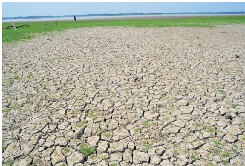
Figura 5: Sequía en el Río Magdalena (Santander).