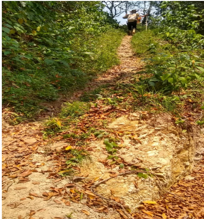
Figura 25 , comienza la trocha.

El descanso, lo usa para renovar fuerzas y dar comienzo a la última etapa del camino .La trocha es angosta muy orillada hacia la ladera de la montaña, además esta llena de curvas interminables que producen leves mareos, mientras quitan el aliento.