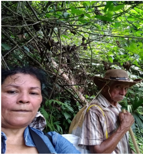
Figura 26 , sudor con tierra. En carne propia