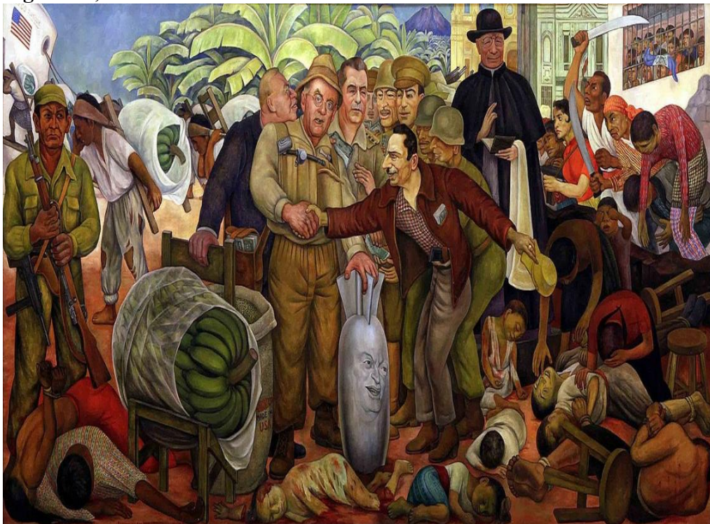
Figura 11, Gloriosa victoria

El enfoque que le está dando a la obra en este proceso creativo que pretende esta investigación, es de carácter social, porque hay un grupo poblacional en abandono y explotación en el sector rural, que está buscando ser valorizado en Colombia no solo por el estado, sino también por el sector urbano.