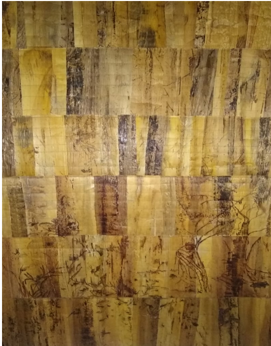
Figura 35, avance artístico Caos Natural