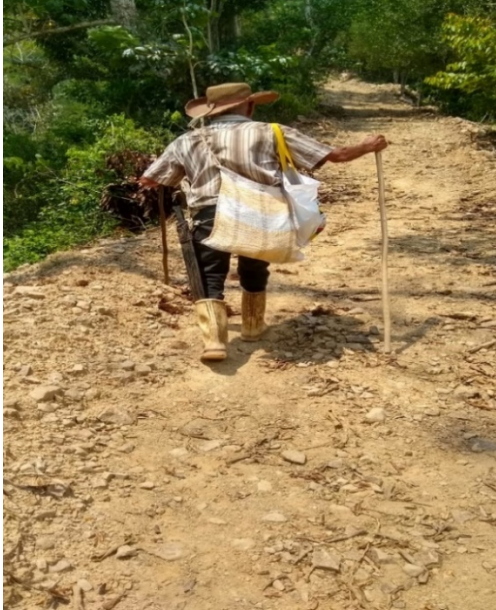
Figura 23 , nueva carretera destapada