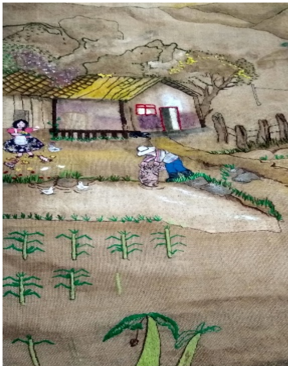
Figura 34, avance artístico Las faenas