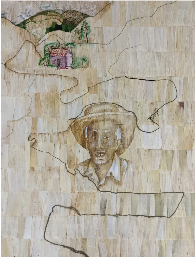
Figura 37, Obra” La ruta “