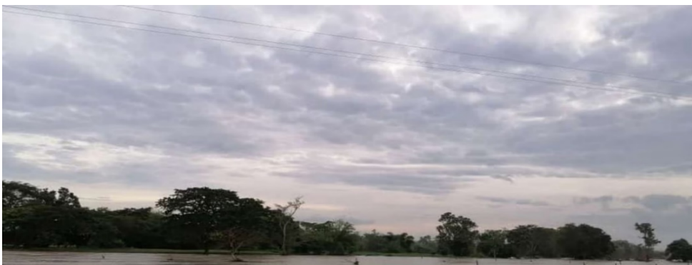
Figura 4 , desbordamiento del río Cáchira.

Las variaciones que suceden en la temperatura y en las precipitaciones del territorio colombiano a causa del cambio climático, afectan a los cultivos disminuyendo su producción, la calidad, la disponibilidad y haciendo que el precio de los alimentos de origen agrícola aumente drásticamente. Las fuertes y constantes lluvias que causan inundaciones, desbordamientos de ríos y deslizamiento de tierra, afectan vías, viviendas y producción agrícola. Otro problema para los campesinos son la aparición repentina de las heladas que arruinan sus cultivos. Cuando acaba el invierno, el campesino comienza otra lucha contra el verano y sus ráfagas de calor, que en diversas ocasiones provoca los incendios forestales, acabando con hectáreas de flora y fauna.