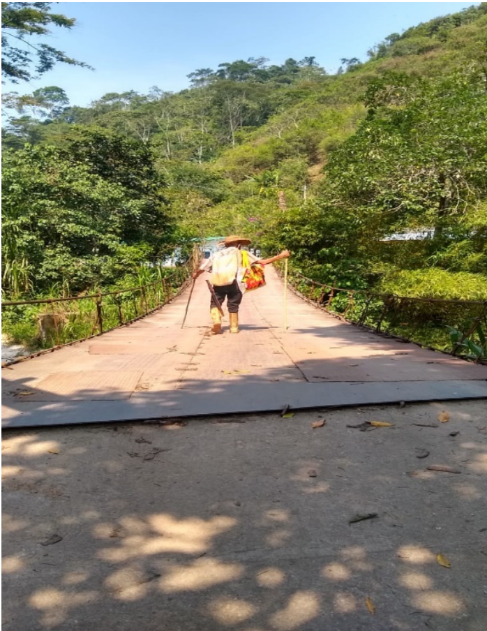
Figura20 , primer puente colgante

es de 20 minutos de caminata ,donde el abuelo Libardo se ve sin fatiga, por la costumbre de transitar ese camino desde los 15 años .