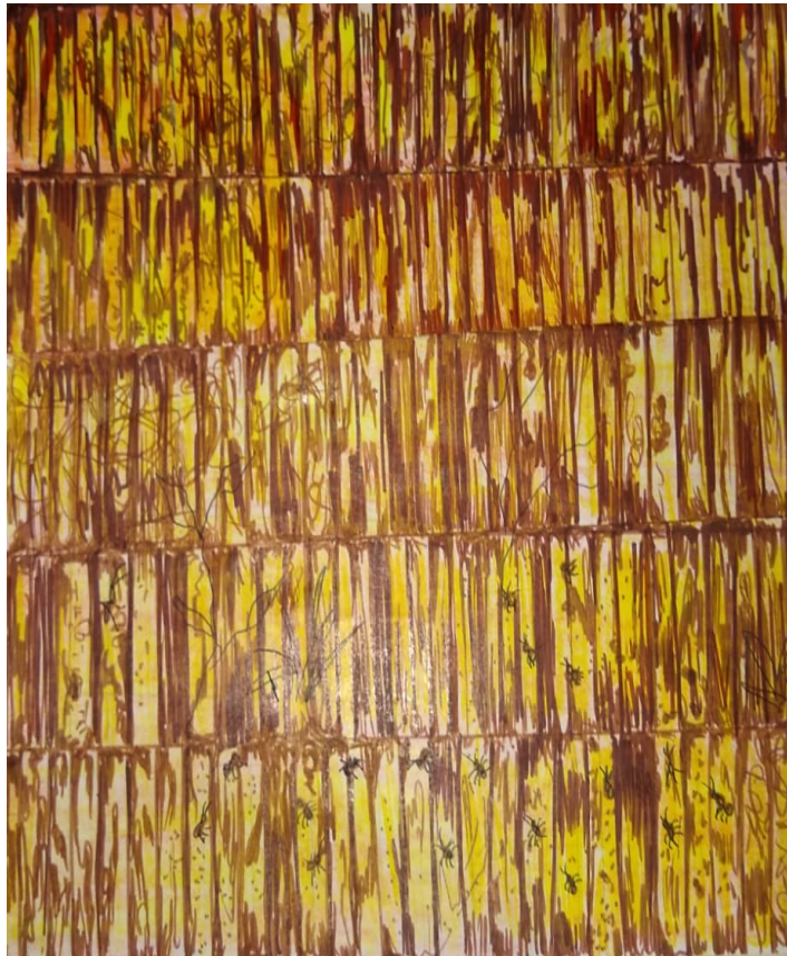
Figura 30. Caos Natural.