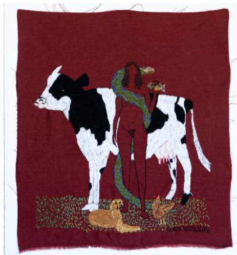
Figura 7, El mal hablado.