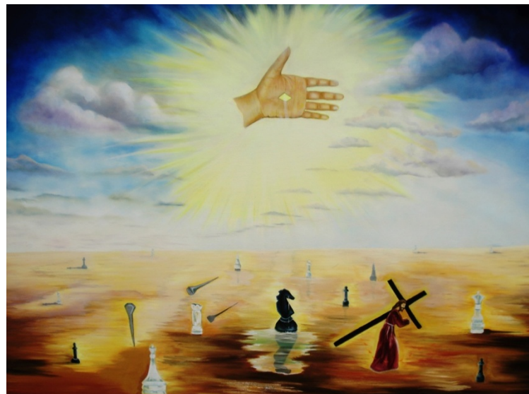
Figura 6. Boceto. Paola Andrea Martínez Gómez. El gran juego. 2008. Óleo sobre lienzo. Colección personal.

Andar y aquellos paisajes hermosos se convirtieron en un gran desierto de fichas ajedrez y a lo lejos un personaje con una cruz a cuestas. Me desperté sobresaltada, e hice este apunte y un boceto (ver figura 6).