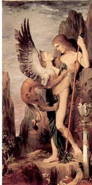
Figura 2. Gustave Moreau: Edipo y la esfinge (1864)