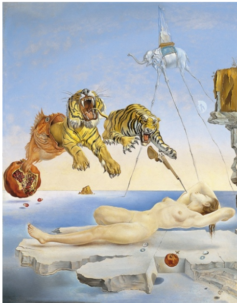
Figura 1. Salvador Dalí: Sueño causado por el vuelo de una abeja alrededor de una granada un segundo antes de despertar.

Fuente: Salvador Dalí. Robert Descharnes, Gilles Néreditor. Editorial Tachen Benedikt 1904-1989 Castagnola (Suiza). Pg 144.