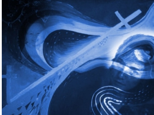
Figura 17. Fotografía. Paola Andrea Martínez Gómez. Estados del ser. 2009. Fotografía. Colección personal.