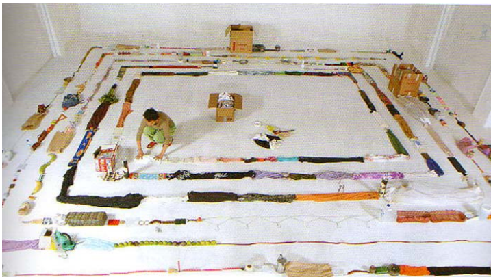
Figura 3. María Teresa Hincapié: Una Cosa es una Cosa.

Lo interesante en su trabajo es la manera en la que utiliza las acciones para generar reflexiones, de manera que sus imágenes se convierten en situaciones. A partir de su obra, considero importante un análisis propio, en el cual es necesario evaluar la coherencia de mi criterio con el entorno, alrededor de una temática pertinente. 17 (Ver figura 3)