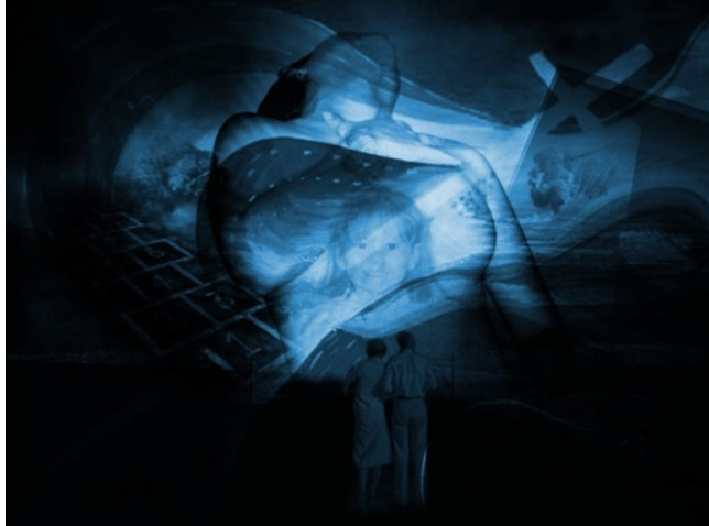
Figura 15. Fotografía. Paola Andrea Martínez Gómez. Paso del tiempo. 2009. Fotografía. Colección personal.