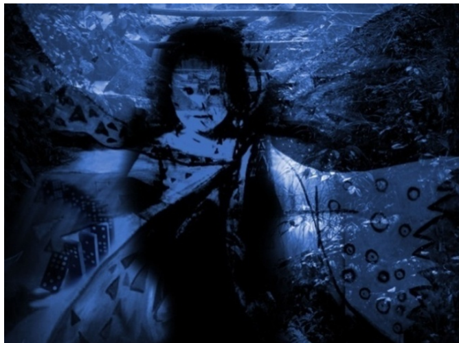
Figura 16. Fotografía. Paola Andrea Martínez Gómez. Bosques del silencio. 2009. Oleo sobre lienzo. Colección personal.