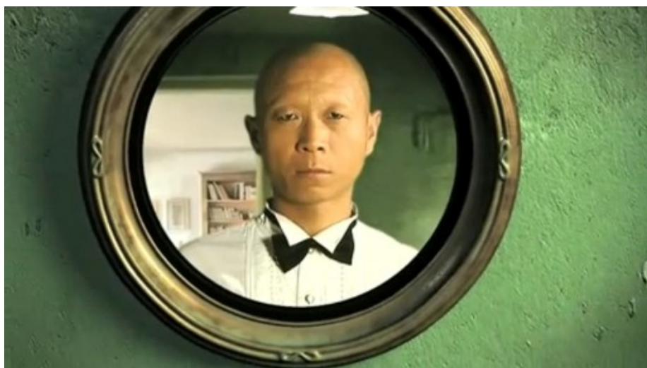
Figura 5. One Dream Rush. 42x 42