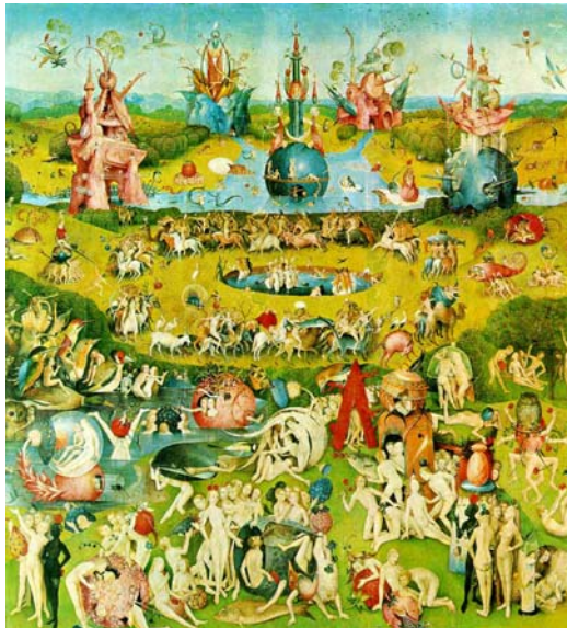
Figura 4. El Bosco. Jardín de las delicias (Museo del Prado)