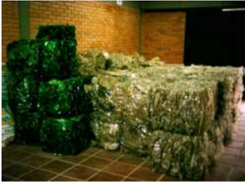
Foto 11. Producción de plástico