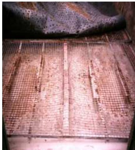
Fotos 2 y 3. Celdas de compostaje

El sistema posee una pendiente del 7.5% para la evacuación de lixiviados. Para permitir el paso de aire hacia la superficie se colocaron bases en bloque de ladrillo para el montaje de bases en malla en cuyo plano superior se dispone una lámina de material sintético con agujeros en malla de 15 cm. con un diámetro de 1.3 cm. a fin de permitir el paso de aire.