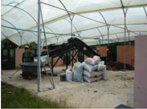
Foto 9. Producción de abono tipo compost Material reciclable no orgánico

Cantidades de material requerido: En el momento existe una sobredemanda en los productos finales. La planta en promedio esta produciendo 10 Ton/mes, los pedidos que llegan a planta alcanzan 25 ton/mes. El sitio donde se origina la demanda es principalmente la zona rural de Garagoa y municipios aledaños.