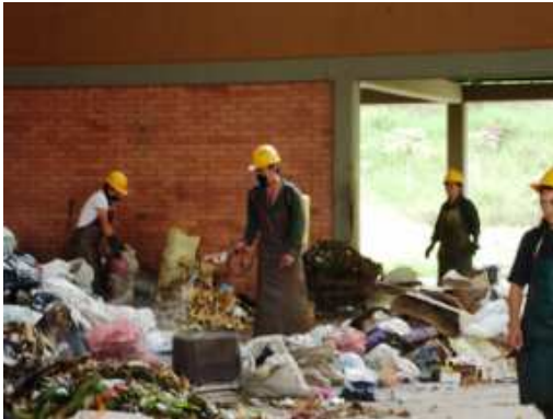
Foto 7. Clasificación manual de material

A continuación se realiza la clasificación manual primaria de material distribuyéndolos por grupos y realizando la evacuación del material orgánico que llega a la planta; para lo cual se cuenta con cuatro operarios, los cuales distribuyen sus labores de la siguiente manera; tres de los trabajadores clasifican los residuos y los congregan en grupos de material general, es decir, plásticos, material ferroso y de aluminio, de papel y cartón, vidrio, madera textiles y materiales inertes, material orgánico; este último junto con el material inerte y el contaminado es recogido y transportado por el cuarto hombre, quien manualmente por medio de carretilla distribuye el material a la zona de orgánico y al sitio de disposición final según sea el caso.