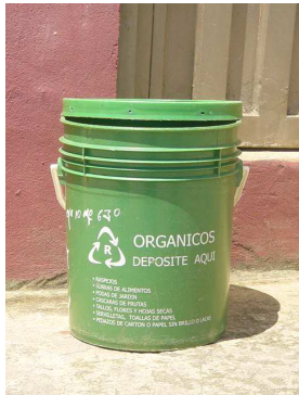
Foto 15. Recipiente para disposición de residuos domiciliarios.

La Corporación Autónoma Regional de Chivor - CORPCHIVOR junto con los municipios y la OEI, adelantaron en el segundo semestre de 2007 una entrega de canecas (dos por vivienda), en las zonas urbanas de toda la jurisdicción con el fin de fomentar la separación en la fuente y la buena disposición de los residuos sólidos.