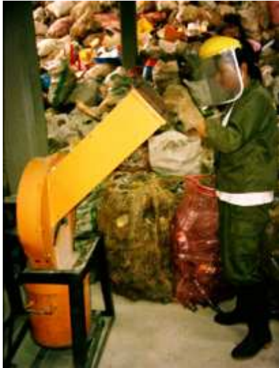
Foto 8. Proceso de molienda de casco de vidrio

B. Plástico: El proceso del plástico es similar al del vidrio, luego de ser separado en diferentes grupos se optimiza limpiando y quitando las etiquetas y tapas que tenga y luego se muele.