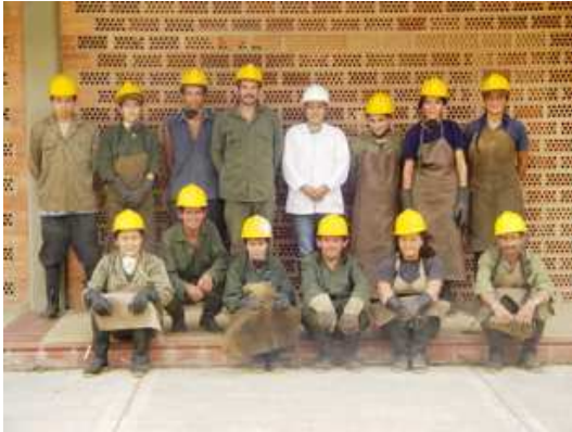
Foto 14. Personal administrativo y operativo para actividades de aprovechamiento y disposición final.