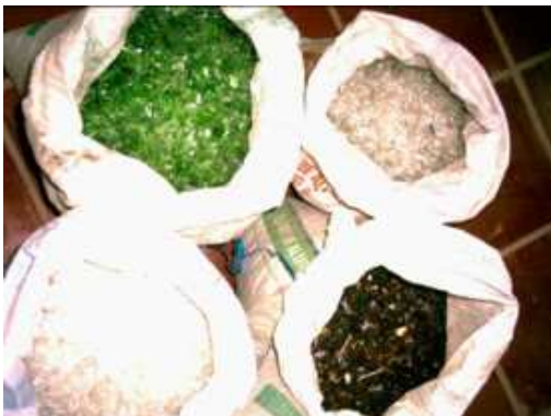
Foto 10. Producción de vidrio