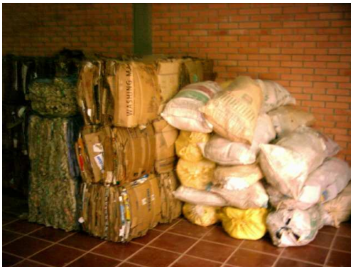
Foto 12. Producción de papel y cartón