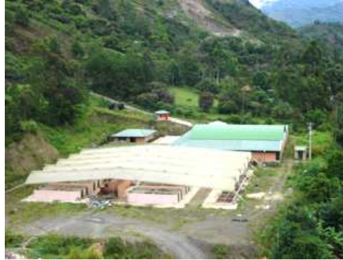
Foto 1. Planta Regional de Tratamiento de Residuos Sólidos del Municipio de Garagoa

Actualmente la separación empleada en planta es de tipo manual, esta se realiza en el patio de descarga de material inorgánico y en ella misma se realiza el proceso de separación. El personal destinado para estas labores varía según la cantidad de residuos sólidos que lleguen, de igual manera se realiza un proceso de separación en fuente donde un gran porcentaje de los usuarios del servicio realiza una aceptable selección de material dentro del municipio de Garagoa.