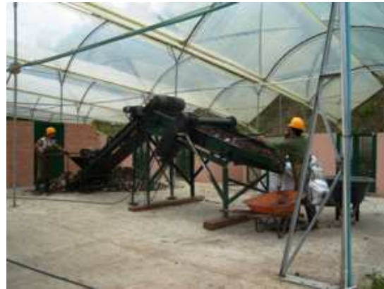
Foto 6. Proceso de molienda, zarandeado y empaclado

3.3.3. Material Inorgánico: Los vehículos recolectores disponen los residuos de tipo inorgánico en la bodega principal, donde se realiza la separación y distribución de los diferentes materiales aprovechables que llegan a la planta a través de la recolección del casco urbano de los municipios y empresas adscritos a la planta.