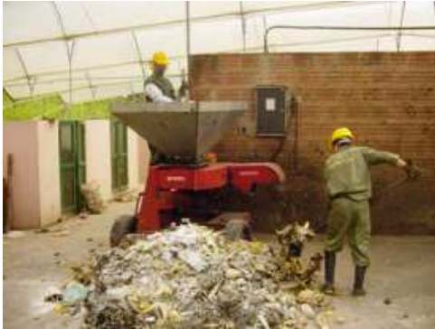
Foto 4. Procesamiento de material orgánico Instalaciones para el compostaje

El proceso de compostaje presenta dificultades en el tiempo de maduración, por lo que se está adelantando el estudio de la microflora, así mismo se evaluó la presencia de metales pesados con el fin de determinar las posibles causas de su presencia, para la microflora se adelanta con el fin de determinar los inhibidores necesarios y el tipo de tratamiento más adecuado para eliminar patógenos y así mismo reducir el tiempo de compostación del material.