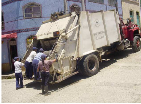
Foto 16. Operarias para recolección y transporte. Cooperativa RETRASUR.

Para el caso de Garagoa la empresa contrata con la Cooperativa RETRASUR el barrido, realizado por cinco personas, más un guadañador, así mismo dos personas apoyan la recolección.