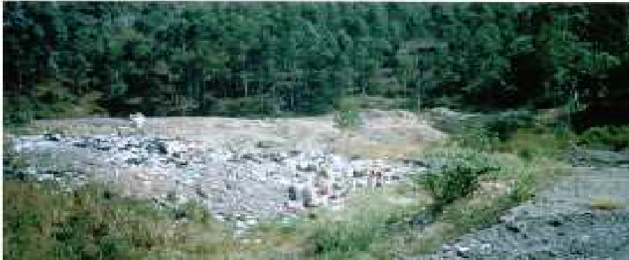
Foto 13. Zona de botadero

manejo que se da a este proceso la autoridad ambiental dio un plazo en la vigencia 2008 para implementar un sitio tecnificado de disposición.