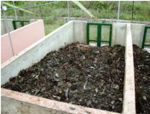
Foto 5. Proceso de maduración

La producción de abono orgánico se encuentra en un rango del 30% al 40% aproximadamente en peso de producto, es decir, en una celda de compostaje, en la cual se disponen normalmente 7 toneladas se sacan normalmente en promedio de 2,1 a 2,8 toneladas de abono procesado, esta producción varía según el contenido de humedad que contenga el producto final, normalmente la humedad relativa se encuentra entre el 20% y el 10%, esta humedad favorece el comportamiento del abono orgánico ya que se facilita la absorción de nutrientes.