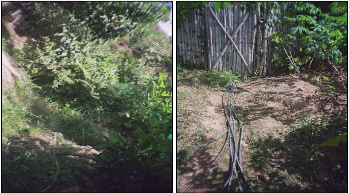
Fotografía 3. Pozos de agua natural. Plan Los Héroeos

quebrada de Guatiguará y también por pozos de agua natural, mientras que el sector de las Margaritas construyó un tanque para el almacenamiento del agua, la cual se trae de la cascada de Altos de Ruitoque y se distribuye por medio de mangueras.