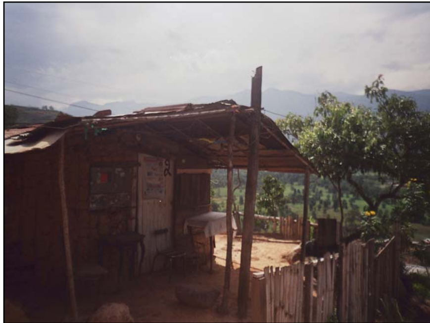
Fotografía 2. Condiciones de la vivienda

El 97% de las viviendas poseen servicio eléctrico, la comunidad gestionó dos transformadores, que fueron adquiridos a través de un contratista ajeno a la entidad oficial (ESSA); actualmente se encuentran en el proceso de legalización con esta entidad.