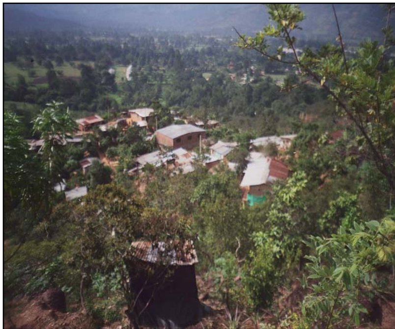
Fotografía 1. Vista panorámica Asentamiento de Nueva Colombia