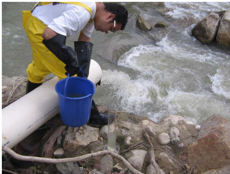
Figura No 2 Caracterización del Vertimiento

Para la determinación del caudal en la descarga se efectuaron 6 mediciones cada 4 horas durante 24 horas al vertimiento. (Ver Figura No 2 y Anexos 3 y 4).