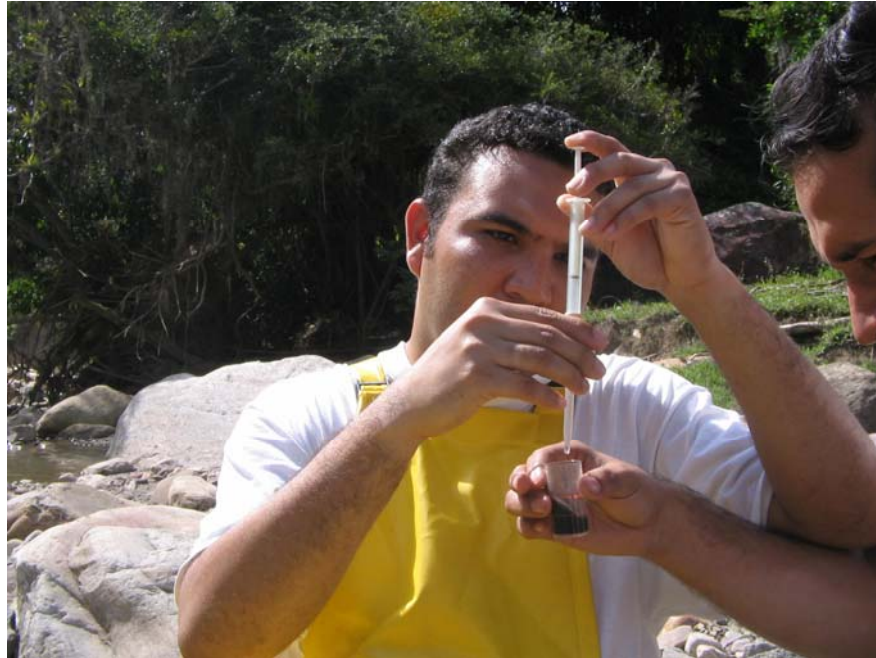
Figura No 3 Titulación medición Oxígeno Disuelto

Siguiendo los lineamientos mínimos establecidos en el RAS 2000 capítulo E.2 para niveles de complejidad bajo y la Guía Metodológica para el PSMV, se analizaron los siguientes parámetros Demanda Biológica de Oxígeno ( DBO_5 ), Demanda Química de Oxígeno (DQO), Sólidos Suspendedos Totales (SST), Coniformes (totales y fecales), y Parámetros in situ (Temperatura, pH).