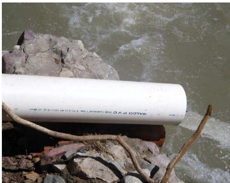
Figura No 1 Punto de vertimiento de las aguas residuales

El municipio de Labateca cuenta con un vertimiento puntual el cual está ubicado a 1475 metros sobre el nivel del mar con coordenadas geográficas Norte 1175074 y Este 1299776. (Ver figura No 1).