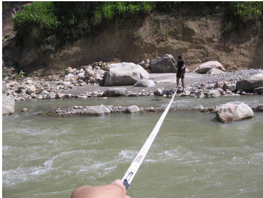
Figura No 4 División Fuente Aguas Arriba

los análisis de interés: DBO 5 , DQO, sólidos suspendidos y Coliformes (fecales y Totales). La preservación de las muestras fue realizada de acuerdo con los estándares del IDEAM y fue transportada al laboratorio de Consultas Industriales adscrito a la Universidad Industrial de Santander con la correspondiente cadena de custodia. Los análisis de laboratorio siguieron la metodología del Standard Methods for the Examination of Water and Wastewater edición 20, 1998. (Ver Figura No 4)