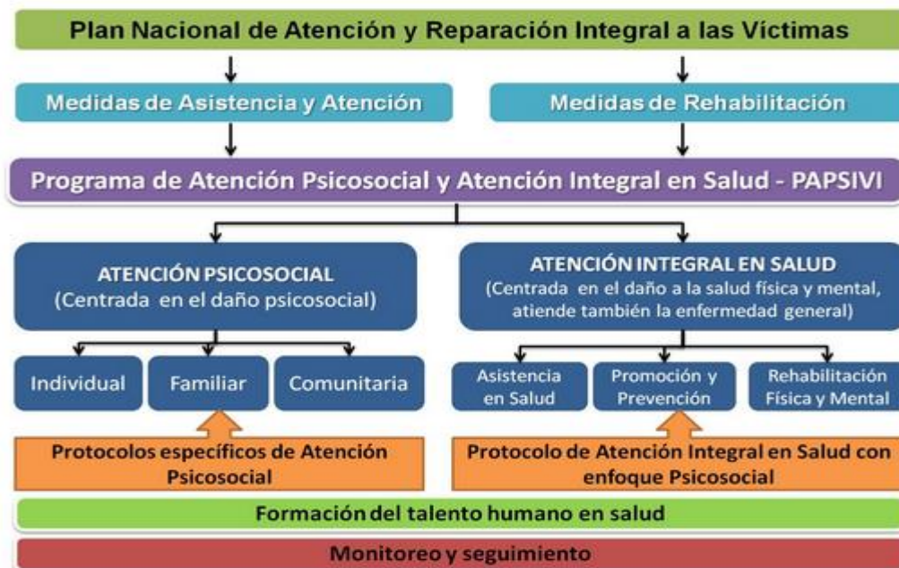
Figura 2. Plan Nacional de atención y reparación integral a las víctimas