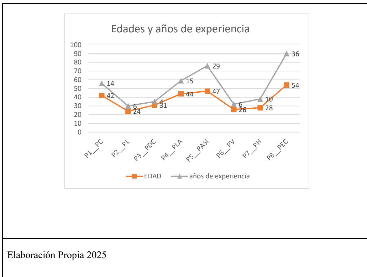
Gráfico 2. Edades y años de experiencia dentro de la representación social.

Cuando se les preguntó respecto a quienes eran ellas y su relación con la política hicieron referencia a su trayectoria dentro del escenario social y sus luchas.