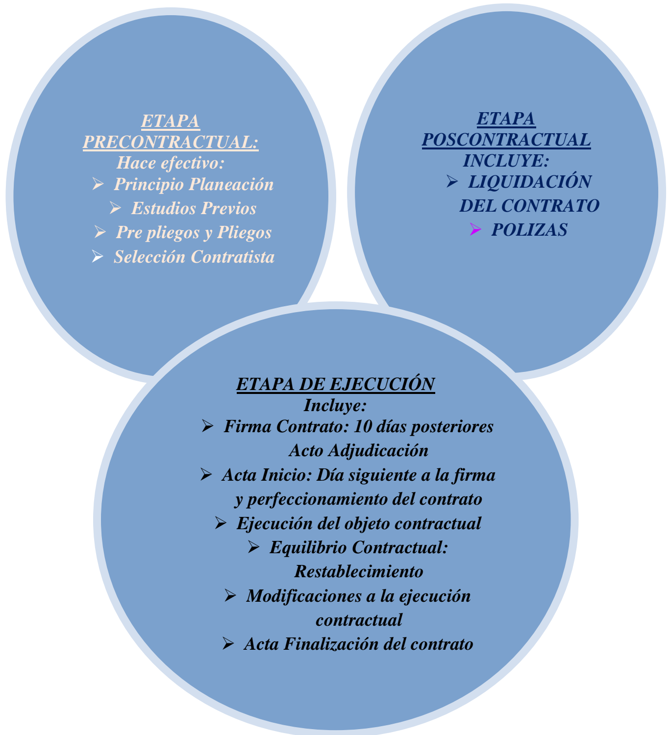
Figura 1. Etapas de Contratación al interior de la empresa