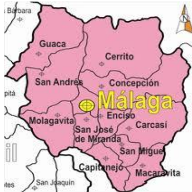
Imagen 4: Mapa Provincia de García Rovira

La ciudadanía que participo en una parte del proceso de esta provincia concluye que: