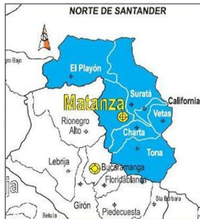
Imagen 7: Mapa Provincia de Soto

La ciudadanía que participo en una parte del proceso de esta provincia concluye que: