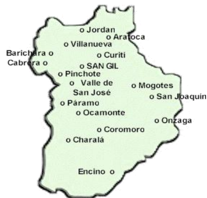
Imagen 5: Mapa Provincia Guanentina

La ciudadanía que participo en una parte del proceso de esta provincia concluye que: