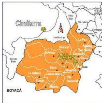
Imagen 3: Mapa Provincia de Vélez

Municipios Vinculados: BARBOSA, VELEZ, SUCRE, BOLÍVAR, EL PEÑÓN, PUENTE NACIONAL