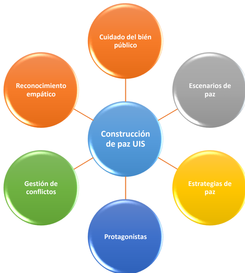
Figura 3 Construcción de paz en la Universidad Industrial de Santander.

procesos que permitan una educación integral, que coloque como eje principal el desarrollo social del contexto en el que se encuentra inmersa.