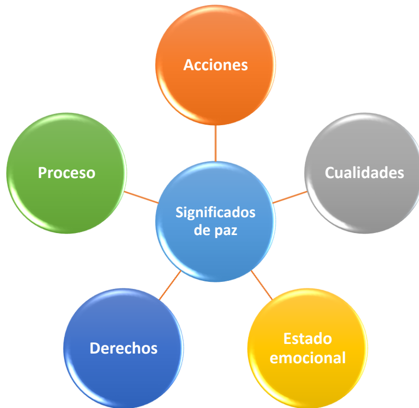
Figura 1 Significados de paz