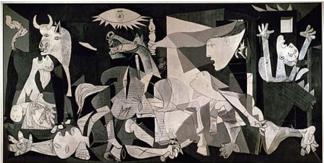
Pablo Picasso Guernica (1937)