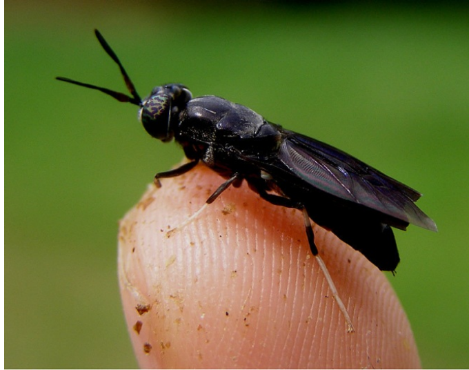
Figura 1. Adulto de la mosca soldado negro ( H. illucens L.)

2.2.1 Mosca soldado. La mosca soldado negra es una especie de díptero braquícero de la familia Stratiomyidae, originaria de América, pero que se ha extendido por el sur de Europa, África, Asia e islas del Pacífico (Figura 1)