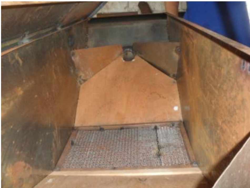
Figura 11. Parte interna del cosechador

El cosechador va montado sobre una base de hierro a una altura de 0.60 m para evitar la acción de animales (Figuras 12).