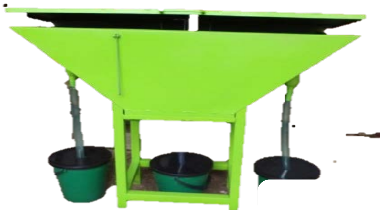
Figura 14. Cosechador totalmente terminado con recipientes para recolectar prepupas y lixiviados.

La figura 14 muestra el cosechador totalmente terminado, con todos sus acabados y el recipiente donde se colectan las prepupas de la mosca para su posterior uso ya sea como alimento de aves o de peces principalmente.