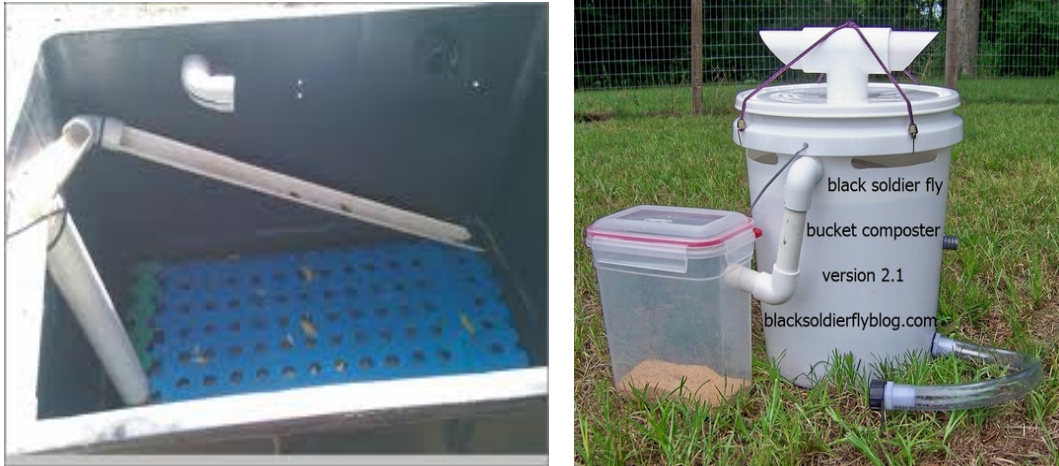
Figura 9. Cosechadores ó compostadores de tecnología avanzada.