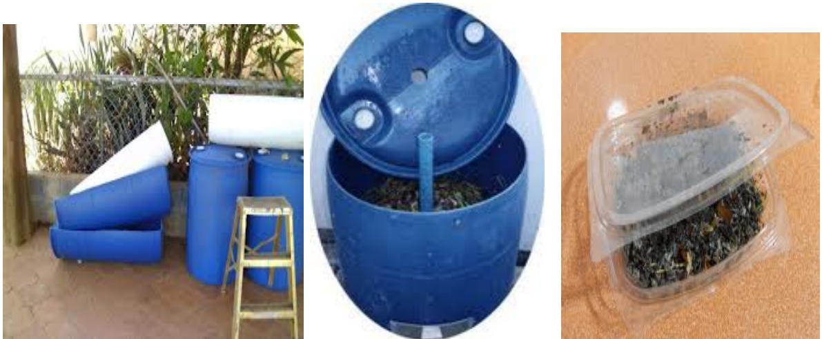
Figura 2. Cosechadores o compostadores rústicos para cría de larvas de la mosca soldado negro.

2.4.2 Cosechador o compostador tipo BSF: Este diseño se basa en una típica cubeta de 5 galones con tapa, y otras fáciles de encontrar como lo son las cajas que contienen elementos de hardware. El tamaño del compostador de desechos orgánicos o cosechador de larvas de la mosca soldado negro es ideal para pequeñas cantidades de basura, ya que se puede mover muy fácilmente, es menos susceptible de recargar con restos de comida (Figura 3).