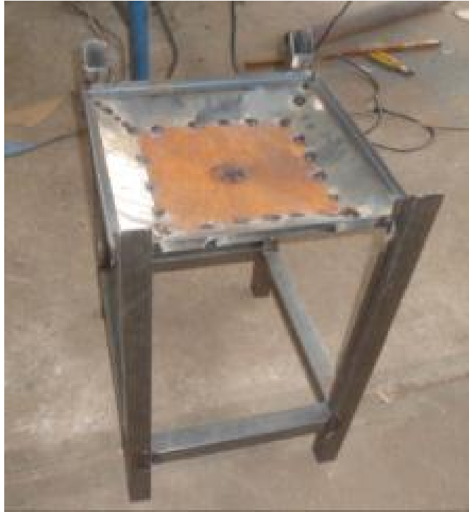
Figura 12. Base de hierro sobre la cual se monta el cosechador

4.3.2 Construcción del prototipo. El cosechador a construir, será de lámina galvanizada, amplio con una altura de 1,10 m. Práctico de fácil manejo y pintado en base anticorrosiva y pintura de acabado, con el fin de que no se dañe por la humedad. Además tendrá patas reforzadas en ángulo, las cuales se podrán quitar para transportarlo de un lugar a otro (Figura 13).