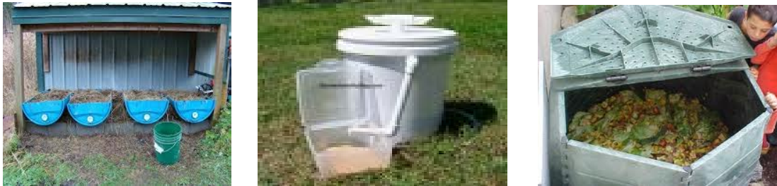
Figura 6. Prototipos de cosechadores evaluados.

En cada modelo se colocó alimento consistente en una mezcla de tamo de arroz y desechos vegetales de patilla y tomate. Este sustrato se inoculó con 300 larvas de la mosca soldado negro ( H. illucens L) con una semana de eclosionadas las cuales fueron cedidas por los estudiantes-investigadores Salomón Espinosa y Marcellly Peña de La Universidad Industrial de Santander. A estas larvas se les realizó el seguimiento diario midiendo las variables temperatura, humedad relativa y cantidad de migración de larvas maduras por día, en los horarios 9 A.M y 3 P.M. Después de los 20 días se realizó el conteo total de larvas migratorias, para realizar las respectivas comparaciones entre los cosechadores evaluados.