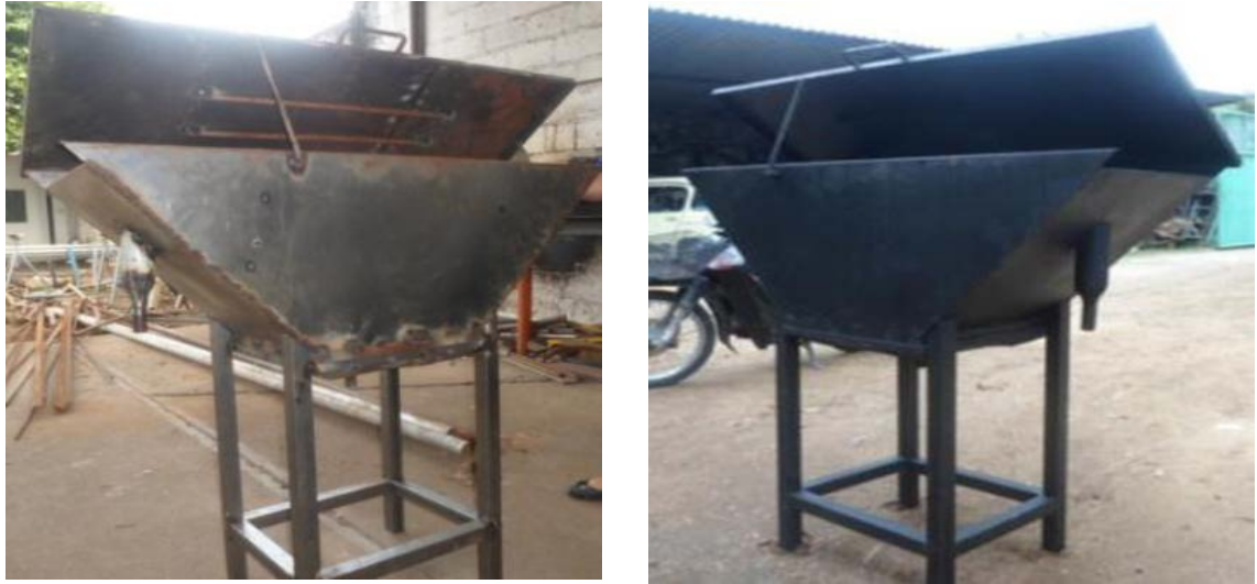
Figura 13 Prototipo de cosechador sin pintura (izquierda) con pintura anticorrosiva (derecha).

La figura 14 muestra el cosechador totalmente terminado, con todos sus acabados y el recipiente donde se colectan las prepupas de la mosca para su posterior uso ya sea como alimento de aves o de peces principalmente.