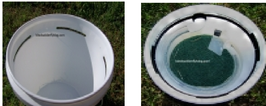
Figura 4. Cavidad y fondo con rejilla del cosechador BSF

En el fondo de la cubeta se coloca una rejilla como especie de filtro con el propósito de permitir el flujo de los lixiviados al fondo y ser drenados mediante una manguera ubicada en la parte inferior. La función más importante de un BSF compostador es que drene el exceso de líquidos rápida y completamente para evitar malos olores (Figura 4).