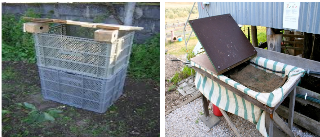
Figura 7. Cosechadores ó compostadores rústicos

La literatura y el internet reportan muchos prototipos de cosechadores de larvas ó compostadores de material orgánico, su eficiencia, durabilidad costos y perspectivas se acomodan a las condiciones empresariales y situación de cada caso en particular. Existen muchos modelos y prototipos desde los más rústicos hasta los más sofisticados (Figuras 7, 8 ,9)). Esta revisión y búsqueda de información dio las bases fundamentales para el desarrollo del trabajo, el diseño y la construcción del cosechador.