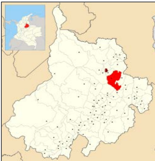
Figura 5. Localización geográfica de la Granja Educativa Experimental UIS “El Hangar” Piedecuesta, Santander

El trabajo de diseño y construcción del cosechador de larvas de la mosca soldado negro o compostador de desechos orgánicos se desarrolló en predios de la Granja Educativa “El Hangar” de propiedad de la Universidad Industrial de Santander “UIS”. El centro experimental se localiza en el municipio de Piedecuesta (Santander) dentro de las coordenadas 6° 59' 06" latitud norte y 71° 01' 17" longitud oeste según meridiano de Greenwich, a una altura de 985 metros sobre el nivel del mar, con temperatura promedio de 23° C, humedad relativa del 83%, luminosidad de 1230 horas anuales y precipitación promedia anual de 1500 milímetros (Figura 5).