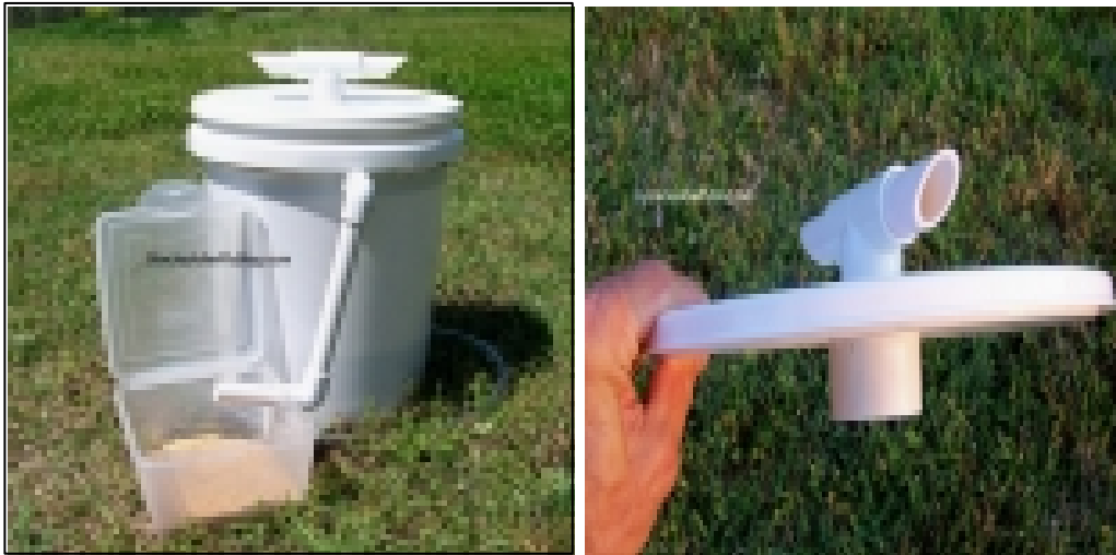
Figura 3. Cosechador o Compostador tipo BSF

En el fondo de la cubeta se coloca una rejilla como especie de filtro con el propósito de permitir el flujo de los lixiviados al fondo y ser drenados mediante una manguera ubicada en la parte inferior. La función más importante de un BSF compostador es que drene el exceso de líquidos rápida y completamente para evitar malos olores (Figura 4).