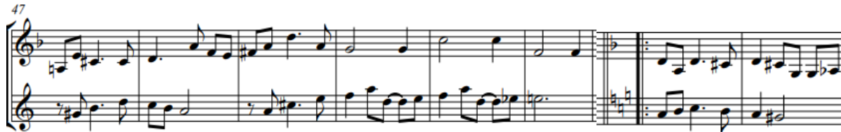
Imagen 17. Primera semifrase sección B

Después de esta sección se reexpondrá A para así dar final a la obra.