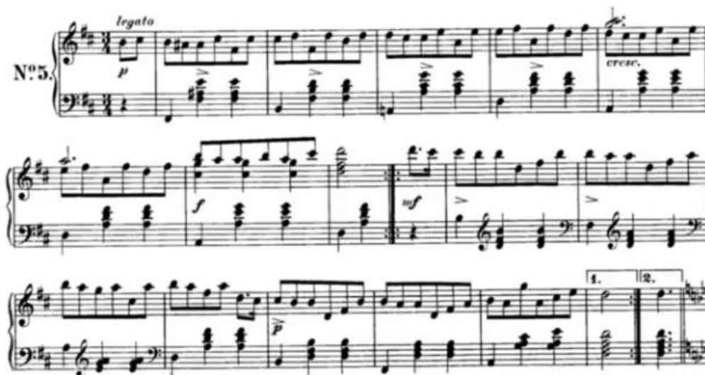
Imagen 2. Danza N.5 Schubert