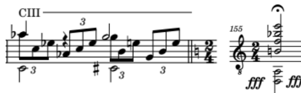
Ilustración 7 Adagio sostenuto (Sonata para piano n.º 14 en do sostenido menor) - Ludwig van Beethoven. Compases 154 y 155.

La intención de esta transición es mostrar un contraste directo entre las dos obras y presentar de manera impactante la entrada de la música contemporánea. Se busca resaltar la diferencia entre la dulzura de "Claro de Luna" y la personalidad distintiva de la danza de Brouwer. Esta transición enérgica y provocativa añade una dimensión emocional adicional al conjunto de la interpretación.