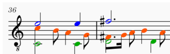
Ilustración 1 The Earl of Essex his Galliard - John Dowland. compás 36 y 37.

Cada voz se presenta con un color diferente