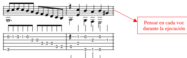
Ilustración 15. Variaciones sobre Guárdame las vacas - Luis de Narváez. compases 22 y 23

Otro aspecto importante para considerar es la interpretación de la obra utilizando la pastilla del puente de la guitarra. Esta pastilla resalta las frecuencias agudas y nos permite acercarnos al tono brillante de un laúd de la época, en contraste con el sonido de una guitarra contemporánea.