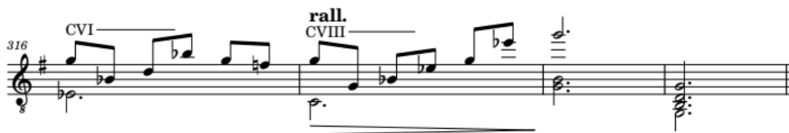
Ilustración 14 Pueblito Viejo - José Alejandro Morales (arr. Andrés Villamil). Compás 316 -319.

Para finalizar esta obra, se conserva fielmente el final del arreglo de Andrés Villamil, donde se pueden apreciar los compases 316 al 319. En esta sección, se presenta una progresión armónica notable, destacada por la inclusión del acorde Ebmaj7. Este acorde se toma prestado de la tonalidad de Sol menor, donde desempeña el papel de IV grado. Al incorporar este acorde en la progresión, se logra crear una sonoridad más rica y compleja. A continuación, se continúa con el acorde Bm, que representa el vi grado de la tonalidad de Sol mayor, aportando un matiz modal y añadiendo una sutil tensión armónica. Por último, la progresión resuelve en el acorde G, que es el I grado en la tonalidad de Sol mayor, brindando una sensación de estabilidad y conclusión agradable al oído. Esta selección armónica confiere un cierre convincente y satisfactorio a la obra.