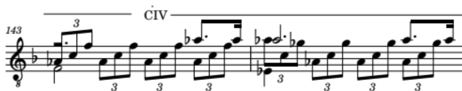
Ilustración 6 I. Adagio sostenuto (Sonata para piano n.º 14 en do sostenido menor) - Ludwig van Beethoven. Compás 143 y 144.

La transición hacia la siguiente obra se produce en el compás 155, y se caracteriza por ser directa y un tanto audaz. Se produce un corte repentino con un acorde disonante para dar paso a la siguiente pieza, que es una danza característica de Leo Brouwer, con un lenguaje más rítmico y disonante en comparación con la obra anterior. Estas dos piezas son polos opuestos en términos de aspectos sonoros.