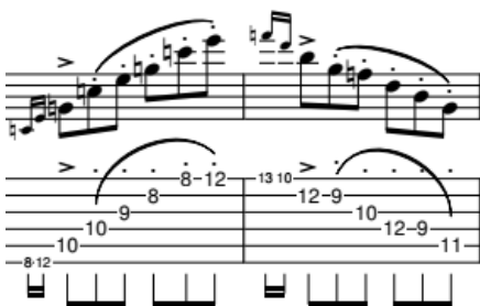
Ilustración 22 Capricho24 – Paganini. compases 106 y 107

La transición del Capricho al jazz "Georgia on my Mind" es una transición fluida y directa. Esto significa que no se introducen cadencias o modificaciones en la melodía. En su lugar, se busca un momento en el que exista cierta similitud rítmica y melódica con el destino de la modulación. Para lograr una transición más sutil, se utiliza un calderón al final del Capricho.