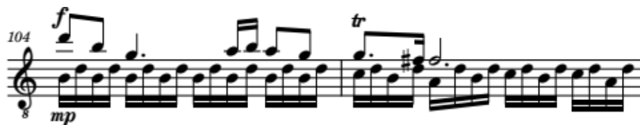
Ilustración 4 Allegro (Sonata para piano No. 16 K. 545) - Wolfgang Amadeus Mozart. compases 104 y 150.

Además, es importante tener en cuenta la utilización de una amplia gama de dinámicas y matices para resaltar las distintas secciones y los momentos emotivos de la sonata, manteniendo un equilibrio con la velocidad requerida en la obra. Asimismo, se debe mantener un tempo constante y apropiado a lo largo de toda la sonata, asegurándose de mantener una pulsación sólida para