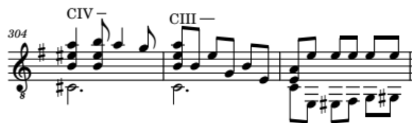
Ilustración 13 Pueblito Viejo - José Alejandro Morales (arr. Andrés Villamil) Compás 304 – 306.

Para finalizar esta obra, se conserva fielmente el final del arreglo de Andrés Villamil, donde se pueden apreciar los compases 316 al 319. En esta sección, se presenta una progresión armónica notable, destacada por la inclusión del acorde Ebmaj7. Este acorde se toma prestado de la tonalidad de Sol menor, donde desempeña el papel de IV grado. Al incorporar este acorde en la progresión, se logra crear una sonoridad más rica y compleja. A continuación, se continúa con el acorde Bm, que representa el vi grado de la tonalidad de Sol mayor, aportando un matiz modal y añadiendo una sutil tensión armónica. Por último, la progresión resuelve en el acorde G, que es el I grado en la tonalidad de Sol mayor, brindando una sensación de estabilidad y conclusión agradable al oído. Esta selección armónica confiere un cierre convincente y satisfactorio a la obra.