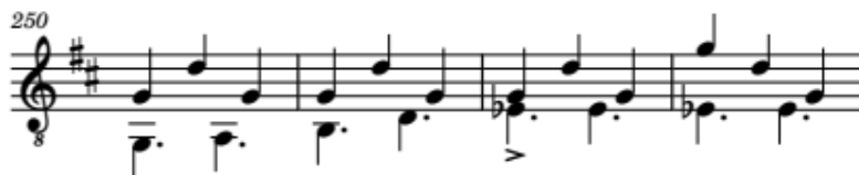
Ilustración 11. Reyna (Miriam & Leon`s Daughters) - Celil Refik Kaya. Compás 250-253.

Uso del voicing en la soprano para mayor naturalidad en la transición.