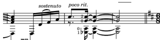
Ilustración 9 Danza característica" - Leo Brouwer. Compás 205 y 206.

Para lograr una transición suave hacia la siguiente obra, se tomó la decisión de parar en el compás 206 con un acorde de La menor con bajo en Mi bemol (Am/Eb). Este acorde posee un lenguaje armónico que se asemeja mucho al vocabulario armónico de la siguiente pieza musical, además de desempeñar la función de quinto grado que se resolverá en un acorde de Re mayor. Esta transición resulta particularmente natural, ya que es posible aprovechar un acorde existente en la obra actual sin necesidad de añadir ningún otro elemento adicional.