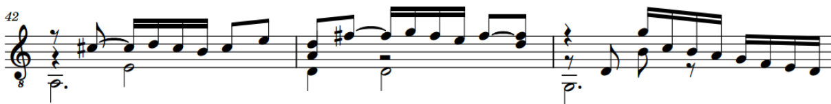
Ilustración 2 The Earl of Essex his Galliard - John Dowland. compás 42-44.

Para la transición a la siguiente obra que pertenece al periodo barroco, se sugiere hacer una cadencia utilizando tres dominantes de manera continua para realizar el paso de La menor a Do mayor. La progresión comienza con un compás que pertenece a la obra y que está en La mayor, se sugiere hacer el siguiente compás con una figuración rítmica similar y un diseño melódico que continúe la progresión de manera sutil, y luego, se puede utilizar una de los motivos melódicos que se habían expuesto anteriormente, con el fin de hacer la cadencia en la dominante y pasar al Do Mayor que es el primer acorde de la siguiente obra perteneciente al Barroco.