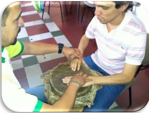
Gráfico 14, Quemada cerrada

Golpe Quemado: este golpe se realiza con las yemas de los dedos golpeando el cuero y dejando los dedos fijos en él, generando un sonido seco, a esto se le llama quemada cerrada , y al golpear con la yema de los dedos y retirarlos rápido del cuero el sonido es brillante, a esto se le llama quemada abierta , ejemplo: