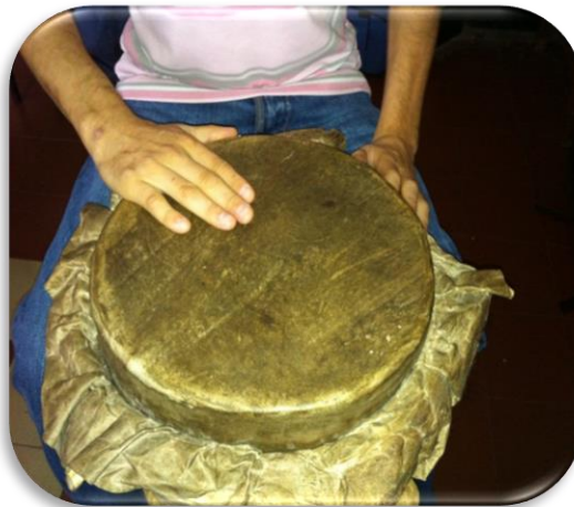
Gráfico 16. Básico cerrado

Golpe básico: este golpe se realiza con los dedos de la mano en la parte baja o cerca al borde del tambor, sin involucrar la palma de la mano, al golpear con los dedos y dejarlos sobre el cuero el sonido sale opaco, y se llama golpe cerrado ; al golpear y quitar la mano de forma rápida para que quede vibrando el cuero y el sonido sea brillante se llama golpe abierto . De igual forma se interpreta la conga, ejemplo: