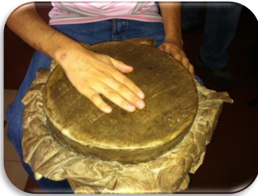
Gráfico 13. Ejemplo golpe de fondeo

Golpe Quemado: este golpe se realiza con las yemas de los dedos golpeando el cuero y dejando los dedos fijos en él, generando un sonido seco, a esto se le llama quemada cerrada , y al golpear con la yema de los dedos y retirarlos rápido del cuero el sonido es brillante, a esto se le llama quemada abierta , ejemplo: