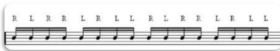
Gráfico 19. Ejemplo Paradiddle

Superada esta primera fase, se inició el trabajo con los golpes dobles logrando mejorar la destreza en las manos y agilidad para la interpretación del instrumento. Para finalizar con los ejercicios de técnica, se les enseñó el paradiddle que es la combinación del golpe sencillo con golpe doble.