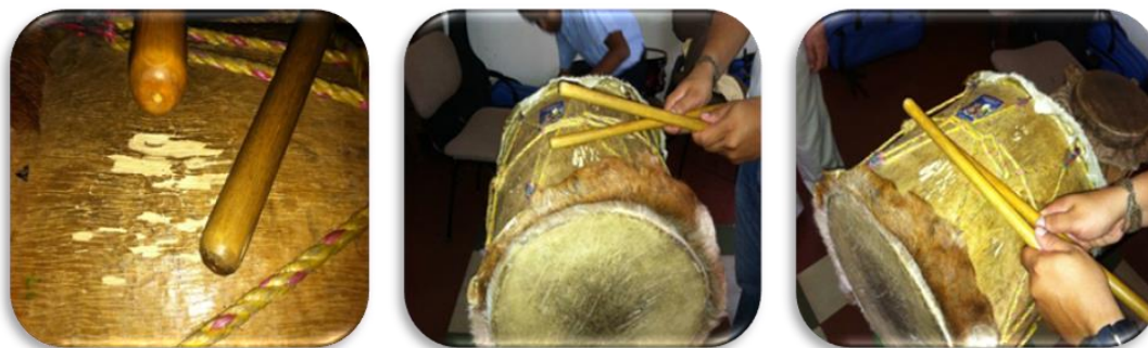
Gráfico 10. Ejemplo paloteo

Paloteo: Es el golpe que se realiza con las baquetas sobre la madera de la tambora como se puede ver en la gráfica: