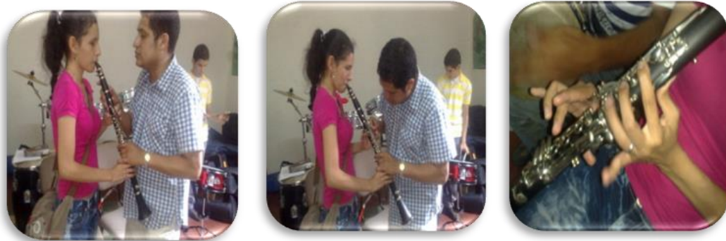
Gráfico 5. Reconocimiento del clarinete

Se ubicaron los dedos en los 7 orificios del instrumento verificando que los dedos meñiques de cada mano quedaran libres, se indicó que la mano izquierda va arriba, que se utilizan los dedos índice, anular y corazón, en la parte de adelante del instrumento y el dedo pulgar cubre el orificio de la parte de atrás. Se enseñó que la mano derecha va abajo utilizando también los dedos índice, anular y corazón en la parte de adelante y el dedo pulgar sostiene el clarinete en el soporte que esta ubicado en la parte de atrás del clarinete.