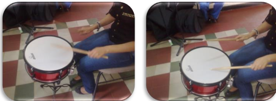
Gráfico 20. Ejercicio redoblante

Los ejercicios de técnica de redoblante se realizaron también para la interpretación de los timbales latinos, ya que estos también requieren soltura y destreza interpretativa de la muñeca.