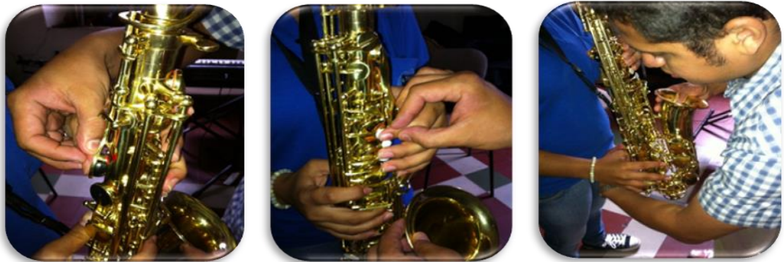
Gráfico 6. Reconocimiento del saxofón

La escala natural que se utilizó para iniciar en el saxofón alto es Sol Mayor iniciando desde la nota Sol que se interpretó con la mano izquierda.