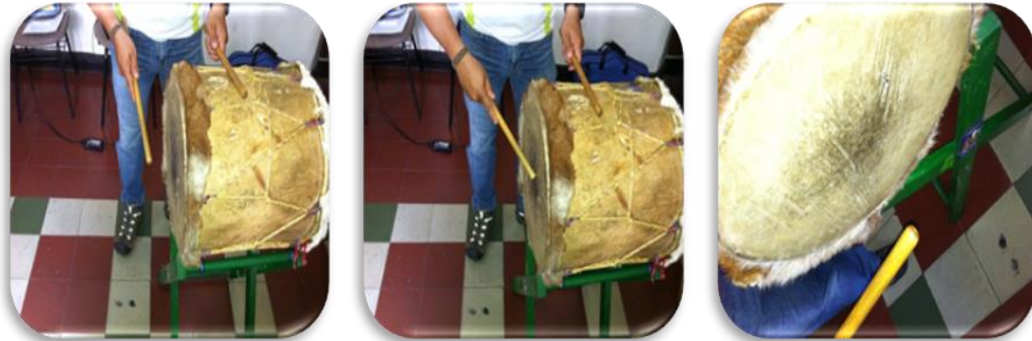
Gráfico 11. Ejemplo de golpe abierto

Golpe abierto: Este golpe se realiza el cuero de la tambora con la baqueta, dejando que esta rebote y no tenga más contacto con el cuero, ejemplo: