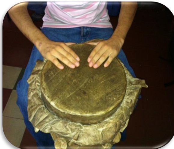
Gráfico 9. Ejemplo de segunda etapa

Segunda etapa: Una vez reconocidos los instrumentos, se les indicó la postura correcta del cuerpo y las manos, teniendo en cuenta si son de contacto directo o indirecto (membranófonos o idiófonos).