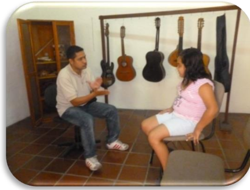
Gráfico 2. Ejemplo