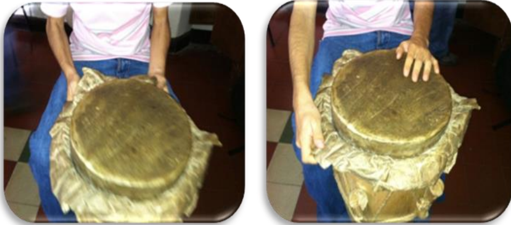
Gráfico 8. Ejemplo primera etapa

maracas, timbales y congas. Esto les permitió interiorizar aspectos como formas, dimensiones, pesos y texturas.