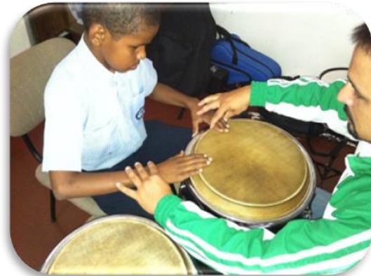
Gráfico 18. Ejemplo golpe canto