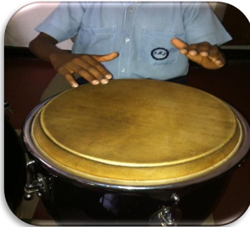
Gráfico 17. Básico abierto

Golpe de canto: Este golpe se realiza en el borde u orillo del tambor (llamado canto) con la punta de los dedos, este mismo golpe se hace en la conga; ejemplo: