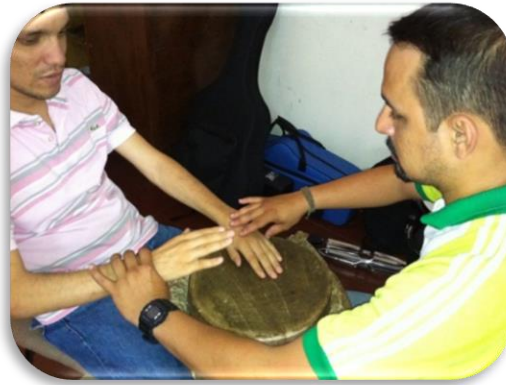
Gráfico 15. Quemada abierta

Golpe básico: este golpe se realiza con los dedos de la mano en la parte baja o cerca al borde del tambor, sin involucrar la palma de la mano, al golpear con los dedos y dejarlos sobre el cuero el sonido sale opaco, y se llama golpe cerrado ; al golpear y quitar la mano de forma rápida para que quede vibrando el cuero y el sonido sea brillante se llama golpe abierto . De igual forma se interpreta la conga, ejemplo: