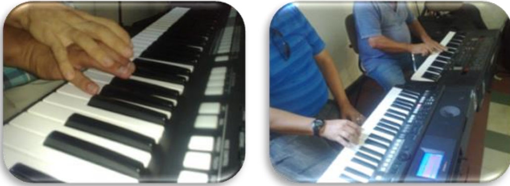
Gráfico 7. Reconocimiento de pianos

docente. De esta manera se garantizó que el estudiante pudiera imitar los movimientos realizados por el docente y después los realizará solo.