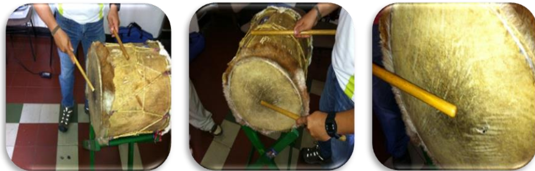
Gráfico 12. Ejemplo golpe cerrado

Golpe cerrado: Se golpea con la baqueta o golpeador el cuero y se deja pegado en el cuero haciendo un poco de presión, ejemplo: