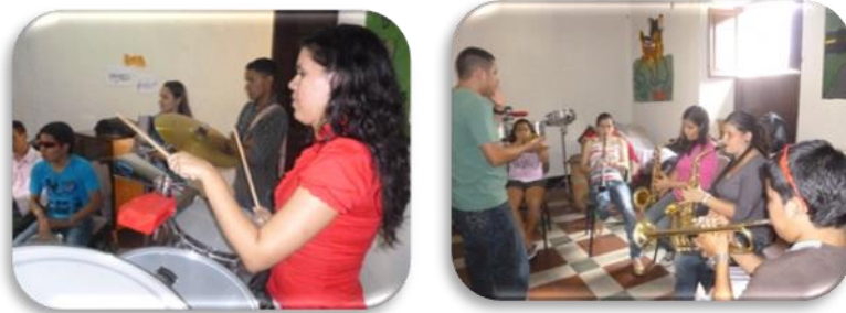
Gráfico 21. Montaje de repertorio

Los pianistas primero escucharon la canción y después se les enseñaron los acordes a interpretar en el tema musical.