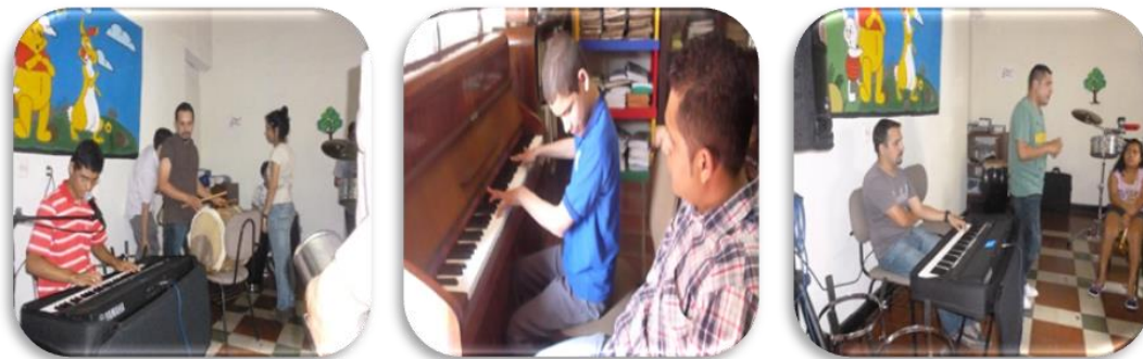
Gráfico 22. Montaje de repertorio

Para el montaje de las canciones se realizaron ensayos parciales entre instrumentos de viento, percusión, pianos y voces. Y después se hizo el ensamble en ensayos generales cada 15 días.