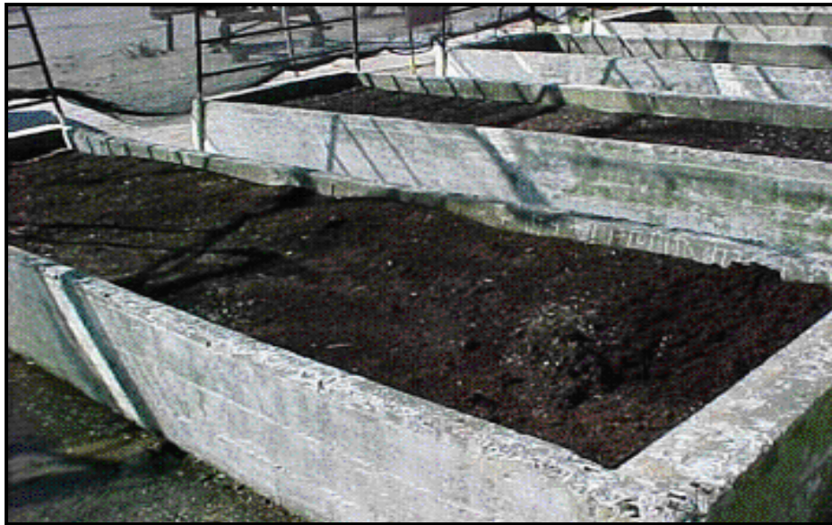
Foto 7. humus de lombriz