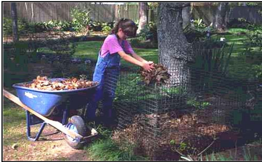
Foto 4. Elaboración de compost en forma manual

del suelo permanecerán no asimilables por las plantas en los suelos pobres o carentes de humus.