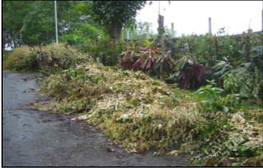
Foto 12. Montículos de hojas secas zona canchas UIS