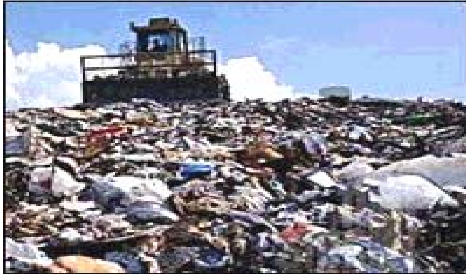
Foto 1. Botadero de basura a cielo abierto