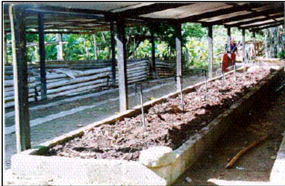
Foto 15. Lecho o era para lombrices