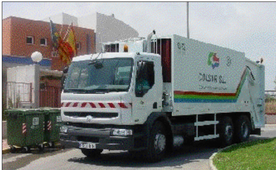
Foto 2. Carro recolector de basura

2.1.12 Otros tratamientos intermedios y avanzados. Son procesos que permiten darle un aprovechamiento a los residuos sólidos, principalmente para producir diferentes tipos de energéticos e insumos comerciales.