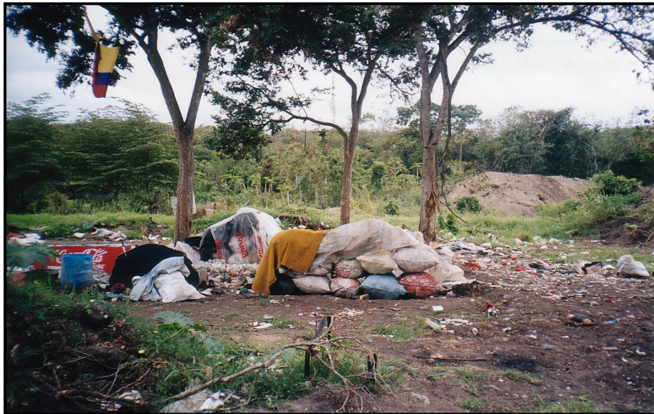
Foto 3. Residuos sólidos

Fuente: Ministerio del Medio Ambiente 2001