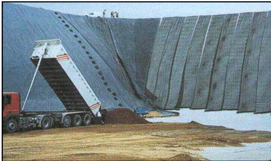
Foto 5. Relleno sanitario