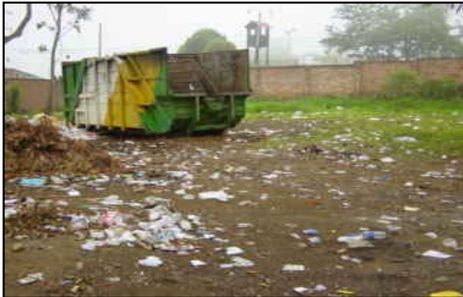
Foto 8. Zona oriental UIS contenedor Emab

Actualmente este terreno no se le ha dado por parte de la UIS una destinación específica.