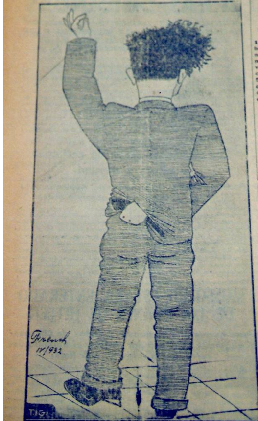
Ilustración 8. Juancé y los sucesos de Gámbita

Luego de los sucesos violentos ocurridos en las elecciones del 1 de febrero de 1931, y debido a la fuerte oposición política de los gobiernos liberales, Juancé comienza a ser presentado por Vanguardia Liberal como un incitador a la violencia. Especialmente, en vísperas y durante las elecciones en que participaba el conservatismo.