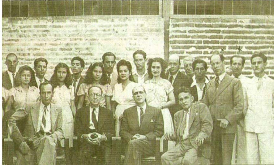
Ilustración 5. Celebración de aniversario de fundación del Diario Conservador de Bucaramanga, “El Deber”