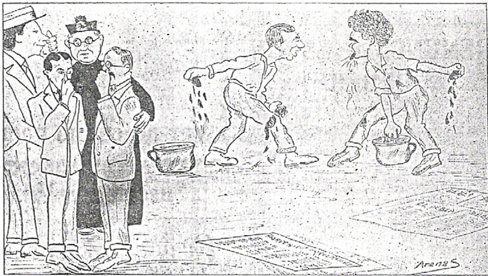
Ilustración 7. Los campeones de bass-inilla